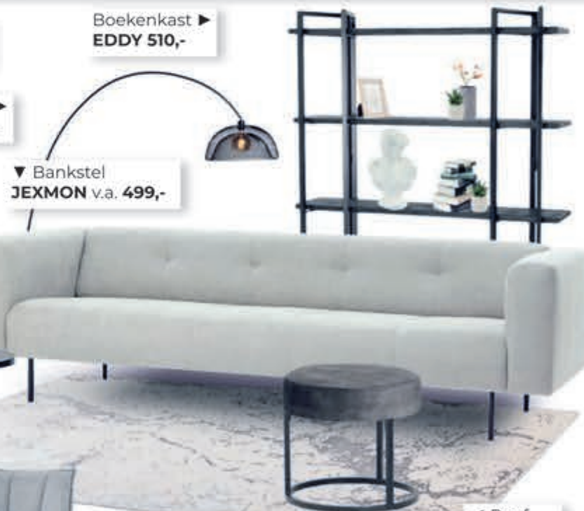
Boekenkast ► EDDY 510,-