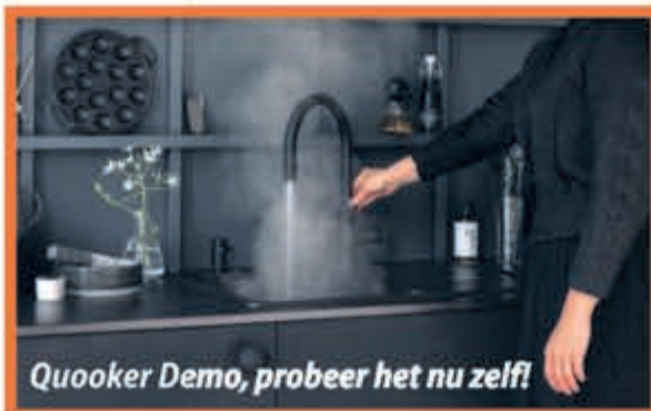
Quooker Demo, probeer het nu zelf!