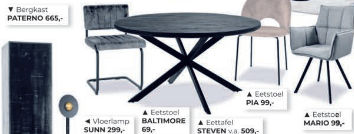
▼ Bergkast PATERNO 665,-