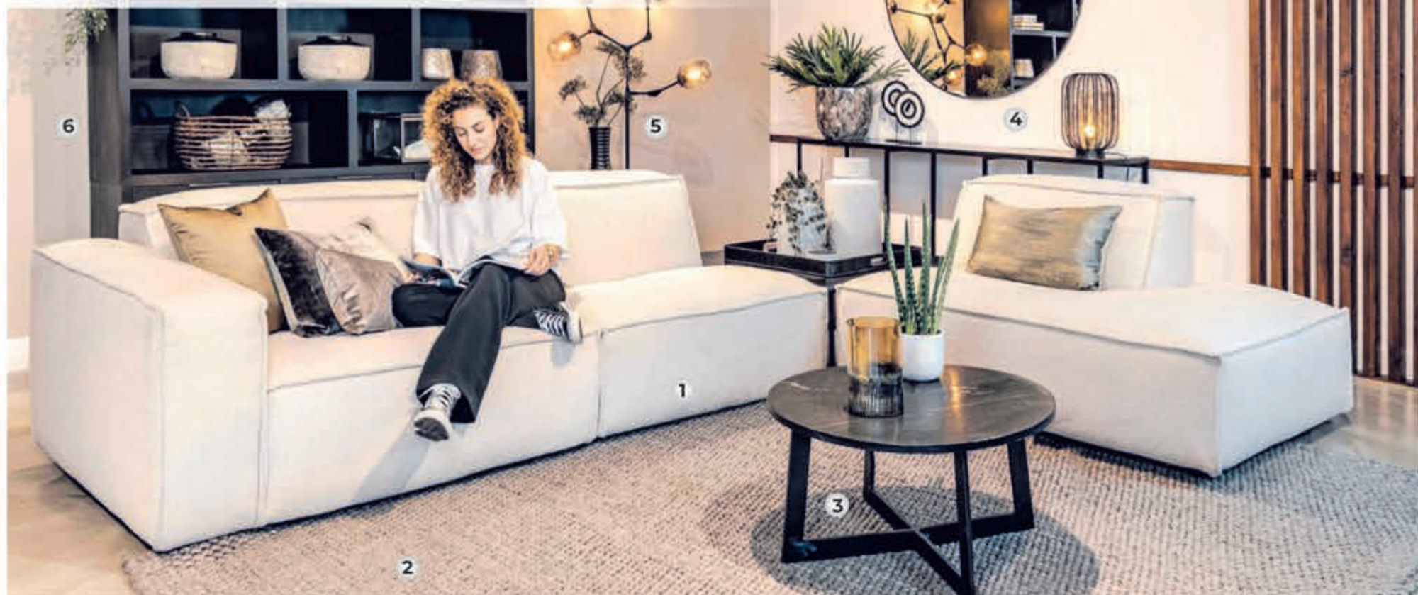
► 1. Loungebank HOLIDATE zoals afgebeeld v.a. 1596,- | ► 2. Vloerkleed NEW LOOP v.a. 899,- | ► 3. Salontafel MAJOR 189,- | ► 4. Wandtafel MIX & MATCH 365,- | ► 5. Vloerlamp LIME 299,- | ► 6. Boekenkast ESTABLISHED 1849,- |