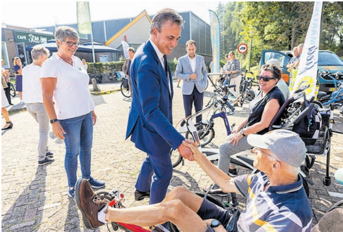
Minister Harbers van Infrastructuur en Waterstaat bezoekt maandag 12 september een Doortrappen-Dag in gemeente De Ronde Venen.