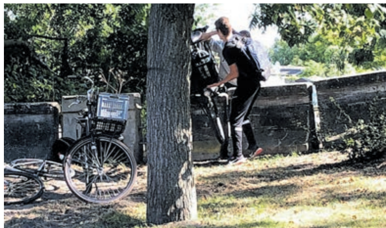
En nog steeds klimmen ze met fiets en al eroverheen.

De gemeente Uithoorn weet van de problematiek en heeft de vraag gekregen om iets aan de situatie te doen omdat het er gevaarlijk is. "We hebben kleine hekjes neergezet, struiken en bomen geplant, maar niets hielp. Fietsers uit de K- en B-buurt pakken alsnog de makkelijkste weg naar Amstelveen. We kunnen geen fietsoversteek maken op de Zijdelweg, omdat daar geen ruimte voor is. De betonblokken zijn een tijdelijke oplossing. Er wordt nog gekeken naar een definitieve oplossing, maar dat is niet eenvoudig", reageert de gemeente.