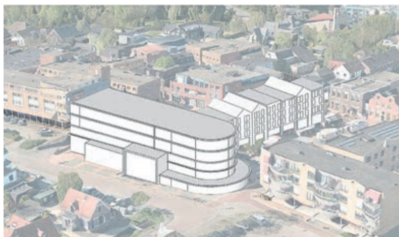
Maakt de oudbouw van het gemeentehuis aan het Raadhuisplein plaats voor woningen en komen er 2 verdiepingen op het deel van het gemeentehuis aan de Croonstadtlaan

Financieel ontlopen de 2 plannen er elkaar niet veel. Uit eerste berekeningen blijkt dat (nieuwbouw) 24 miljoen euro kost. De kosten van een renovatie worden becijferd op 22,4 miljoen euro. Daar staat tegenover dat er bij de nieuwbouw meer ruimte is voor woningbouw en er dus meer opbrengsten zijn. Plan 1 biedt de mogelijkheid ongeveer 70 woningen in het centrum van Mijdrecht te bouwen en plan 2 gaat uit van de bouw van ongeveer 35 woningen. Wethouder Van Uden: „De bespreking van de startnotitie in de gemeenteraad is de eerste stap om tot een definitief besluit te komen. Graag horen we van de gemeenteraad of we deze 2 scenario's verder kunnen uitwerken.. Als de 2 scenario's zijn uitgewerkt is het woord aan de inwoners. Zij kunnen op basis van de uitgewerkte scenario's dan in het referendum aangeven welk scenario volgens hen het beste is.”