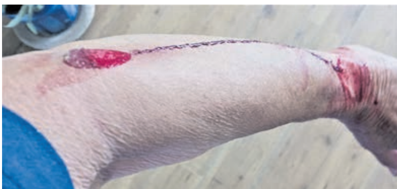
Een fikse wond van het stuur bleef over en een kneusing.