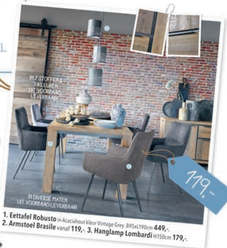
1. Eettafel Robusto in Acaciahout kleur Vintage Grey. B95xL190cm 449,-. 2. Armstoel Brasile vanaf 119,-. 3. Hanglamp Lombardi H150cm 179,-.