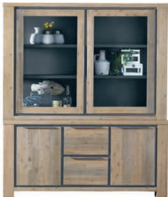
Buffetkast Robusto in Acaciahout kleur Vintage Grey. H200xB168xD40/45cm 1199,-.

Barrio 2,5-Zit's (2x70) met arm, 2,5-zits (2x80) met arm hoge rug caramél, excl. luxe opties, vanaf 439,-. 2. Wandmeubel Castano zwart (hxbxd) 129x035x032 cm, excl. accessoires 139,-. 3. Wandmeubel Castano zwart (hxbxd) 026x172x032 cm, excl. accessoires 129,-. 4. Salontafel Miori eiken zwart staal (hxbxd) 047x070x120 cm, excl. accessoires 159,-.