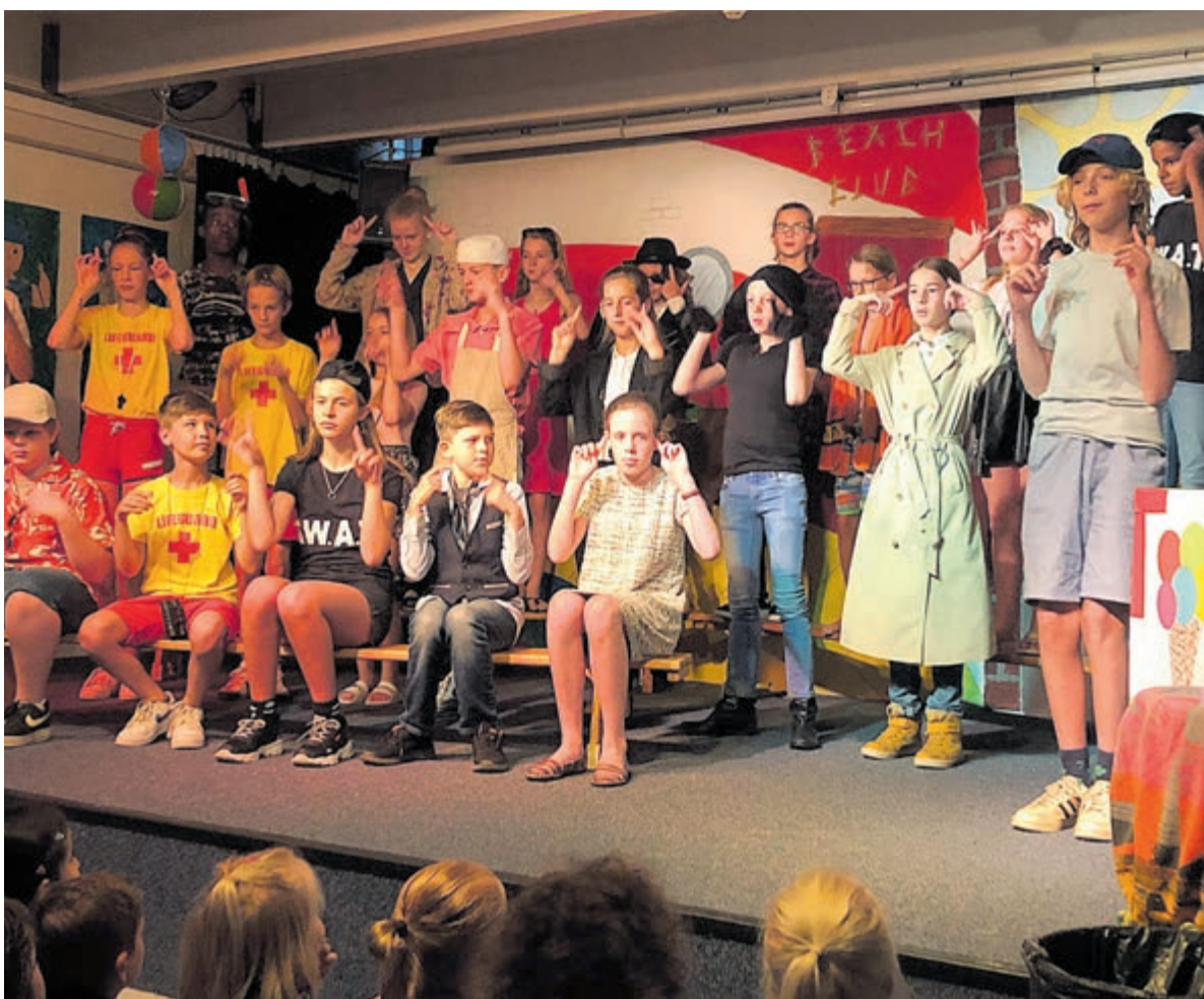
Groep 8. tijdens de eindmusical 'Expeditie Beachclub' met het nummer "Boem!"