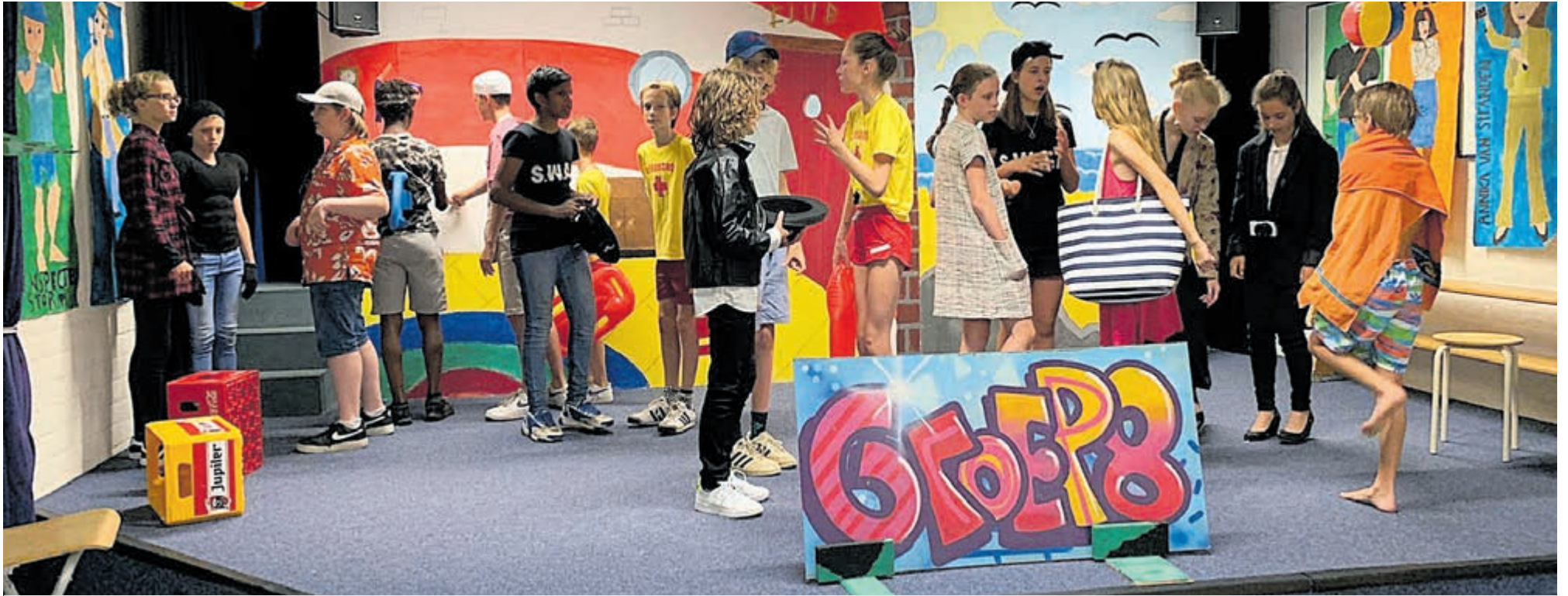
Groep 8 in voorbereiding op de musical 'Expeditie Beachclub'