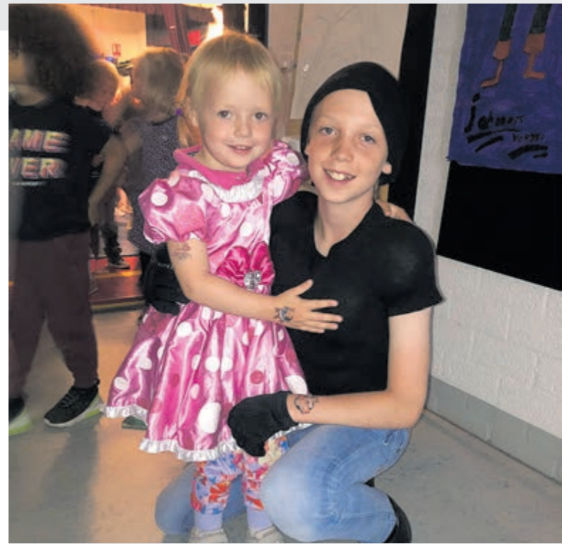
Als je grote broer in groep 8 zit en jij volgend schooljaar gaat starten in groep 1, is dat best een beetje jammer