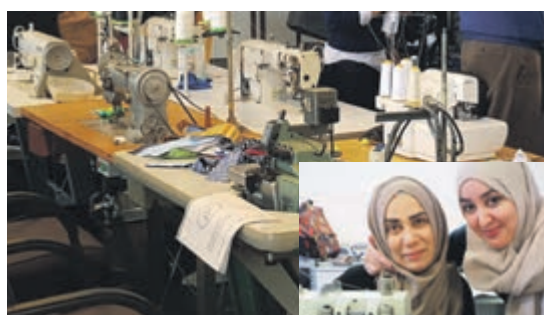
Initiatief: Het wijkatelier

deze wijken kunnen dat in deze tijd goed gebruiken. Het wordt steeds zichtbaarder wat met de bijdragen van SLS wordt gerealiseerd en dat is fijn om te zien."