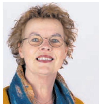
Ans Gierman DUS

Het jaar 2020 sluiten we af met een tekort van € 700.000. Corona en het Sociaal Domein zijn de grootste oorzaken. Er worden op korte termijn maatregelen ingezet, maar we maken ons wel zorgen over de lange termijn. We teren in op ons eigen vermogen vooral gevuld van de Enecogelden. We willen dan ook graag na het zomerreces een discussie in de raad over deze Enecogelden. Willen we deze inzetten om gaten in de begroting te dichten of inzetten voor duurzame investeringen met rendement. Als DUS! vinden wij namelijk dat we niet de volgende generatie kunnen opzadelen met grote schulden. Wordt dus vervolgd. We zijn er trots op dat we als gemeente, ook binnen de raad, samen onze schouders onder alle opgaven zetten. Als DUS! willen we dan ook een oproep doen om ons gezamenlijk in te blijven zetten voor een sociale, financieel gezonde, met een woning voor iedereen oog houdend voor de balans tussen groen en bebouwing en natuurlijk een duurzame samenleving.