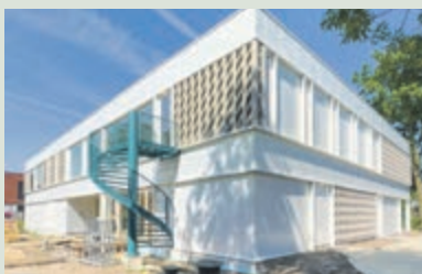
Foto bouw Thamerdal