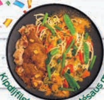
Kipdijfiletstukjes in satésaus met mihoen