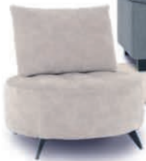
▼ Fauteuil FLOYD v.a. 299,-