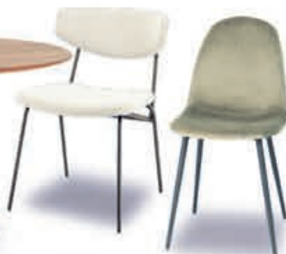
▲ Eetstoel CROCKETT 94,-