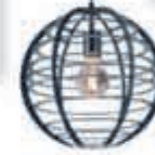
◀ Hanglamp PLUTO 119,-