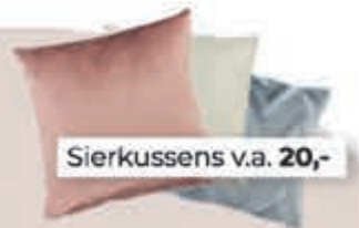
Sierkussens v.a. 20,-