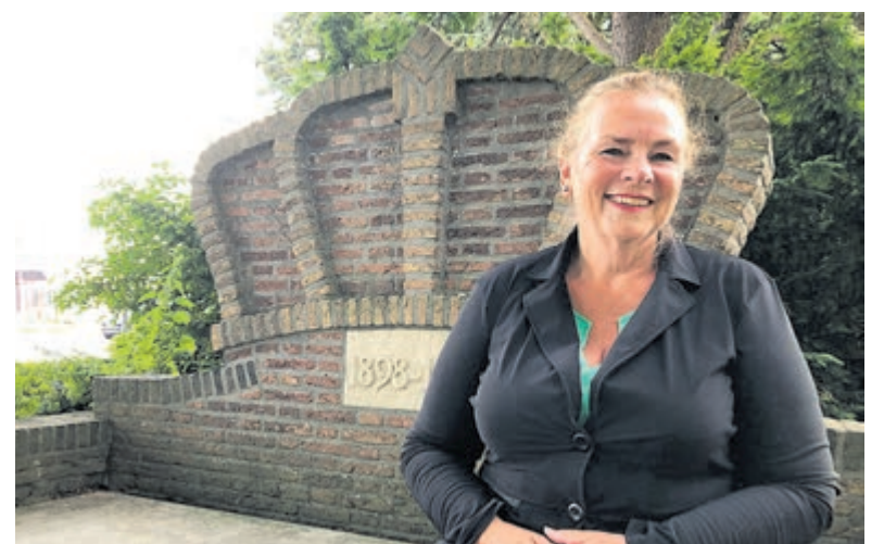
Wellicht is het Wilhelminabankje een mooie locatie voor het Witte Anjer Perkje