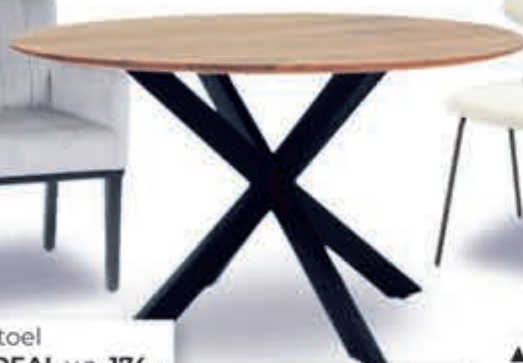
▲ Eettafel OSLO v.a. 413,-