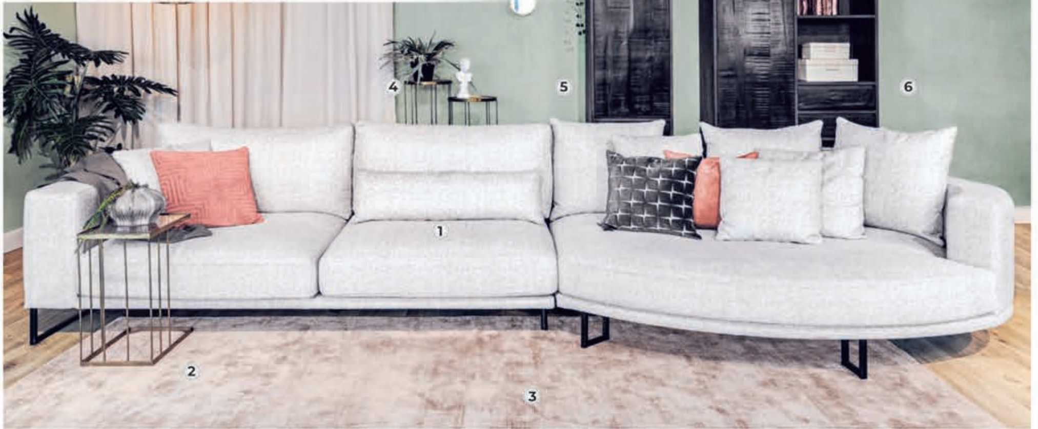
► 1. Loungebank DORDONI zoals afgebeeld v.a. 1529,- | ► 2. Laptoptafel CAESAR 85,- | ► 3. Vloerkleed BRAGA v.a. 231,- | ► 4. Pilaar CAESAR 75,- | ► 5. Bergkast PATERNO 569,- | ► 6. Barkast PATERNO 945,-