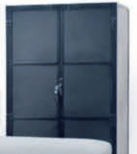
► Vitrinekast KM-5862 736,-