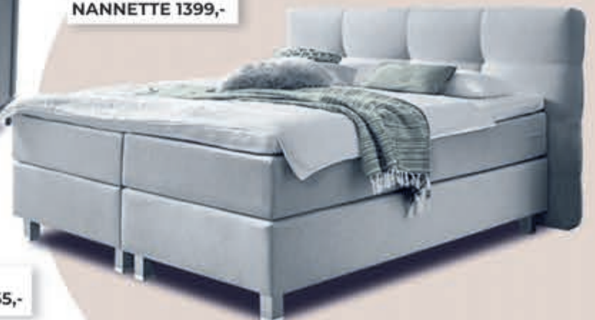
Boxspring ▼ NANNETTE 1399,-