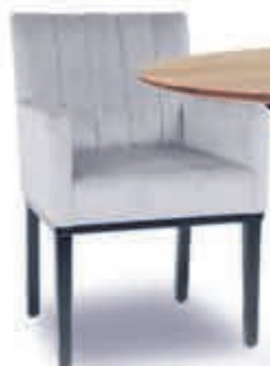
▲ Eetstoel MONTREAL v.a. 174,-