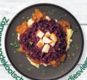
Zomerse rodekoolschotel met draadjesvlees