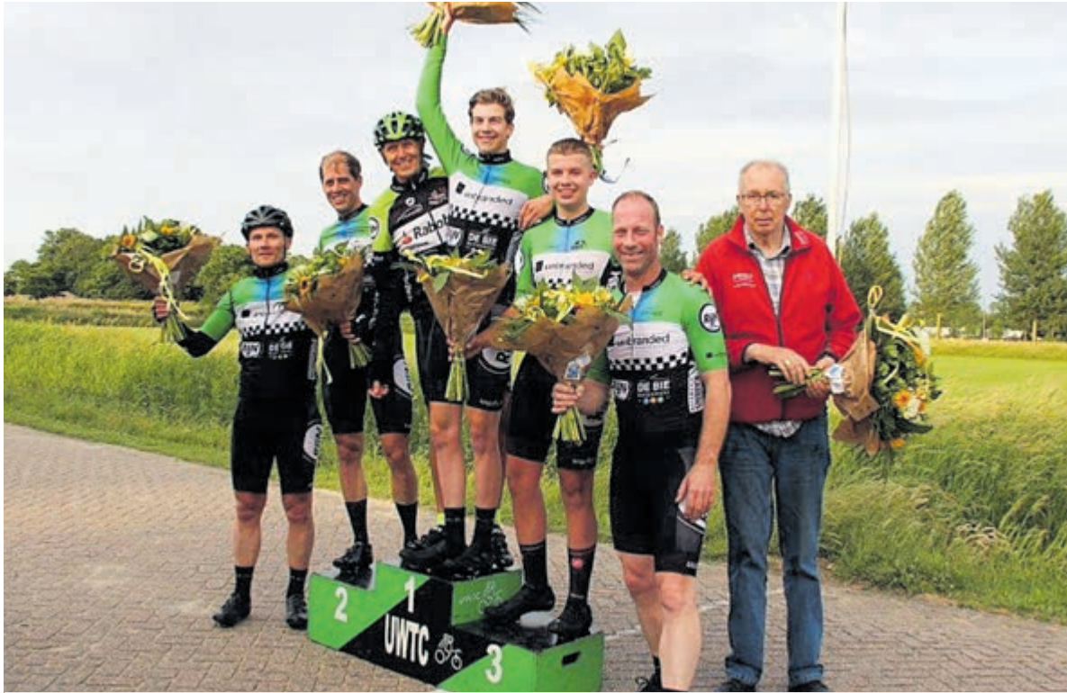
Winnaars Henny Cornelissen Classic 2021.