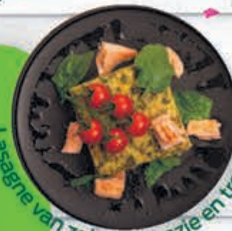
Lasagne van zalm, spinazie en tostiomaat