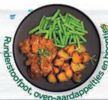
Runderstouffpot, oven-aardappeltjes en boontjes