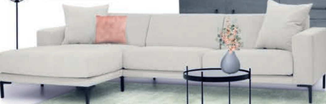
Loungebank GUETTA ▲ zoals afgebeeld v.a. 1068,-