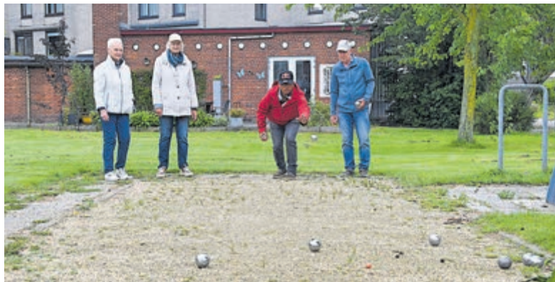
De Jeu de Boules-groep van De Beweegkamer in Mijdrecht.

Verschillende deelnemers kwamen langs voor een potje Jeu de Boules, een kop koffie en een goed gesprek. Voor een gezamenlijke foto wilde iedereen graag even de aandacht trekken, in de hoop nog meer inwoners enthousiast te maken om naar buiten te komen en mee te doen. Het is fantastisch om samen bezig te zijn. "De muren thuis zeggen niks terug", vertelde één van de fanatieke Jeu-de-Boules-spelers met een glimlach.