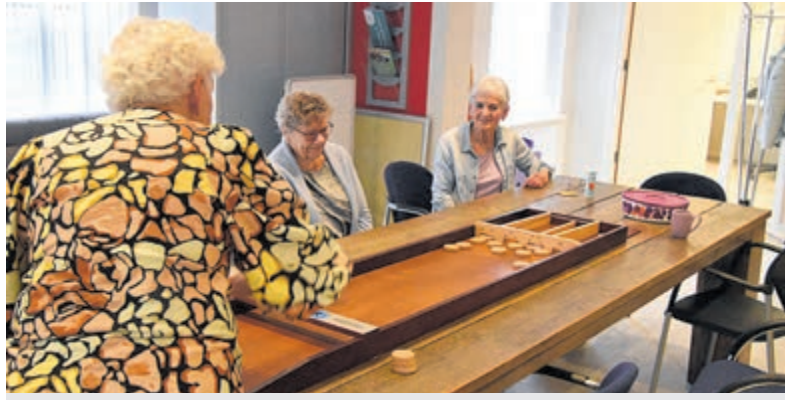
Met de sjoelbak op de foto.