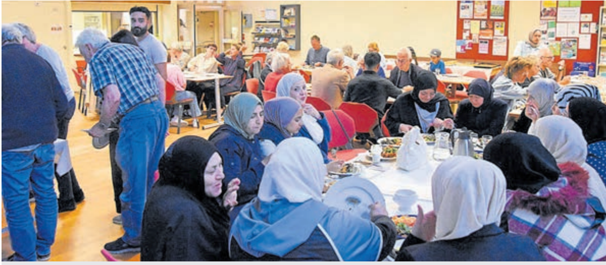
De Multiculti Eettafel draait niet alleen om eten, maar vooral om ontmoeting tussen verschillende culturen.