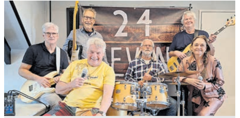
24Seven ook op het Midzomer Walnootfeest.

Alle materialen, waaronder de boules ballen, zijn aanwezig. Vrijwilligers zorgen voor de koffie en ontvangen nieuwe bezoekers graag. Iedereen die op een laagdrempelige manier wil bewegen en andere mensen wil ontmoeten, is van harte welkom om eens binnen te lopen. Zoals de deelnemers zelf zeggen: "Samen bewegen is niet alleen gezond, maar vooral ook heel gezellig."