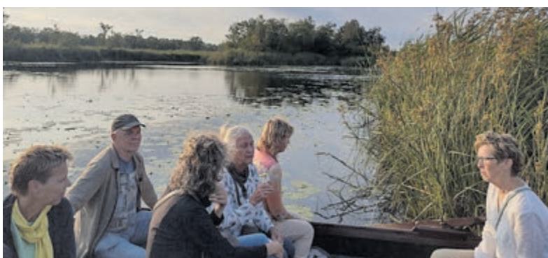
Een verhalenroeitocht door Botshol.

gebied van Botshol, terwijl de vertellers verhalen brengen die aansluiten bij de sfeer van het landschap. Niet zozeer kennis over flora en fauna staat centraal, maar vooral de beleving: tussen de rietkragen, langs bloeiende waterlelies en over smalle vaarten voeren de verhalen langs de wereld boven en onder de waterspiegel. Halverwege de tocht wordt aangelegd bij een eiland, waar zittend in de boten een hapje en drankje wordt geserveerd. De vertellers wisselen daar van boot, waarna de tocht in de avondzon wordt vervolgd. De organisatie wijst erop dat deelname alleen geschikt is voor mensen die goed ter been zijn en gemakkelijk in en uit een schommelende roeiboot kunnen stappen. Deelname is op eigen risico. Aanmelden kan via Joke Dekker-Booij, telefoon 06 - 1081 4589.