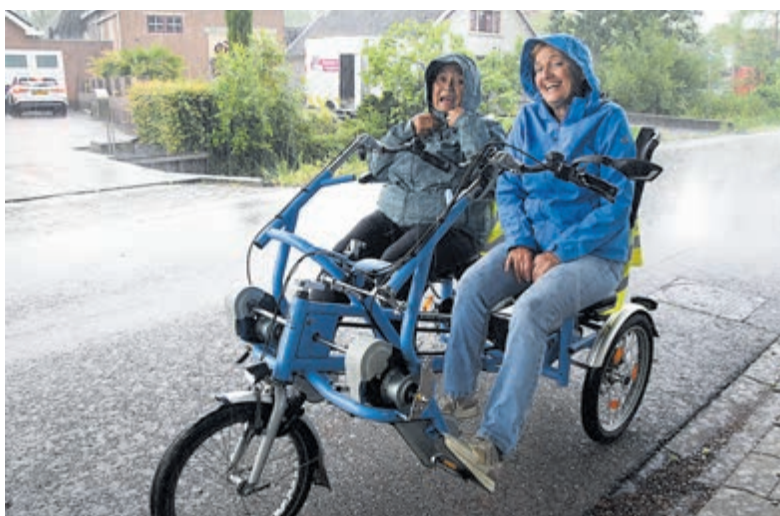
Fietsmaatjes door weer en wind.

aan vrijwilligers, die samen op een elektrische duofiets op pad gaan. Naast elkaar genieten zij van de buitenlucht, beweging en elkaars gezelschap. De ene keer gaat het om een ontspannen rondje door het dorp met koffie en appeltaart, de andere keer om een stevige tocht door weer en wind. Het draait daarbij niet alleen om fietsen, maar vooral om sociaal contact, plezier en het doorbreken van eenzaamheid. Fietsmaatjes wordt mogelijk gemaakt door lokale stichtingen verspreid over Nederland. Inmiddels zijn er op veel plaatsen duofietsen beschikbaar en blijft het aantal deelnemende organisaties groeien. Nadat de bui was overgetrokken en de zon zich weer voorzichtig liet zien, stapten de fietsers opnieuw op. De tocht werd voortgezet en kreeg alsnog een zonnig vervolg.