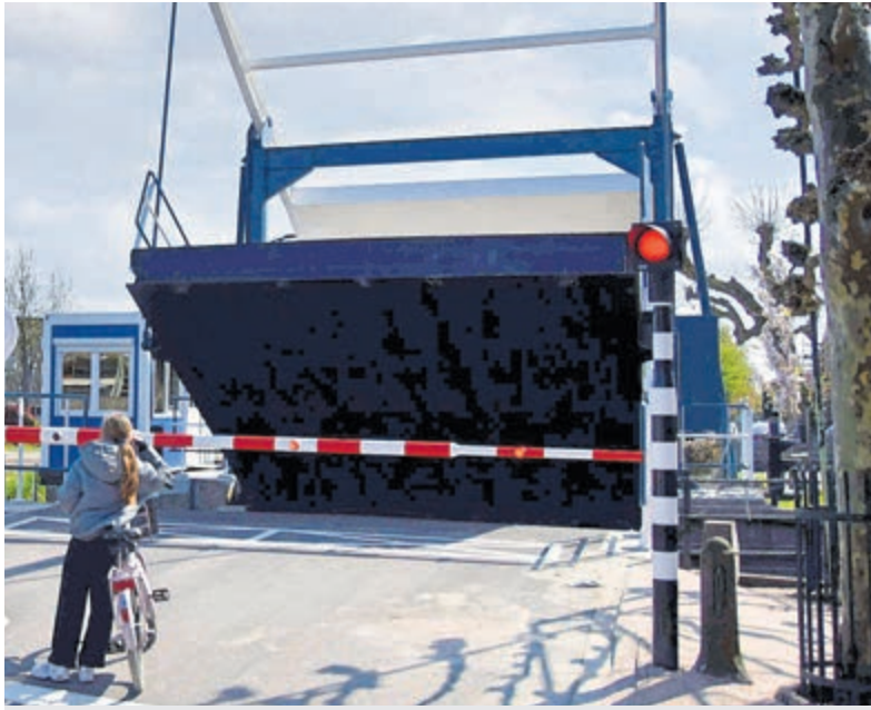
De Heulbrug is volledig vernieuwd.