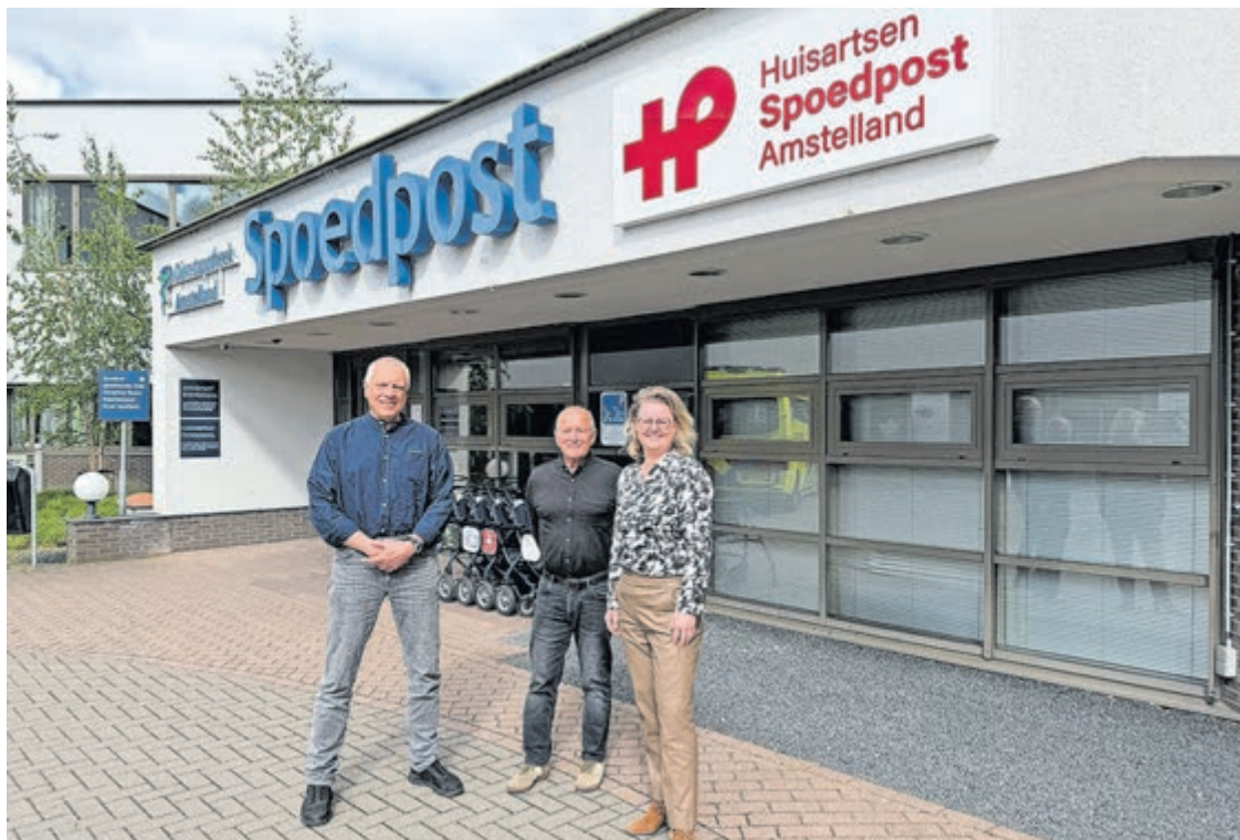
De cliëntenraad van Huisartsenspoedpost Amstelland.

Maar dat neemt niet weg dat de onafhankelijke cliëntenraad ook aandacht vraagt voor kwetsbare groepen zoals ouderen, mensen die moeite hebben met lezen of praten en mensen die beperkt of niet met