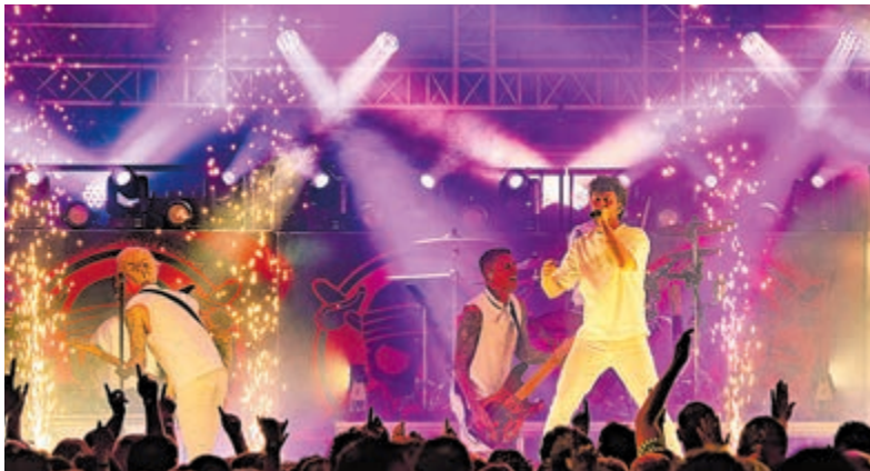
Een sfeerbeeld van verleden jaar.

Het AJOC Festival is al jaren een vaste ontmoetingsplek voor inwoners van De Ronde Venen en de regio. Met de inzet van tientallen vrijwilligers en de steun van lokale sponsors blijft het