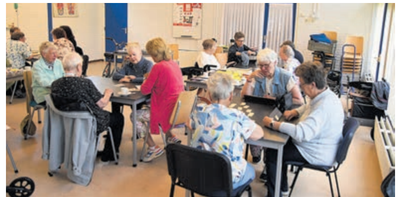
Gezelligheid is troef tijdens de spelletjesmiddag in Vinkeveen.

De huur van het EHBO-gebouw wordt betaald door de katholieke kerk van Vinkeveen. Daarnaast worden er jaarlijks ook twee bingo-middagen georganiseerd, die eveneens op veel belangstelling kunnen rekenen. De spelletjesmiddag maakt deel uit van 'Doen! Hart voor Iedereen', een initiatief van Tympaan-De Baat. Met de inzet van enthousiaste vrijwilligers worden ouderen in De Ronde Venen ondersteund en gestimuleerd om actief te blijven en sociale contacten te onderhouden.