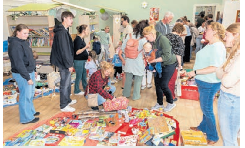
De kleedjesmarkt heeft 705 euro opgebracht voor Make-A-Wish Nederland.

Zevenenveertig Zonnebloemgasten en -vrijwilligers uit Wilnis, De Hoef en Abcoude vertrokken maandag 8 juni per bus naar het Friendship Sports Centre in Amsterdam voor een sportieve dag. De ochtend begon met koffie en appeltaart, waarna onder begeleiding van instructeurs verschillende balspellen en beweegactiviteiten volgden. Aansluitend werd een uitgebreide lunch geserveerd met tomatensoep, kipcurry en als afsluiting een Dame Blanche. Na afloop keerde het gezelschap voldaan terug naar huis. De deelnemers spraken van een geslaagde en gezellige dag. De activiteit werd mogelijk gemaakt door de Riki Stichting.