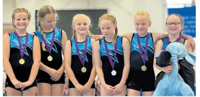
Veenland-turnsters pakken goud in spannende teamwedstrijd.

Het Rondje Eilanden zou niet mogelijk zijn zonder de inzet van meer dan honderd vrijwilligers. Zij bemensen onder meer de eilanden, de boten, de inschrijfbalie en de bar. Aanmelden als vrijwilliger voor deze jubileumeditie kan via www.hetronjeeilanden.nl .