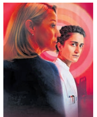
Aangrijpende film 'Second Victims' draait in Filmhuis Mijdrecht.