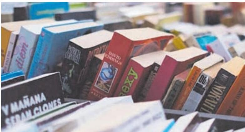
De opbrengst van de boekenmarktverkoop komt ten goede aan de verduurzaming van de pastorie bij de kerk.

Het brugdek en het bewegingswerk zijn vervangen en is een nieuwe beschermende coating aangebracht. Ook is er een modern brugwachtershuisje geplaatst en is de bediening van de slagbomen geautomatiseerd, waardoor deze niet langer handmatig bediend hoeven te worden. De weg heeft nieuw asphalt en nieuwe bestrating gekregen en ondergronds zijn verschillende kabels en leidingen vervangen, waaronder persleidingen en waterleidingen. Dankzij deze werkzaamheden zijn zowel de brug als de weg weer klaar voor de toekomst. De werkzaamheden zijn inmiddels grotendeels afgerond.