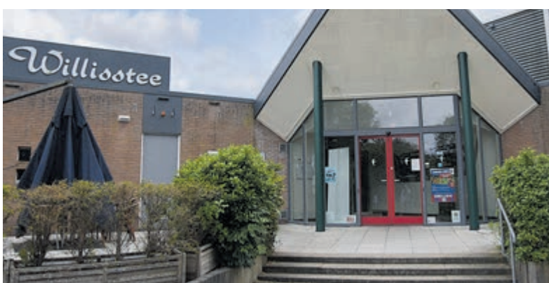
Inloopbijeenkomst in De Willisstee moet duidelijkheid geven over toekomst Wilnis.