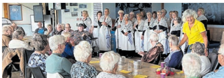
Een deksels leuke Zonnebloem-middag.

Naast ontmoeten en praten met bekenden was er een wervelend optreden van het huisvrouwenkoor De Dekselse Meiden uit Uithoorn en