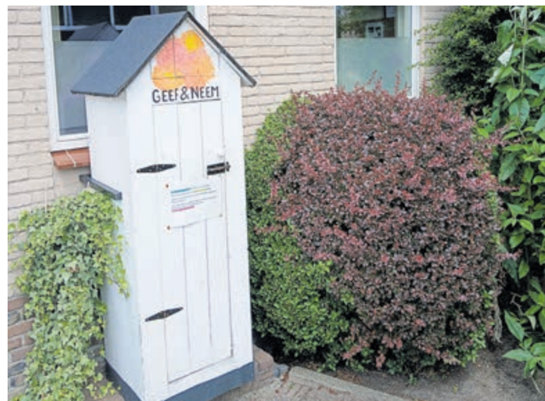
De Geef & Neem-kast vraagt om zorgvuldig gebruik.

omgeving, met Nederlandstalige liedjes met een humoristische knipoog naar het dagelijkse leven. Compleet maf, maar hartstikke leuk. De ruim 50 gasten en vrijwilligers van Zonnebloem Vinkeveen/Waverveen hadden een onvergetelijke middag en menig lied werd uit volle borst meegezongen. De middag was ook de start van de verkoop van de Zonnebloem-loten, waarvan het grootste deel van de inleg beschikbaar is voor de eigen afdeling. Woensdag 15 juli staat de Zonnebloem weer op de jaarmarkt in Vinkeveen. Ook daar zijn loten weer te koop en daarnaast zijn potentiële vrijwilligers en gasten van harte welkom om te bespreken wat zij voor elkaar kunnen betekenen.