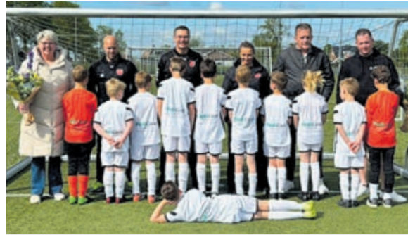
Pedicare op de achterkant.