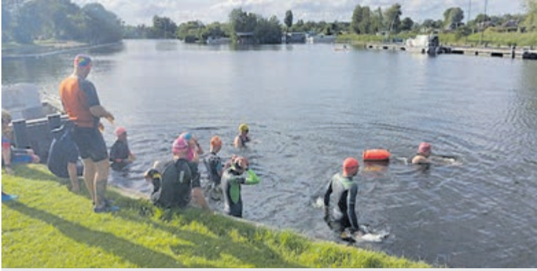
Vooruitlopend op het evenement vond woensdagavond 10 juni het traditionele verkenningsrondje plaats.