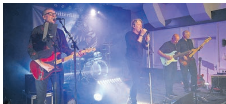
Butterflies & Zebra's opnieuw in 't Oude Parochiehuis.

De Dijk en vele andere bekende artiesten. Butterflies & Zebra's staat bekend om de energieke live-uitvoering en afwisseling tussen stevige rocksongs en bekende meezingers. Ondersteund met een wervelende lichtshow belooft Butterflies & Zebra's opnieuw een sfeervolle muzikavond in 't Oude Parochiehuis. Het optreden begint rond 20.30. De toegang is gratis.