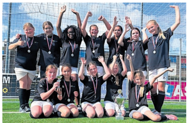
Meisjesgroep 7-8 van de Driehuischool kampioen schoolvoetbal.

Het team werd beloond met een prachtige wisselbeker én een beker om mee naar huis te nemen. Met inzet, samenwerking en sportiviteit en dank aan hun fantastische coaches hebben de meisjes van groep 7-8 van de Driehuischool een topprestatie geleverd waar zij met recht trots op mogen zijn.