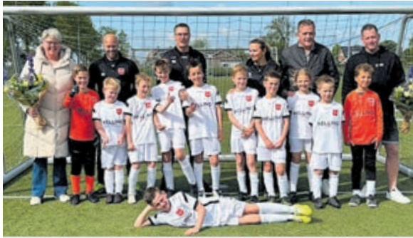
Helling op de voorkant.