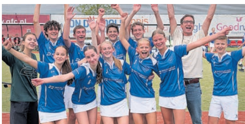
De Vinken U16.

Biljartclub De Merel kan nog leden gebruiken voor de nieuwe competitie voor zowel de interne competitie als De Ronde Venen competitie. Ook dames zijn van harte welkom. Opgeven kan via 06 - 4794 4950, 084 - 794 4949, demereldorus3@gmail.com of aan de bar van Café Biljart DeMerel, Arkenpark Mur 43, Vinkeveen.