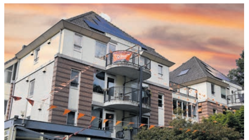
Oranje lucht weerspiegelt spanning rond Oranje.

De combinatie van een vurige lucht en een fanatiek versierd huis laat zien hoe het toernooi leeft in de regio. Supporters maken zich op voor een nieuwe, spannende wedstrijd, waarin Oranje opnieuw alles uit de kast zal moeten halen. De hoop is dat de volgende avondlucht niet alleen oranje kleurt, maar ook een overwinning weerspiegelt. En oplevert.