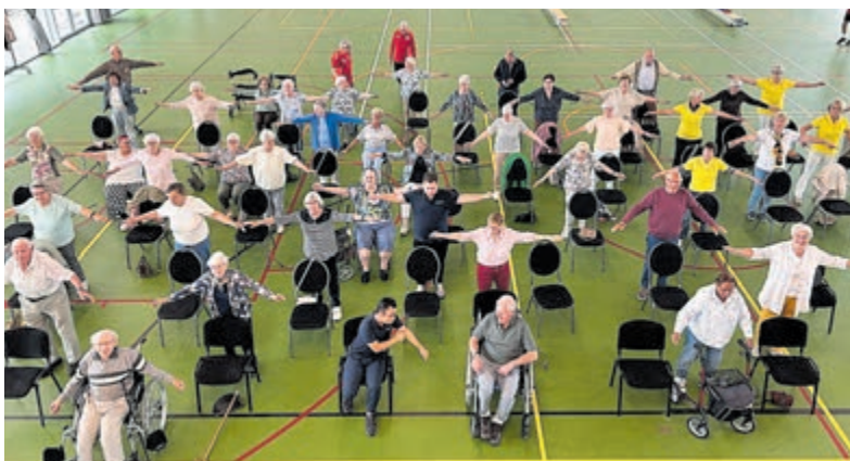
Een sportief Zonnebloemdagje in Amsterdam.