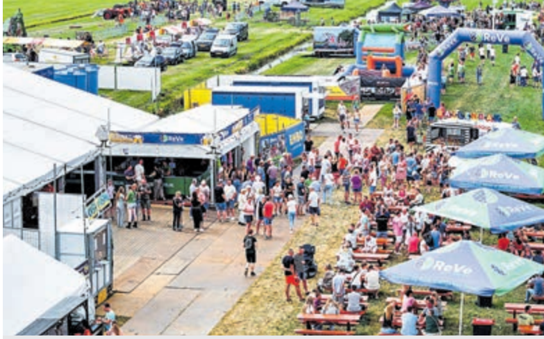
Het 'oude' festivalterrein is compleet vernieuwd.