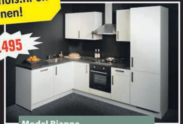
Model Rianne softmat witte keuken uit voorraad, 187 x 275 cm.

Supercompleet met oven, kookplaat, vaatwasser, trechterschouw, koelkast/vriezer, aanrechtblad, spoelbak en kraan, met 5 jaar garantie. Aanpassingen mogelijk!