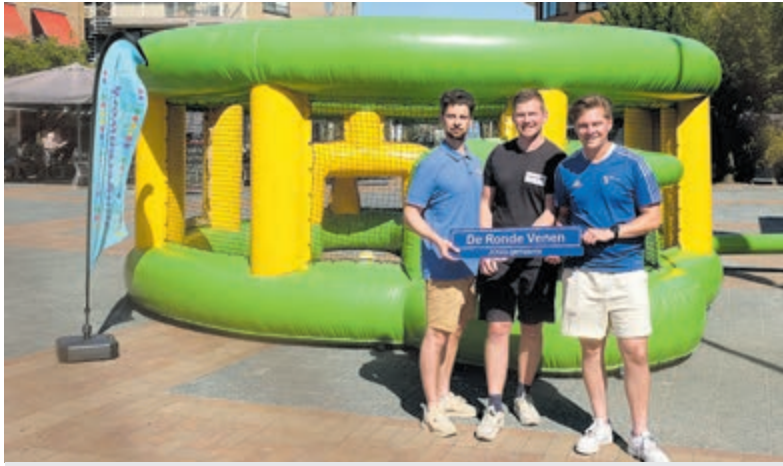
Team Sportservice en het Jongerenwerk (het JOGG-team) voor de opblaasbare voetbalkooi.