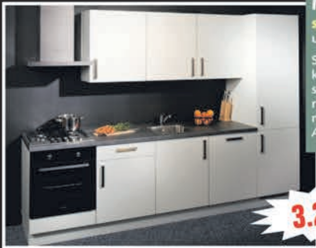
Model Joy softmat witte keuken uit voorraad, 270 cm.

Supercompleet met oven, kookplaat, vaatwasser, brede blokschouw, koelkast/vriezer, aanrechtblad, spoelbak en kraan, met 5 jaar garantie. Aanpassingen mogelijk!