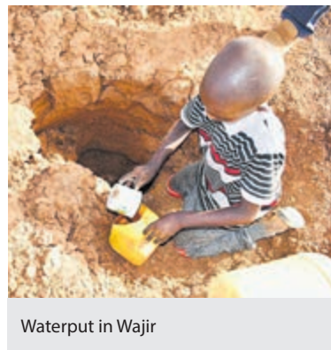
Waterput in Wajir

Gelukkig zijn er ook lichtpunten: de lokale overheid wordt de laatste jaren wél gesteund door Nairobi en krijgt de beschikking over meer autonomie en eigen middelen. Onder andere komt dit ten goede aan onderwijs, gezondheidszorg en infrastructuur. De Stichting Welzijn Wajir helpt bij de transitie van het kwetsbare nomadenleven naar biologische landbouw. Ook heel belangrijk: de positie van vrouwen is sterk verbeterd. Kortom: Wajir van Hopeloos naar Hoopvol!