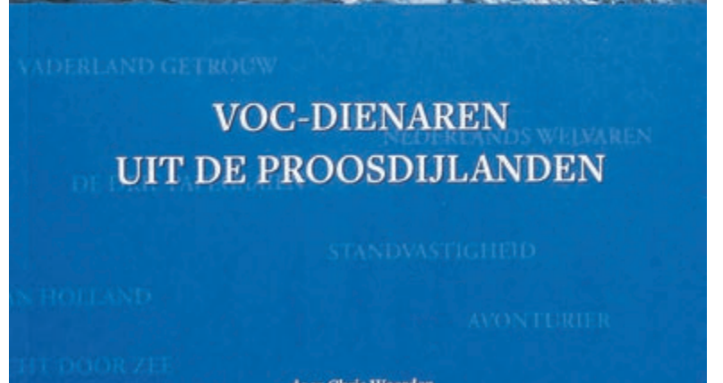
Voorzijde boekje VOC-opvarenden