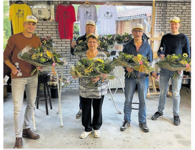
Op bijgaande foto de ploegenprijswinnaars van 2020

In deze oranje zomer jagen de Kwakelse deelnemers een gele droom na. Aanstaande vrijdag mogen zij hun eerste gouden lap in de melkbus in 't Tourhome deponeren. Iedereen veel succes en plezier gewenst!