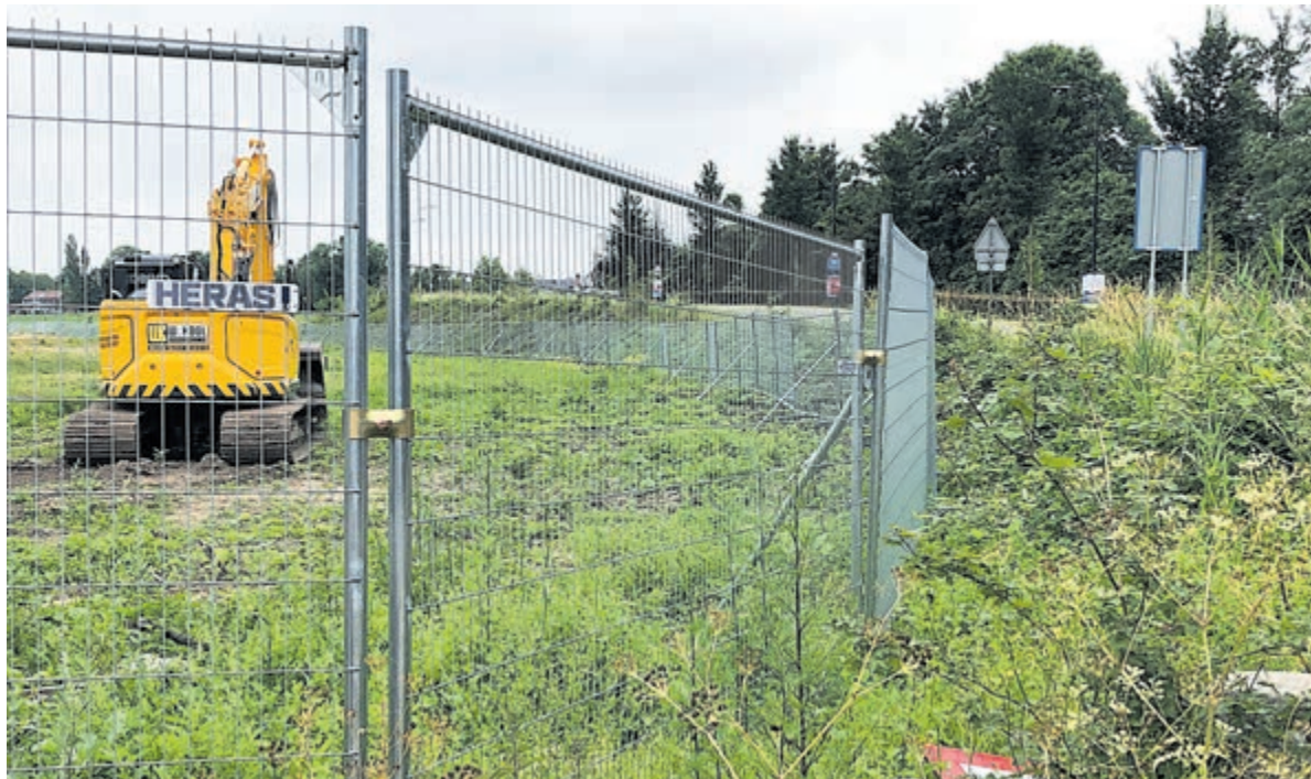
Aan de rand van deze nu kale vlakte stonden prachtige bomen. Ze komen terug...