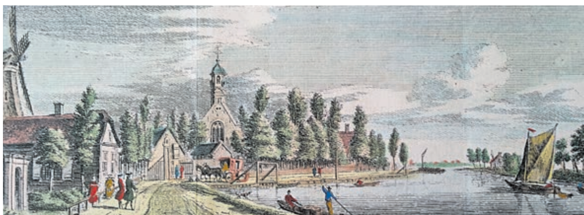
1745 - Jan de Beyer - Thamen aan de Amstel ingekleurd - particulier bezit