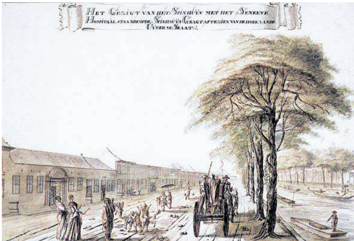
1682 - Het Chinese Ziekenhuis te Batavia waar Johan Bredius overleed