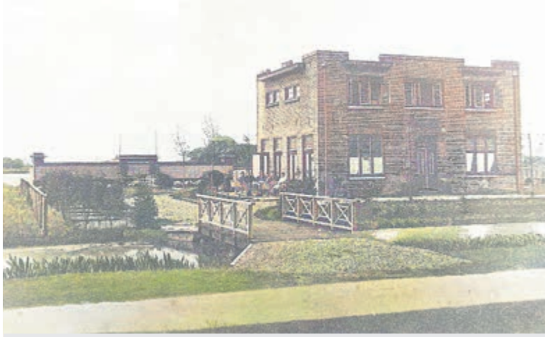
1924 - Zwembad Zijdemeer en Hotel Hengelsport.

Hervormde Gemeente Thamen en werkte hier aan zijn rehabilitatie. Zijn hart lag echter bij de Hottentottenbevolking in Zuid-Afrika. Of hij terugkeerde blijft nog even een verrassing. In 2020 hief de oudste vereniging van Uithoorn zich op. Daarmee kwam een einde van gymnastiekvereniging Sparta opgericht op 7 december 1892. In vogelvlucht wordt de 128-jarige geschiedenis van de vereniging beschreven en in beeld gebracht.