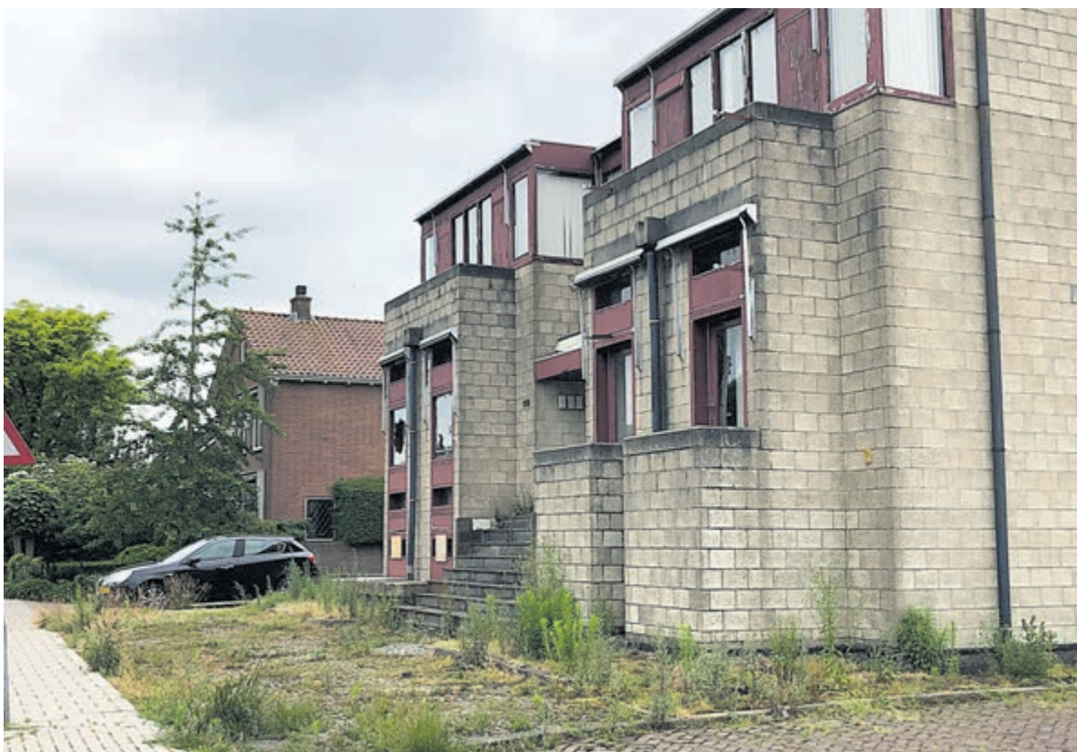
Wat is mooier, woningen of deze langzaam instortende bouwval