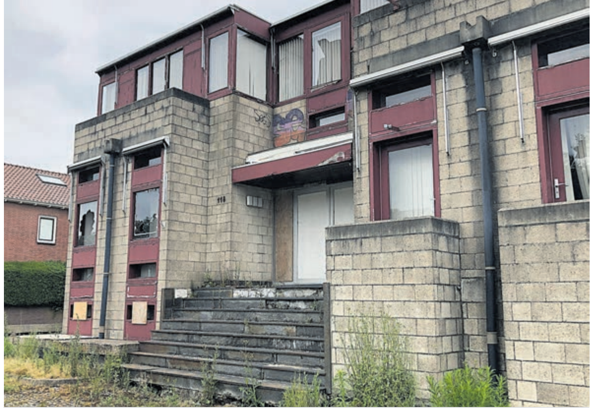
Al tientallen jaren kijken de omwonenden nu tegen deze bouwval aan