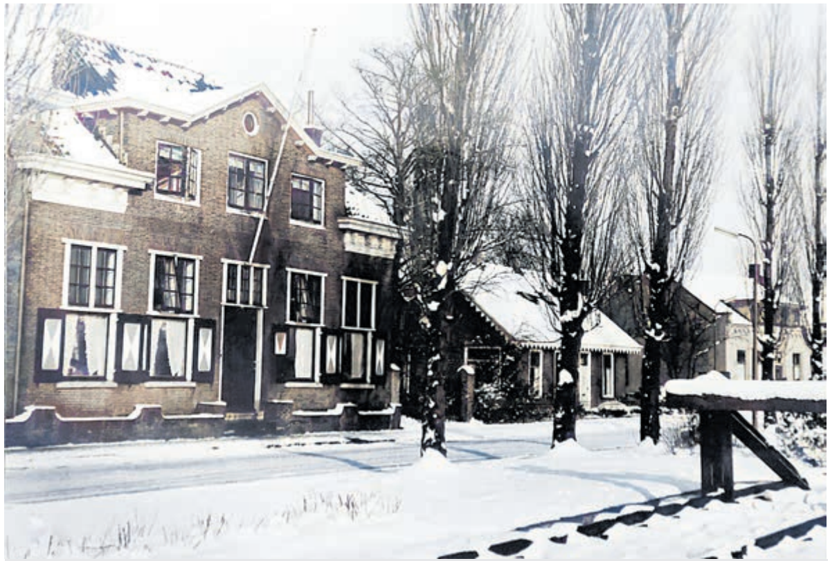
1937 - Wilhelminakade met kantoor rederijen Gemma en J.A. van Seumeren. Collectie SOUDK.