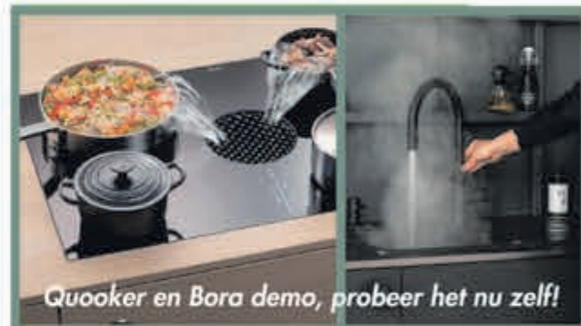
Quooker en Bora demo, probeer het nu zelf!