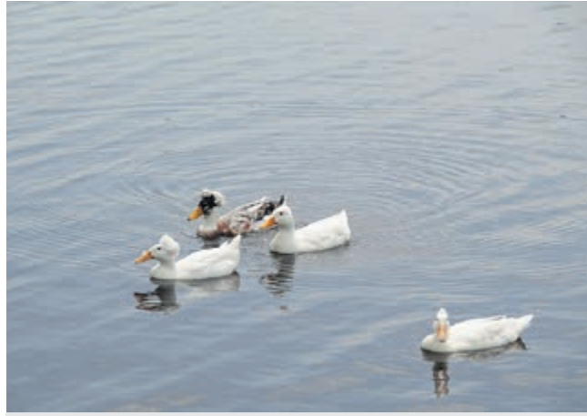
Oud-Hollandse kuifeenden op de Amstel bij de Rode Paal.