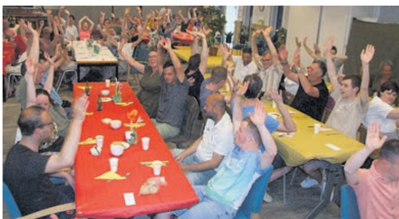
De feestelijke seizoensafsluiting van Soos De Cirkel was drukbezocht.