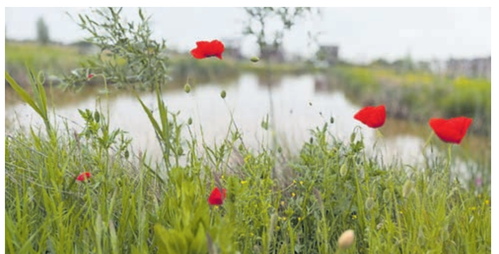
Grenzend aan het Waterplein in Marickenland