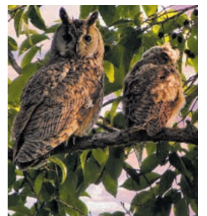
Al snel ontdekten vogelspotters dat het om een grote hoornuil ging, die samen met haar jong in het gebied verblijft.

"Het is uniek om zoiets van dichtbij mee te maken", zegt een buurtbewoner. "Normaal zie je zulke dieren alleen in natuurgebieden, niet midden in een woonwijk." Natuurliefhebbers hopen dat de uilen voorlopig nog in het gebied blijven, al wordt bezoekers gevraagd voldoende afstand te houden om de dieren niet te verstoren. Voor de bewoners van Verfmolen is het in ieder geval een week geworden die zij niet snel zullen vergeten.