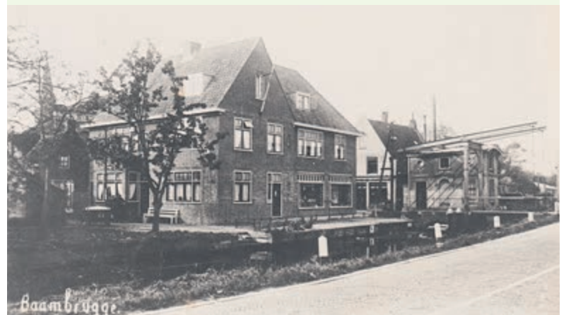
Baambrugge, zicht op de brug vanaf de Rijksstraatweg. Het pand links (Brugstraat) is nog altijd beeldbepalend.