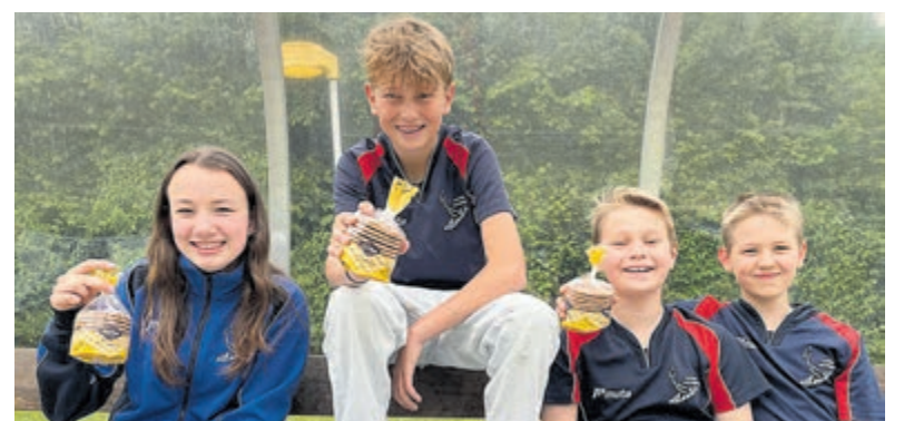
De jeugdteams van korfbalvereniging Atlantis verkopen stroopwafels voor hun club.

naar een gloednieuwe schommel op het clubterrein. Na een succesvolle voorverkoop via familie en bekenden hopen de jonge verkopers nu ook bij inwoners in de buurt veel stroopwafels aan de man te brengen. Betalen gaat makkelijk en veilig via een QR-code.