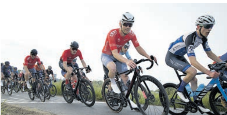
Concentratie bij het nemen van de bocht op de Nesserlaan.