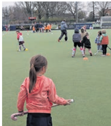
Super hockey fundag bij HVM.

De organisatie richt zich nadrukkelijk op een laagdrempelige kennismaking met hockey. Kinderen kunnen samen met vriendjes, klasgenoten of familieleden deelnemen. Na afloop ontvangen alle deelnemers iets te eten en drinken. Wie na afloop enthousiast is geworden, krijgt de mogelijkheid om drie keer gratis mee te trainen om verder kennis te maken met de sport en de vereniging. Met de nieuwe editie hoopt HVM het aantal deelnemers