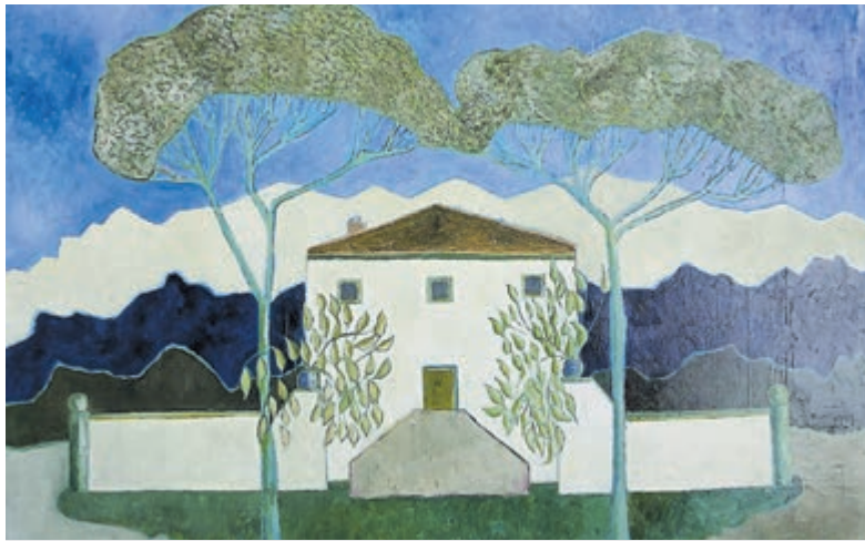
Ingetogen kleurgebruik kenmerkt het werk van Hans Butzelaar.