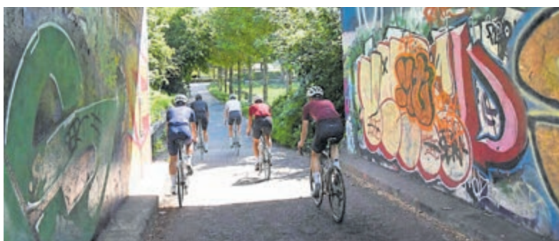
In Uithoorn kunnen fietsers kiezen uit afstanden van 40, 100, 120 en 170 kilometer.

Met de opbrengsten ondersteunt het fonds onderzoek naar het voorkomen en genezen van diabetes en investeert het in voorlichting. Deelnemers kunnen zelf kiezen waar zij hun tocht beginnen en eindigen. Er zijn twee start- en finishlocaties: Uitgeest en Uithoorn. Vanuit Uitgeest vertrekken de routes van 100 en 170 kilometer. In Uithoorn kunnen fietsers kiezen uit de afstanden van 40, 120 en 170 kilometer. Met de combinatie van beweging, natuurbeleving en cultureel erfgoed verwacht de organisatie opnieuw een succesvolle editie. Geïnteresseerden kunnen zich aanmelden via de website van de Ronde van de Stelling van Amsterdam.