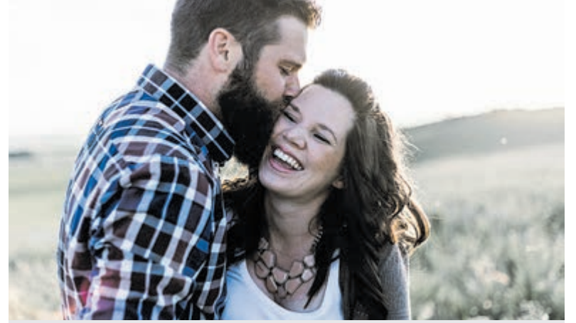
Gratis workshop 'Vijf Talen van de Liefde'.

De cliënten verdienen een goede opvang en een sociaal leven, maar Baambrugge mist, volgens het burgerinitiatief, de schaal en de sociale voorzieningen om dit plan veilig en leefbaar te faciliteren. Het plan vormt een te grote inbreuk op de verkeersveiligheid en de leefbaarheid van de buurt. Donderdagavond 28 mei heeft het burgerinitiatief ingesproken bij de vergadering van de Politieke Commissie in het gemeentehuis in Mijdrecht. Meer informatie via mail: baambrugge.burgerinitiatief@gmail.com. Bon: De Ronde Venen Nieuws.