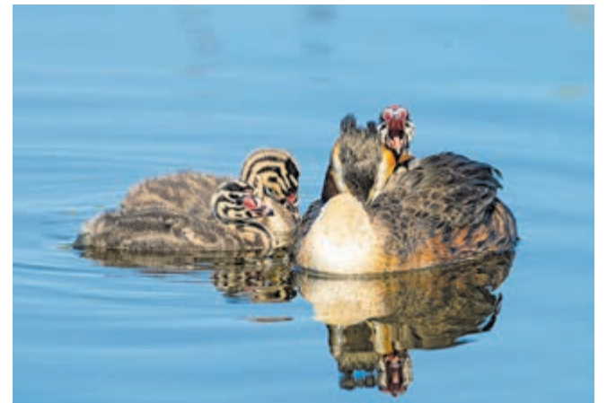
Mama fuut met een kleine hongerige op haar rug in een sloot in De Kwakel.