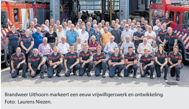
Brandweer Uithoorn markeert een eeuw vrijwilligerswerk en ontwikkeling.