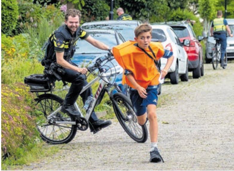
Wilnise basisscholieren op de vlucht, waarna politie en handhavers de achtervolging inzetten.