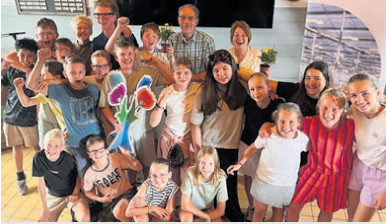
RKBS De Zon uit De Kwakel winnaar van de regionale Tuinbouw Battle 2026.