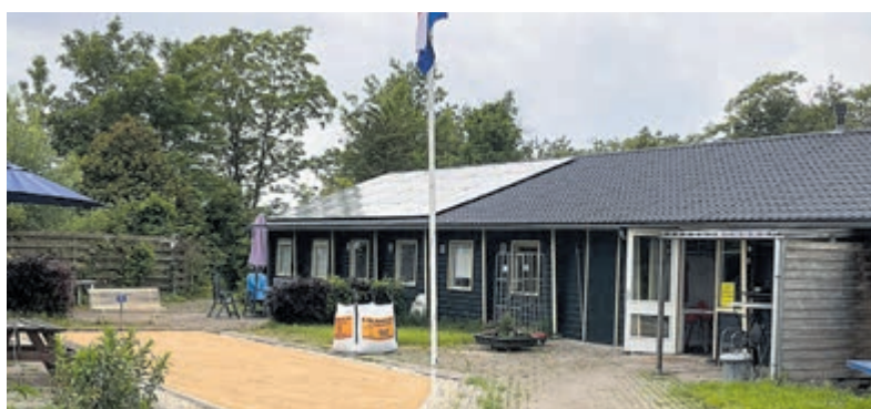
De open dag biedt bezoekers de gelegenheid om kennis te maken met de vereniging en haar leden.

Daarnaast zijn er diverse voorzieningen die het verblijf compleet maken. Er is een sauna, een studio voor creatieve activiteiten zoals keramiek en verschillende sportmogelijkheden, waaronder een volleybalveld en een jeu de boules-baan. Ook voor gezinnen met kinderen is er gelegenheid tot ontspanning, met een speeltuin, trampoline en een zwembad met peuterbad. Met de open dag benadrukt De Wilgenborgh haar open karakter: een kans om zonder verplichtingen een kijkje te nemen op een plek waar rust, natuur en een andere kijk op recreatie samenkomen.