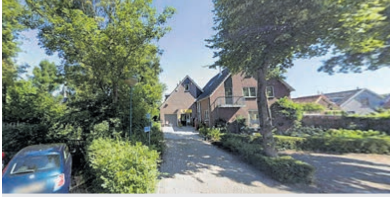
De voormalige fysiotherapiepraktijk aan de Prins Mauritsstraat 5-7 in Baambrugge.