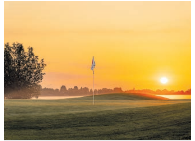
A hole in one op golfbaan Wilnis.

Stuur de foto naar redactiemijdrecht@meerbode.nl of redactieuthoorn@meerbode.nl voor eeuwige roem in de krant, online en de socials. Vermeld altijd de naam van de fotograaf, locatie (plaats) en beschrijf kort – in maximaal 10 woorden – de foto. Onder de mooiste inzendingen, die door een deskundige jury worden beoordeeld, verloten we te zijner tijd een gratis fotoworkshop.