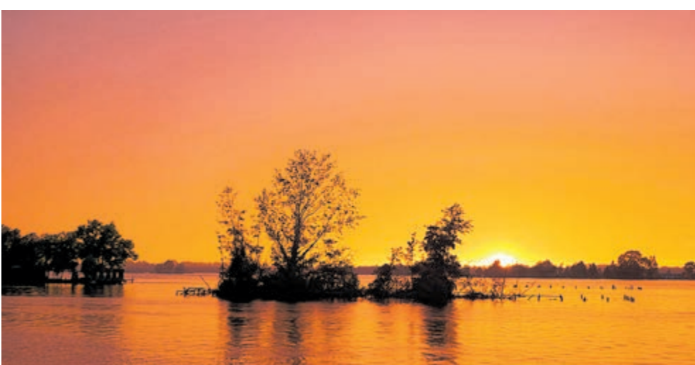
Een foto genomen vanaf eiland 8, Vinkeveense Plassen.