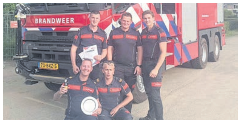
Brandweer Vinkeveen naar halve finale vaardigheidstoets.

Voor de ploeg was het een behoorlijke uitdaging om vanaf de kade met alle benodigde materialen het ruim van het schip te bereiken en het slachtoffer door middel van een goede stabilisatie en het gebruik van hefkussens te kunnen bevrijden. Er deden totaal negen brandweerploegen uit verschillende regio's mee aan deze gewestelijke vaardigheidstoets. Bij de prijsuitreiking en de uitleg van de jury over het incident werd duidelijk, dat de Vinkeveense inzet werd beloond door de veilige en gecontroleerde wijze waarop het slachtoffer onder de Bobcat werd bevrijd.