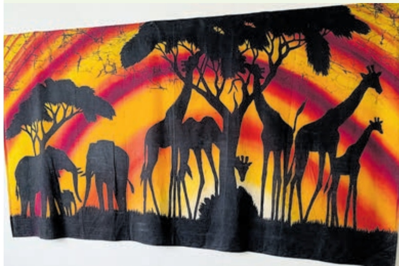
Tekst en foto's zijn geplaatst met volledige instemming van de familie.

'Welke foto moeten we nou op de rouwkaart zetten?' Ik zit aan tafel bij de familie van mevrouw. De locatie en de datum van haar afscheid zijn bepaald en nu gaan we verder met de inhoud van de dienst en de kaart. Er ontstaat een lichte discussie over de foto die ze willen gebruiken. Eén van hen merkt op dat er vast wel een mooie foto is van een verre reis. Als ik er na vraag komen de verhalen los. 'Kom maar mee', zegt meneer, 'dan laat ik je wat zien.' Ik loop achter hem aan naar de slaapkamer. Daar hangt een groot kleed aan de wand. Ze hebben het gekocht op een van hun verre reizen en het is een speciaal souvenir. Vanaf dat moment gaat het snel. Het kleed gaat van de wand af en er wordt een foto van gemaakt voor op de binnenkant van de kaart. Op de dag van het afscheid ligt het kleed over de kist heen. De inloopmuziek past er precies bij. Alles in de aula staat in het teken van de cirkel van het leven, the circle of life.