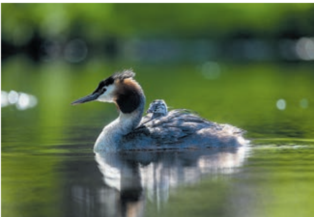
Fuut met kuiken aan de Boterdijk in De KwakelUithoorn.