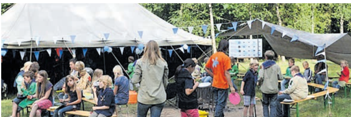
Scouting Eliboe Vinkeveen start met een nieuwe Bevergroep.

De activiteiten van de Bevers vinden wekelijks plaats op zaterdagochtend van 09.30 tot 11.00 uur. Tijdens deze bijeenkomsten maken kinderen spelenderwijs kennis met scouting, waarbij samenwerking, creativiteit en avontuur centraal staan. De nieuwe speltak biedt een laagdrempelige