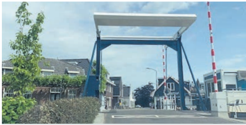
De Heulbrug is weer open voor weg- en vaarverkeer.