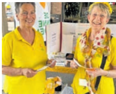
Succesvolle lotenverkoop voor de Zonnebloem.

Toekomst in andere dorpskernen De Rondeveense Jacht is een samenwerking tussen politie, het jongerenwerk van Stichting Samens, Makers van MDRCHT, Team Sportservice en de gemeente. Als de proef slaagt, krijgt het initiatief mogelijk een groter vervolg. Er wordt dan bekeken of het spel de komende jaren ook in de andere dorpskernen kan plaatsvinden.