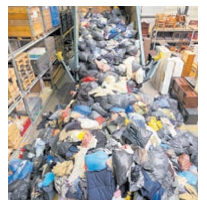
Het wekelijkse lossen van textiel uit de ondergrondse containers vanuit Stichtse Vecht.

Kringkoop Mijdrecht is uiteraard blij met het certificaat. Floor Groenendijk: "Deze erkenning laat zien dat we zorgvuldig en verantwoord omgaan met het door ons ingezamelde textiel. Daarmee werken we mee aan de verduurzaming van deze zo vervuilende industrie". Kringkoop verzamelt het textiel in voor de gemeenten Stichtse Vecht en De Ronde Venen. Op jaarbasis meer dan 400.000 kilo.