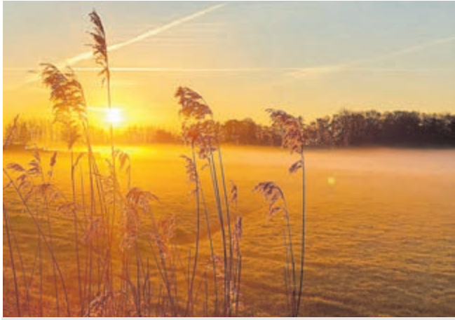
Een werkdag is geslaagd als hij zo begint, Stationsstraat Abcoude.