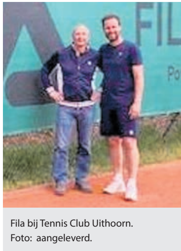
Fila bij Tennis Club Uithoorn.

Fila is kledingpartner van Team.NL en kleedt nu ook enkele competitie-teams van TCU. Met de zorgvuldig uitgekozen duurzame kleding van Fila baren de teams van TCU veel opzien zowel op als naast de baan.