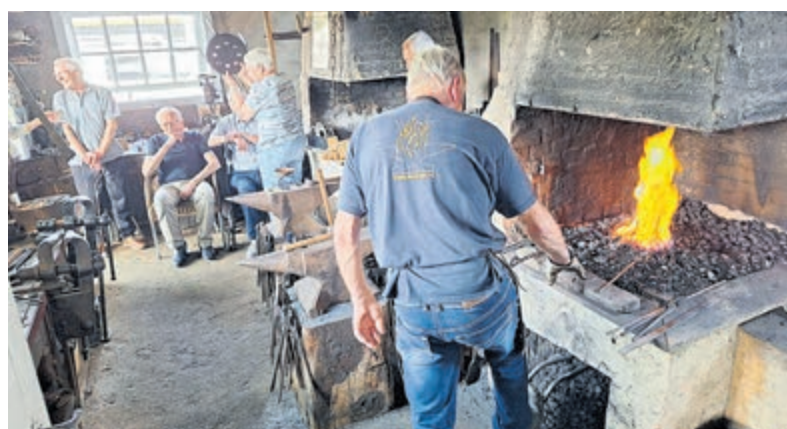
Zonnebloem De Kwakel/Vrouwenakker op bezoek bij Smederijmuseum Nieuwkoop.

De middag werd afgesloten op een nabijgelegen terras, waar onder het genot van een drankje en een bittergarnituur herinneringen aan vroeger werden opgehaald. Aansluitend werden de deelnemers door de vrijwilligers weer thuisgebracht. Het geslaagde uitje leverde veel waardering op: leerzaam, herkenbaar en vooral bijzonder gezellig.