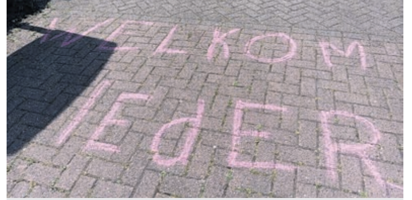
De kleurrijke stoepkrijtactie van het VluchtelingenWerk Uithoorn werd voortijdig beëindigd door ingrijpen van de gemeente.

Na het officiële programma volgde een fotomoment met zowel actieve leden als oudgedienden. De reünie werd voortgezet in informele sfeer, waar ervaringen en herinneringen werden uitgewisseld. De dag werd afgesloten met een gezamenlijke barbecue.