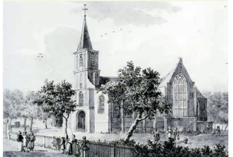
Tekening met de kerk van Mijdrecht rond 1780.