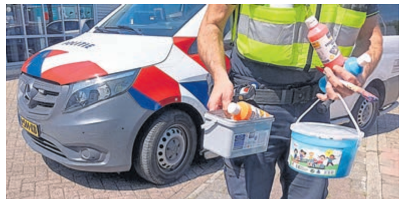
De gemeente Uithoorn liet politie de tekeningen verwijderen.

gebruik van de openbare ruimte", zegt een woordvoerder van VluchtelingenWerk Uithoorn, "maar dit was een tijdelijke, afwasbare actie met een positieve boodschap. Juist dit soort signalen van verbinding zouden gefaciliteerd in plaats van weggepoetst moeten worden." Volgens het initiatief staat de reactie van de gemeente haaks op de inhoud van de actie. "Het ging om vriendelijkheid en inclusie, niet om overlast of vervuiling. Dat dit binnen enkele uren werd verwijderd, roept de vraag op hoe er in Uithoorn wordt omgegaan met vreedzame burgerinitiatieven." De woordvoerder plaatst het voorval in een bredere context. "In een tijd waarin het maatschappelijk debat verhardt, is er behoefte aan kleine gebaren die mensen bij elkaar brengen. Dan is het pijnlijk als juist de gemeente zo'n initiatief niet weet te waarderen."