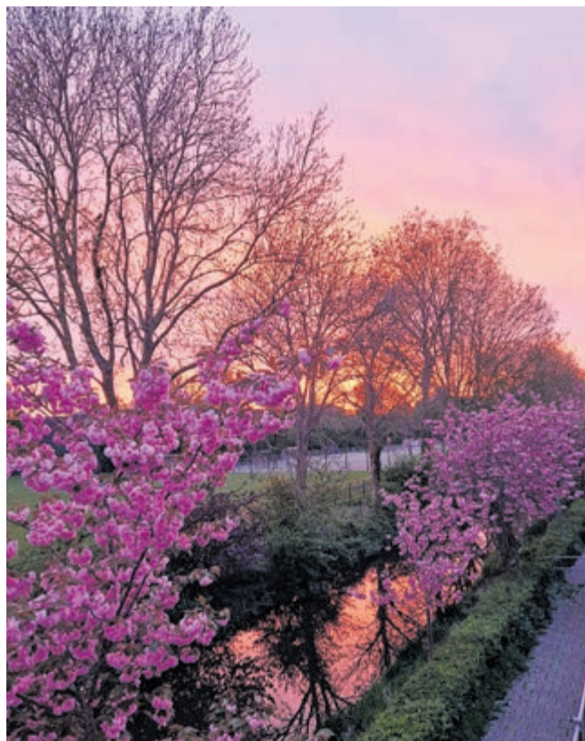
Het uitzicht van de slaapkamer aan de Cornelis Beerninckstraat in Mijdrecht.