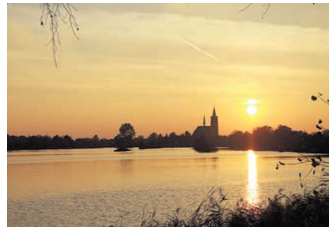
Mooi thuiskomen in De Ronde Venen na een rondje langs de N201.