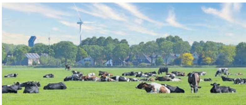
Uitstel voor stikstofzones.

mestafvoer. Volgens de provincie hebben veel boeren aangegeven meer tijd nodig te hebben om zich aan te passen. Ook de provincie zelf blijkt nog niet klaar voor invoering in 2027. Er moeten onder meer juridische regelingen voor nadeelcompensatie worden uitgewerkt en procedures worden opgesteld voor maatwerkverzoeken van boerenbedrijven. Hoewel Provinciale Staten pas in november 2026 officieel moeten instemmen met de aangepaste Omgevingsverordening, verwacht de provincie weinig discussie over het uitstel. Binnen het provinciehuis wordt ervan uitgegaan dat het voorstel als hamerstuk zal worden behandeld. Door het besluit nu al openbaar te maken, wil het provinciebestuur duidelijkheid geven aan betrokken boeren en andere partijen in het landelijk gebied. Het uitstel betekent volgens de provincie niet dat de ambities worden afgezwakt. De stikstofuitstoot moet nog steeds fors omlaag om kwetsbare natuur te beschermen. Utrecht blijft daarom inzetten op een combinatie van natuurherstel en een toekomstbestendige landbouwsector. "Alleen het tempo wordt aangepast", laat de provincie weten.