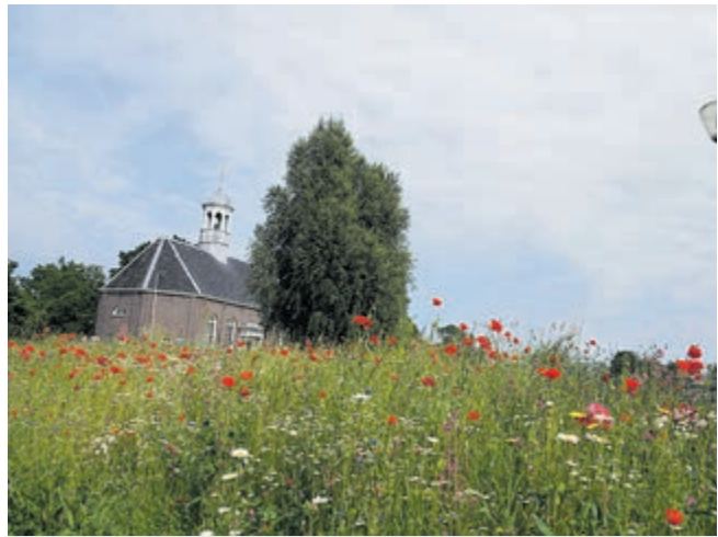
Mooi bloemenveldje bij de Thamerk in Uithoorn.