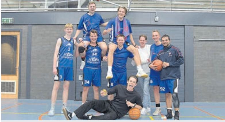
Dubbel feest bij SV Argon Basketbal: Heren 1 en U16 kampioen.