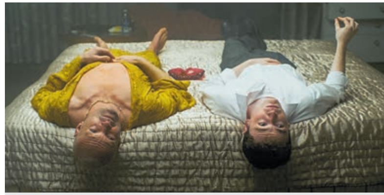
'Truly naked' in Filmhuis Mijdrecht.