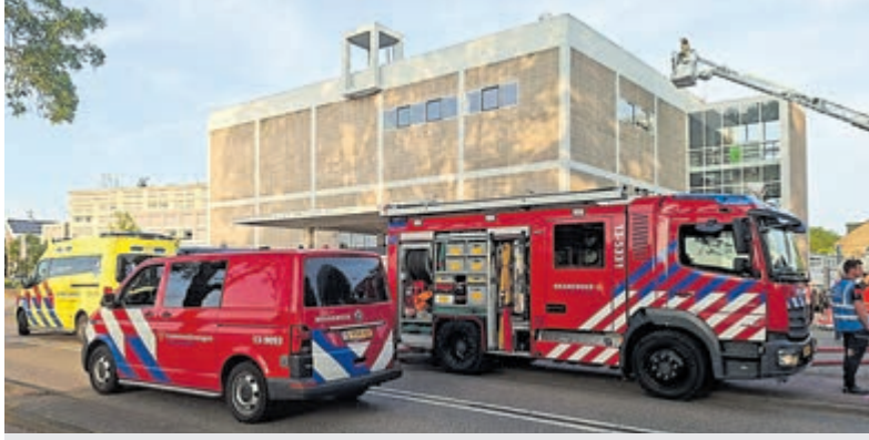
Buurtbewoners waren gefascineerd door de inzet en de complexiteit.