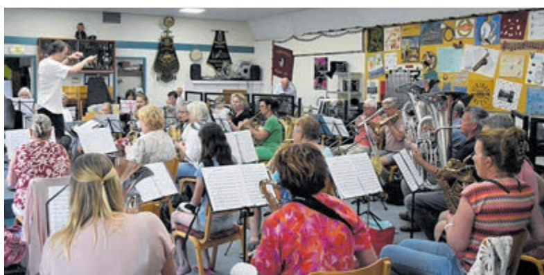
Veel belangstelling voor de openbare repetitie bij Viribus Unitis.

De avond begon met een repetitie van het opstaporkest, waarna de fanfare het muzikale stokje overnam. Onder leiding van de maestro werd afgetrapt met het toepasselijke nummer 'Espresso Macchiato'. Een knipoog naar de gezellige pauze later op de avond, waar bezoekers werden getraakteerd op een Hollands bakje koffie en de gelegenheid kregen om met muzikanten en vrijwilligers in gesprek te gaan.