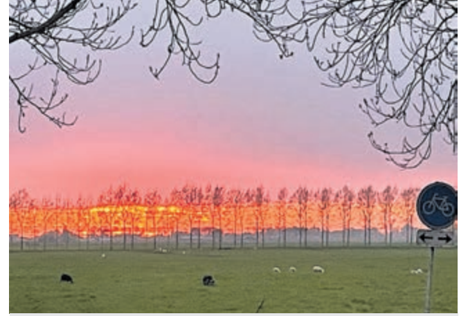
Ondergaande zon aan de Tweede Zijweg in Mijdrecht.