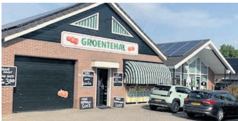
De Groentehal en poelier De Haan aan Demmerik zijn nu optimaal bereikbaar.

levendigheid langzaam terug. Bij de Groentehal, waar dagelijks verse groenten en fruit worden verkocht, merkt een van de eigenaren dat vaste klanten hun weg weer weten te