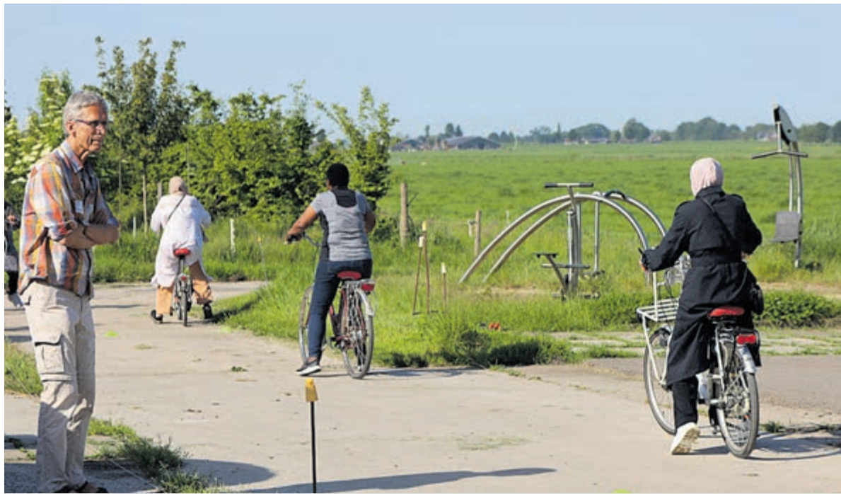
De deelnemers hebben vaak een migratieachtergrond en hebben nooit of bijna nooit leren fietsen.

'MOOI OM IN CONTACT TE KOMEN MET ANDERE CULTUREN'