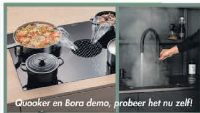
Quooker en Bora demo, probeer het nu zelf!