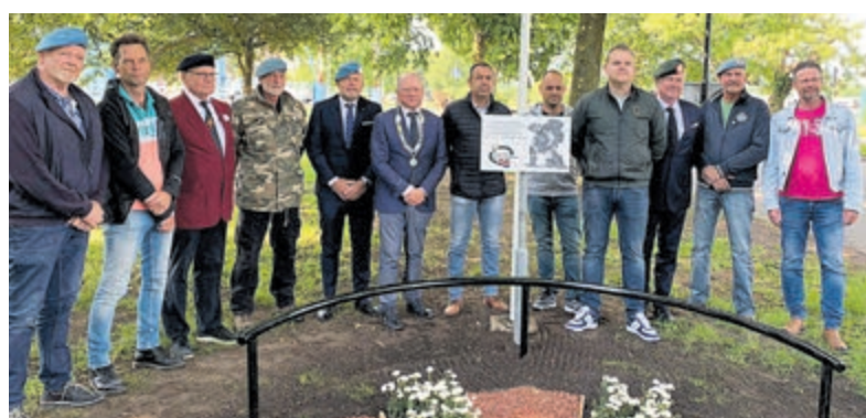
Opening van het anjerperk in 2022.

ranendag in De Ronde Venen georganiseerd. Sinds vorig jaar is er een