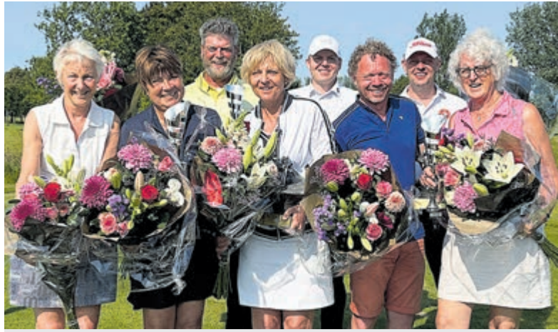
Alle finalisten van de 18-holes-baan.

fraaie demonstratie van de judowedstrijdsport. Er was een gemoedelijke sfeer met een echt toernooikarakter, er werd gestreden voor elk punt en zelfs de allerkleinsten deden het publiek verbazen over de mentaliteit op de tatami. Voor iedereen was er een mooie, welverdiende medaille. Voor alle uitslagen en informatie over onze judoschool kunt u een kijkje nemen op: www.judoryukensui.nl .