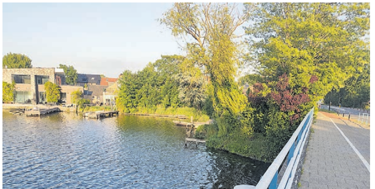
Op de foto rechts zou in plaatst van de bomen een hoog appartementencomplex moeten verschijnen

Burgemeester Divendal gaf aan dat het in de raad gaat om het maken van een belangenafweging. Alleen de fracties van D66 en CU-SGP hadden geen bezwaar tegen behandeling tijdens de raadsvergadering. De fractie van de VVD sprak zich daarover niet uit. De inbreng van de VVD beperkte zich tot de constatering dat al duidelijk was dat een raadsmeerderheid voor uitstel van de behandeling was.