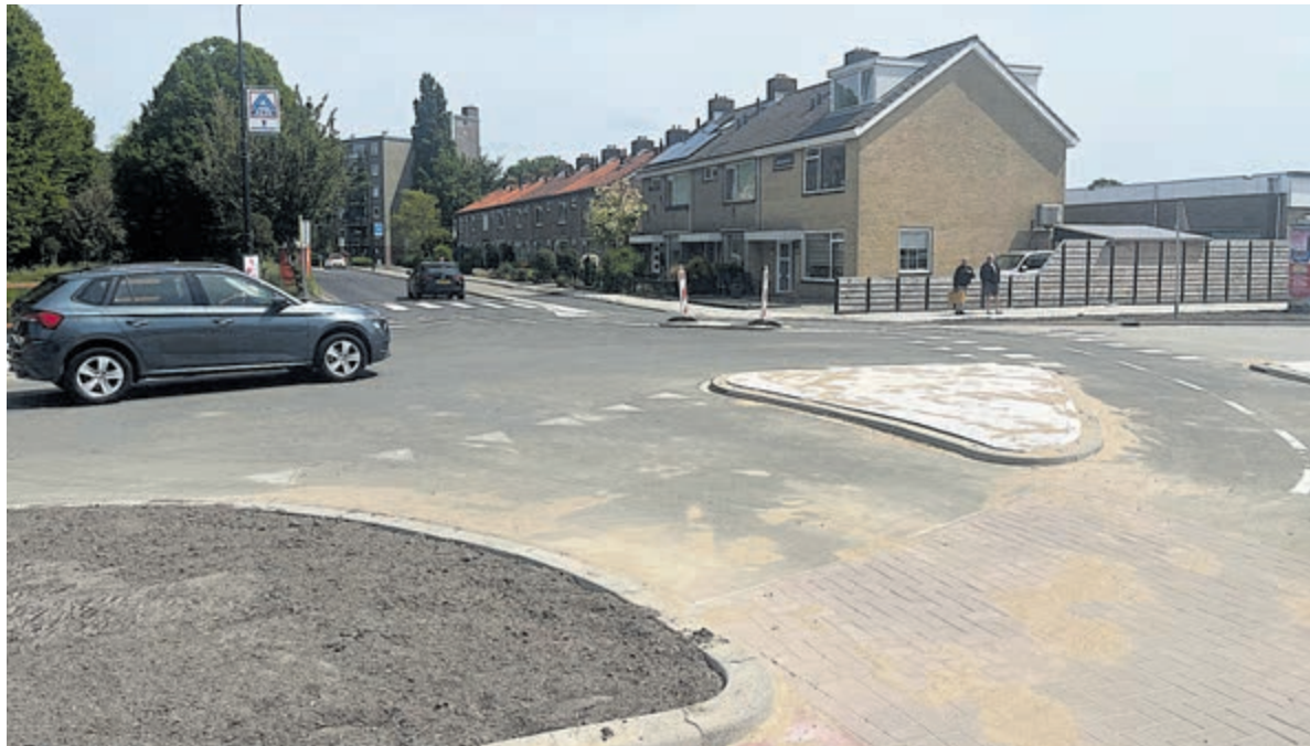
De nieuwe kruising Ambachtsheren-singel/Prinses Margrietlaan. De fietsrotonde wordt op een later moment van een rode coating voorzien.