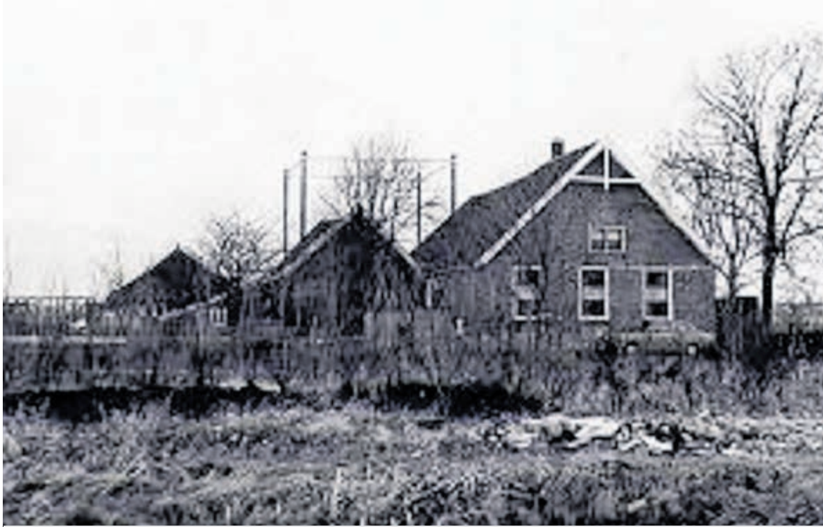
De aankoop in 1972: een slecht onderhouden en vervuilde boerderij met verschillende schuren, stallen, een hooimijt plus vijf hectare weiland.