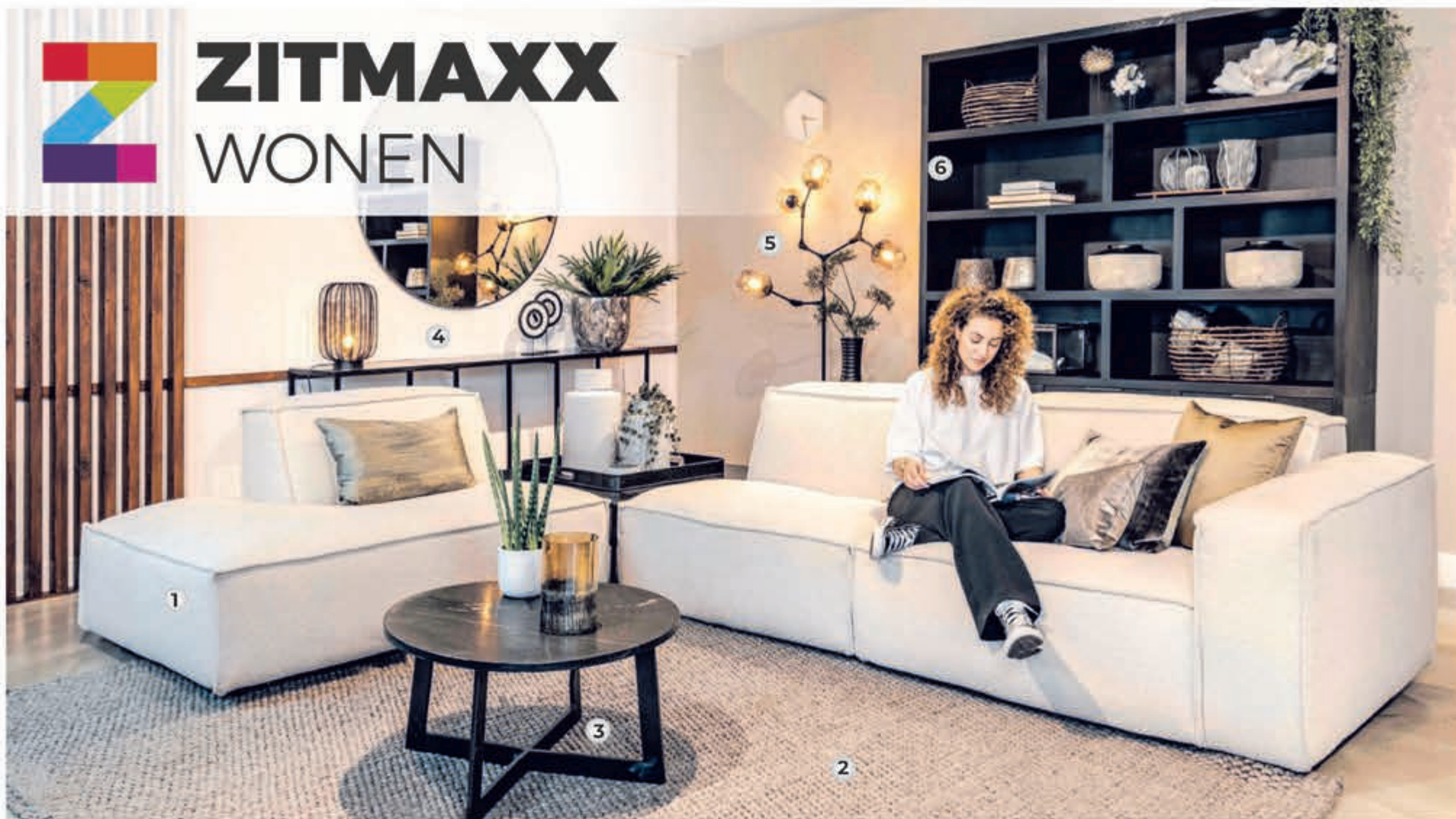
▶ 1. Loungebank HOLIDATE zoals afgebeeld v.a. 1596,- | ▶ 2. Vloerkleed NEW LOOP v.a. 899,- | ▶ 3. Salontafel MAJOR 189,- | ▶ 4. Wandtafel MIX & MATCH 365,- | ▶ 5. Vloerlamp LIME 299,- | ▶ 6. Boekenkast ESTABLISHED 1849,- |