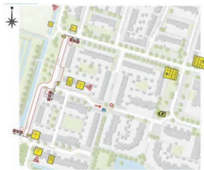
Eerste fase Rozenlaan, overige fases staan na de bouwvak op www.uithoorn.nl/werkinuitvoering .