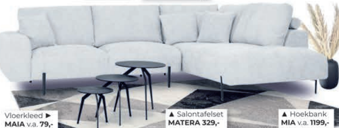
Vloerkleed ▶ MAIA v.a. 79,-