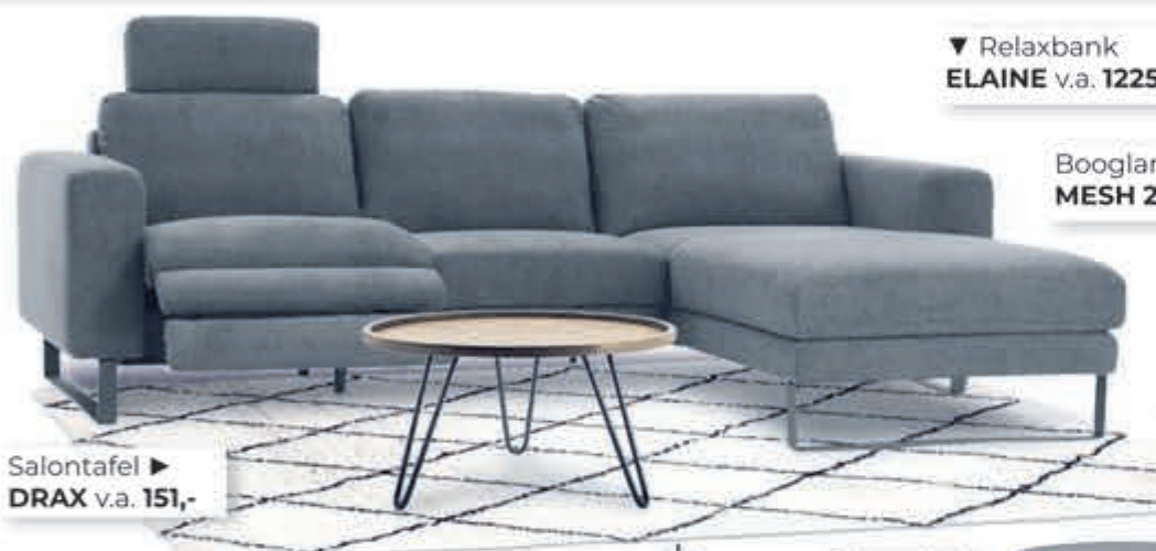
Salontafel ▶ DRAX v.a. 151,-