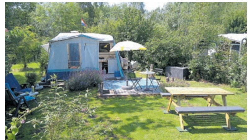
Omdat het een beschut terrein betreft, is de temperatuur op "De Wilgenborgh" al gauw een paar graden hoger dan elders.

Er wordt echter één voorwaarde aan je gesteld: je moet je NFN-pas kunnen tonen (geldt niet voor de Open Dag). Bij de NFN ( www.nfn.nl ) zijn momenteel 56 natuuristenverenigingen aangesloten. Deze belangenorganisatie stelt zich de maatschappelijke acceptatie van naaktrecreatie in Nederland als taak. Mensen die lid zijn van deze overkoepelende organisatie krijgen allemaal een NFN-pas, waarmee ze kunnen aantonen dat ze het naturisme serieus nemen en omarmen. Je merkt dat op "De Wilgenborgh" nog normen en waarden gelden die je tegenwoordig niet overal meer ziet. De sfeer is er bijzonder prettig: er wordt gepraat, geborreld, aan sport en spel gedaan en zo ook bijvoorbeeld aan cursussen keramiek of schilderen. De naturist is ruimdenkend, let op elkaars spullen en is altijd bereid om anderen te helpen waar nodig. Dit alles maakt dat men zich op "De Wilgenborgh" niet alleen veilig, maar ook bijzonder vrij en ontspannen voelt, in samenhang met de natuur. Als in een paradijs, dat door eigen leden zo prachtig is aangelegd. De Open Dag is dus zaterdag 5 juni, van 10:00 tot 17:00 uur. U vindt "De Wilgenborgh" aan de Proostdijerdwarsweg 12 in Waverveen