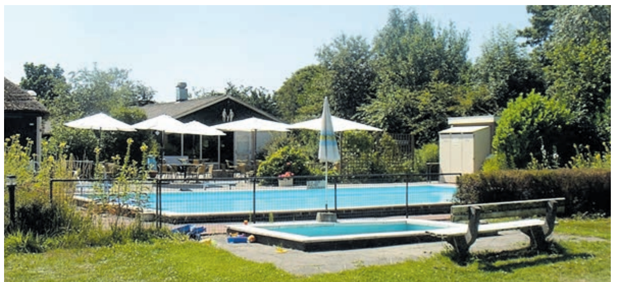
De Wilgenborgh nu: een heerlijke groene plek om tot rust te komen en te recreëren: gewoon voor een dagje of om er wat langer te kamperen.