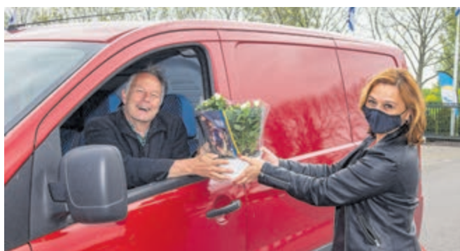
Raadsleden delen potrozen uit die beschikbaar zijn gesteld door HPD Potplanten in De Kwakel aan vrijwilligers die een bijdrage hebben geleverd aan gemeente Uithoorn 200 jaar. Alle organisaties en verenigingen hebben een uitnodiging gehad om dit voor hun vrijwilligers coronaproof op te halen.