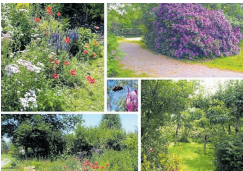
Groei en bloei als in een aards paradijs.