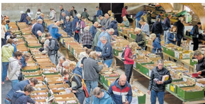
Grote tweedaagse boekenmarkt in Mijdrecht.

Mijdrecht – Na het grote succes van de recentelijk gehouden snuffelmarkt organiseert RK Kerk Sint Jan de Doper opnieuw een aantrekkelijk evenement voor liefhebbers van tweedehands vondsten; vrijdag 22 en zaterdag 23 mei aanstaande vindt een grote tweedaagse boekenmarkt plaats aan de Oosterlandweg 3A in Mijdrecht. Bezoekers zijn beide dagen welkom van 10.00 tot 16.00 uur en kunnen hun hart ophalen aan een indrukwekkend aanbod van meer dan 7.000 boeken in diverse genres. Van romans en thrillers tot kinderboeken, kookboeken en informatieve uitgaven. Naast boeken is er ook een ruime collectie puzzels, cd's, dvd's en lp's te vinden, waardoor ook muzikliefhebbers en filmfhebbers volop keuze hebben. De markt wordt gehouden in een sfeervolle, ruime locatie waar bezoekers rustig kunnen rondkijken en zoeken naar bijzondere vondsten met zitjes voor koffie, thee en versnaperingen. De organisatie kijkt met veel voldoening terug op de snuffelmarkt in april, die zeer druk werd bezocht en als een groot succes werd ervaren. Met deze boekenmarkt hoopt men opnieuw veel bezoekers te mogen verwelkomen. De opbrengst van de boekenmarkt wordt besteed aan de vele goede doelen die de organisatie RK Kerk Sint Jan de Doper financiert, waaronder ook onderhoud aan de 150-jarig bestaande kerk. Toegang en parkeren is gratis.