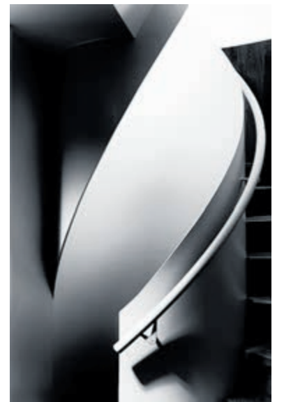
Donker licht.

De fotokring organiseert jaarlijks een kringavond voor het samenstellen van de wedstrijd bijdrage. Ieder lid kan dan twee foto's inbrengen. Uit deze inzendingen kiezen de aanwezigen gezamenlijk de uiteindelijke selectie, die vervolgens in de meest sterke volgorde wordt geplaatst. Fotokring Uithoorn neemt jaarlijks deel aan de Bondsfotowedstrijd. De inzending bestaat uit werk van zowel nieuwe als ervaren leden. Dankzij een zorgvuldige selectie en een hoog niveau van de ingezonden foto's werd dit resultaat bereikt. Voor een hoge score moeten foto's zowel compositieel als technisch sterk zijn en bovendien opvallen tussen de circa 1.300 inzendingen. De reguliere kringavonden dragen bij aan de ontwikkeling van de fotografen. Door het tonen en bespreken van foto's en het geven van opbouwende feedback wordt het niveau verhoogd. Daarnaast werkt het gezamenlijke bekijken van werk inspirerend. Meer informatie over de fotokring en de ingezonden foto's is te vinden op www.fotokringuithoorn.nl .