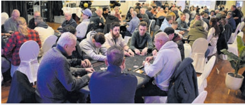
Pokertoernooi Dutch Poker Series strijkt neer in Vinkeveen.