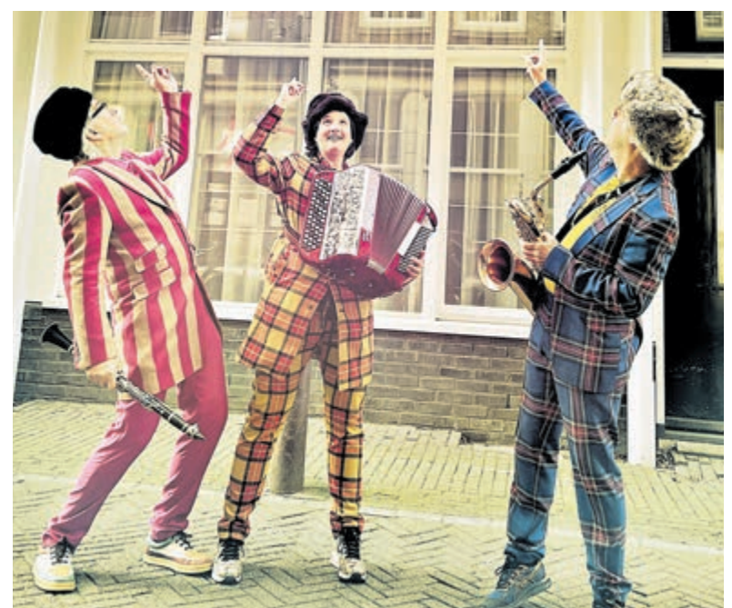
Frankfurter Polka Trio.

De organisatie is in handen van Stichting Cultuurpunt Ronde Venen www.cultuurpuntrondevenen.nl . Vanaf eind mei zal het programma ook op deze website komen te staan.