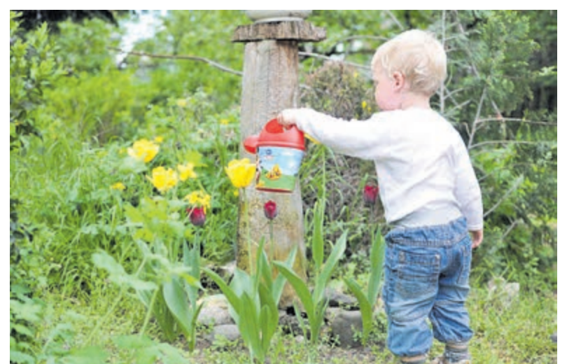
Laat je kleintje de lente en zomer beleven.

In Abcoude, Mijdrecht en Wilnis Natuurbeleving Ouder&Kind Lokaal Abcoude, woensdagochtend 27 mei (Bibliotheek Abcoude); Natuurbeleving Ouder&Kind Lokaal Mijdrecht, vrijdagochtend 29 mei (Bibliotheek Mijdrecht); Natuurbeleving Ouder&Kind Lokaal Wilnis, woensdagochtend 3 juni (NME-centrum De Woudreus). De activiteiten beginnen rond 10.30 uur en duren ongeveer drie kwartier, bij slecht weer wordt binnengespeeld. Koffie/thee staat klaar om 10.00 uur.