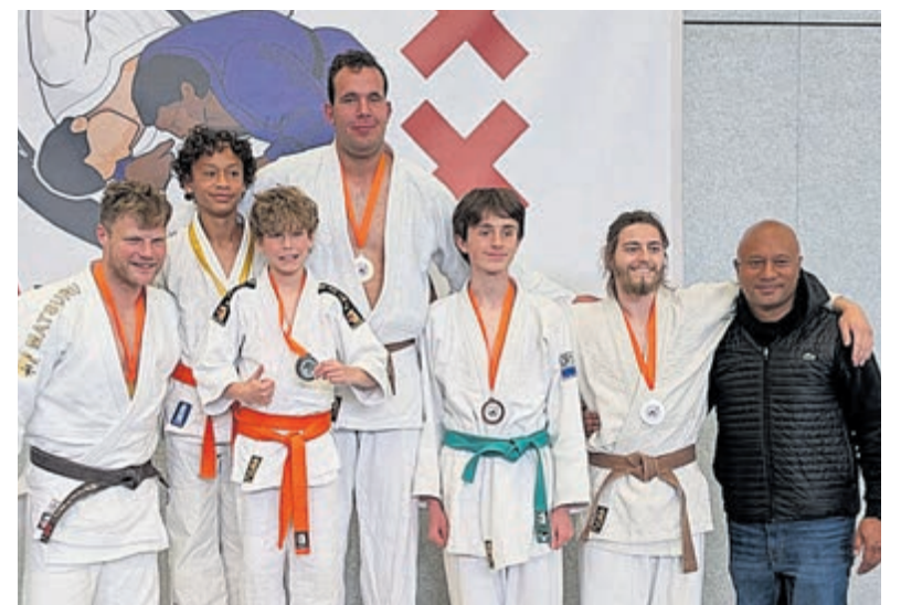
Met meerdere eerste, tweede en derde plaatsen kan judoschool Blaauw terugkijken op een geslaagde dag in Amsterdam.