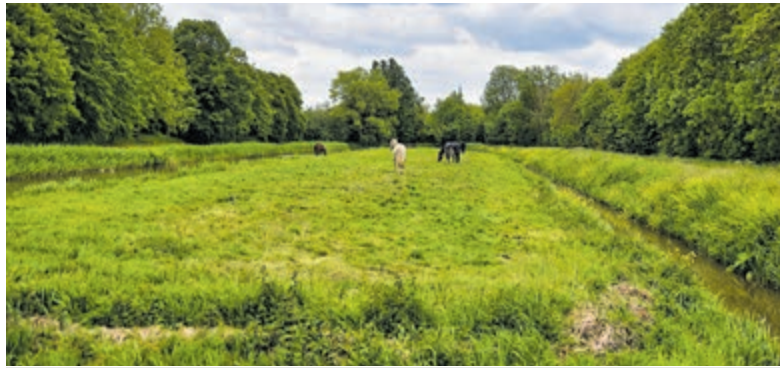
Het mooi natuurplaatje.

Nu de coalitieonderhandelingen na de gemeenteraadsverkiezingen in volle gang zijn, roept de werkgroep de politiek op om de locatiekeuze opnieuw kritisch te bekijken. Volgens hen moet dit dossier niet worden gezien als een los project, maar als onderdeel van de bredere toekomstvisie voor een leefbaar en verbonden Wilnis. Inwoners die willen reageren kunnen contact opnemen via: historischdorpshartwilnis@gmail.com .