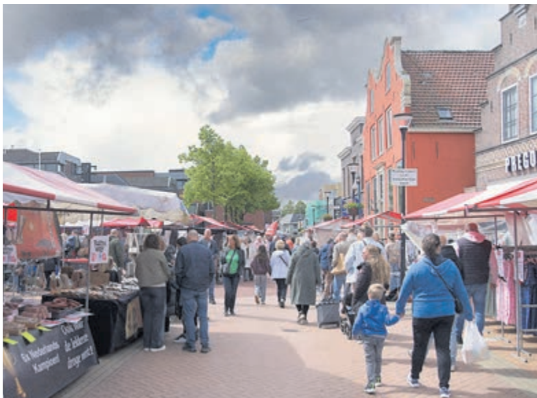
Donkere wolken symbolisch boven voor de tóch geslaagde tweedaagse jaarmarkt in Mijdrecht.

nieuwe functie persoonlijk kwam feliciteren. Tijdens een gezellige bijeenkomst met koffie en gebak werd gesproken over het bereiken van zo'n hoge leeftijd. De burgemeester overhandigde een schaal met een afbeelding van De Ronde Venen, een cadeau dat zeer in de smaak viel bij de jarige en de aanwezigen.