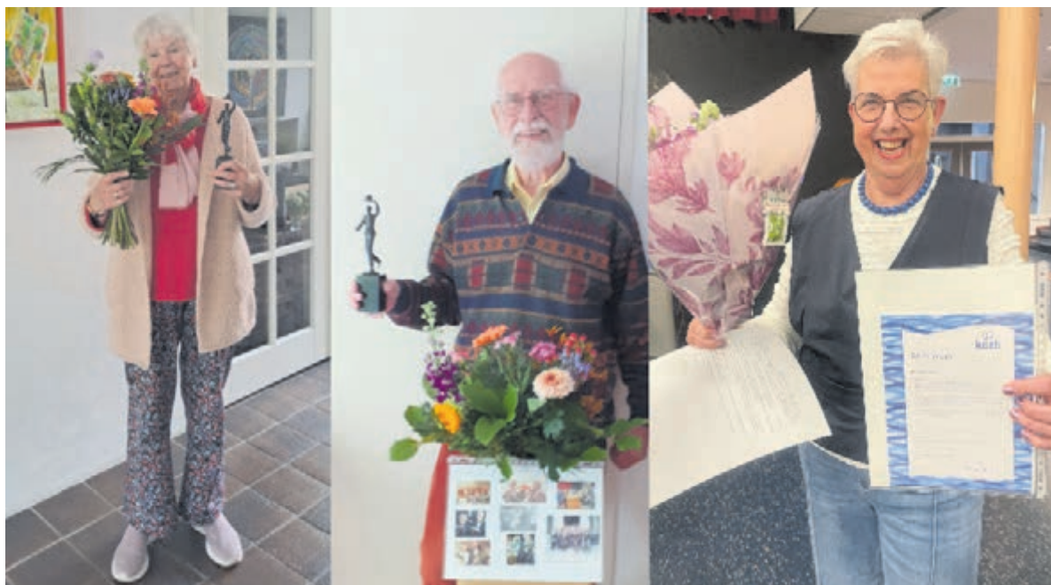
Drie jubilarissen bij Amicitia.

Het jubileumconcert vindt plaats op vrijdag 27 november om 20.00 uur in De Burght in Uithoorn. Op het programma staan onder meer de Grosse Messe van Mozart en het Stabat Mater van Pergolesi, uitgevoerd met solisten en orkest. Meer informatie is te vinden via www.amicitia-uthoorn.nl .