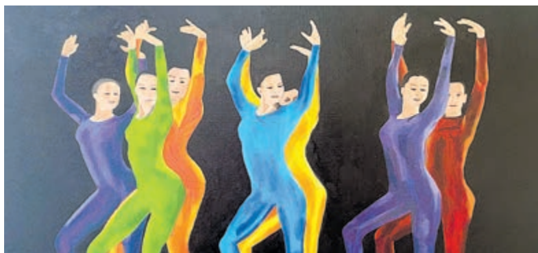
De expositie bestaat voornamelijk uit figuratieve werken, aangevuld met een aantal abstracte kunstwerken.

AKM heeft momenteel nog ruimte voor nieuwe leden en cursisten. Daarnaast is het atelier op zoek naar nieuwe docenten tekenen en schilderen om het lesaanbod verder uit te breiden en voort te zetten voor de toekomst. Meer informatie is te vinden via www.atelierdekrommelmijdrecht.nl . Aanmelden kan via het contactformulier of per e-mail via leden@atelierdekrommelmijdrecht.nl . Voor meer informatie of interesse in de aankoop van de geëxposeerde werken in het gezondheidscentrum kan contact worden opgenomen met monnekes@hotmail.com .