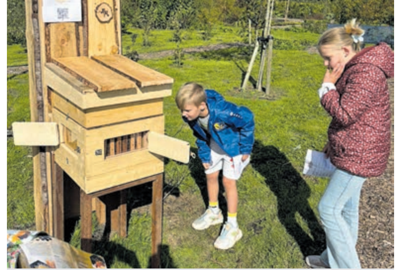
Wat hout kan opleveren.

Langs de route zijn allerlei lokale producten en lekkernijen te vinden, zoals geitenmelkzeep, appelazijn, kruidenoliën en zalven, vers gerookte paling, stroopwafels, lokaal vlees, poffertjes en ijs. Ook zijn er mooie kunstwerken, sieraden en andere unieke producten te koop.