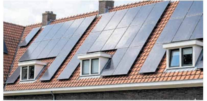
Veel mensen vragen zich af of het dan nog wel zinvol is te investeren in zonnepanelen.