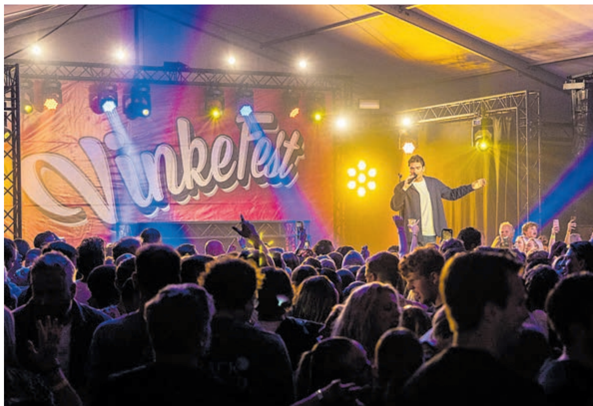
Een sfeerbeeld van verleden jaar.

KIJK VOOR MEER INFORMATIE OVER HET PROGRAMMA EN TICKETS OP WWW.VINKEFEST.NL