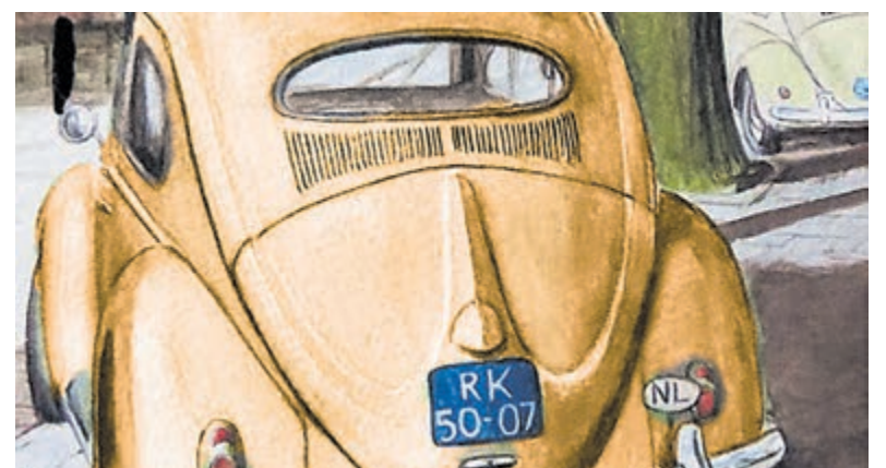
De brillen en ovalen verwijzen naar de achterruiten van de eerste modellen Volkswagen Kever.

verwachten we een grote opkomst liefhebbers die hun auto komen showen. En natuurlijk zijn er ook vele marktkramen vol met onderdelen, miniatures en andere VW gerelateerde artikelen. Het terras van café Stee Inn is de gehele dag geopend voor een hapje, drankje en gezelligheid en de band Boogie Dogs verzorgt de muziek.