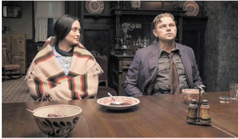
'Killers of the Flower Moon' in het Spoorhuis.