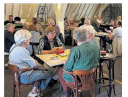
Succesvolle Kroegendrive Abcoude 2026.

het Sporthuis Abcoude. Het Gein en Angstelkooor zorgde met pakkende meezingers voor de vrolijke noot bij deze geslaagde bridgedrive.