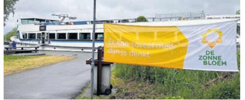
Met de Nirvana het water op.