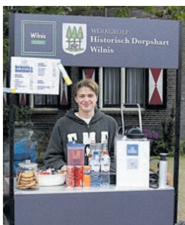
Broers Bakkie.

creëren voor wandelaars, dorpsgenoten en bezoekers. "Het is mooi om te zien hoe positief het initiatief wordt ontvangen", vertelt Kick enthousiast. "Volgende week zondag staat Jens er alleen voor, omdat ik dan andere verplichtingen heb." Met hun spontane enthousiasme en echte ondernemersmentaliteit laten de broers zien hoe een klein idee veel sfeer kan brengen in het dorp. Broers & Bakkie's groeit inmiddels uit tot een vertrouwd en gezellig onderdeel van de zondag in Wilnis.