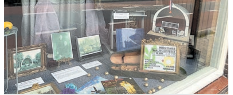
Het verhaalraam is te bezichtigen bij Mar van Spengen aan de Herenweg 159 in Vinkeveen.

Na een korte binnen verkenning werd duidelijk waar de brandhaard zich bevond en hoe de brand zich had uitgebreid. De bevelvoerder besloot daarop twee stralen lagedruk in te zetten om de brand effectief te bestrijden. Dankzij het snelle optreden was de brand snel onder controle en kon worden gestart met nablussen. Na het ventileren van de betrokken ruimtes kon de inzet worden afgerond. Tijdens de prijsuitreiking om 18.00 uur kreeg de ploeg te horen dat zij als derde waren geëindigd. Met dit resultaat heeft Jeugdbrandweer Mijdrecht zich geplaatst voor de halve finale, die op 20 juni zal plaatsvinden in Oss. De ploeg bestond uit bevelvoerder Finn van Dijk, pompbediende Laurens van de Linden, nummer 1 Shanaya van Goor, nummer 2 Joey Hooijmaijers, nummer 3 Roy Zum Vorde Sive en nummer 4 Max Felix.