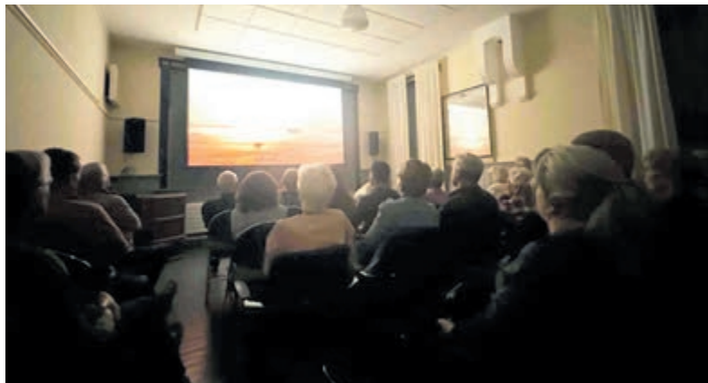
De 'filmzaal' van het Spoorhuis in Vinkeveen.