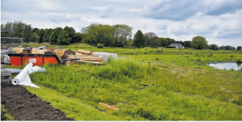
Vuilstort in de natuur.