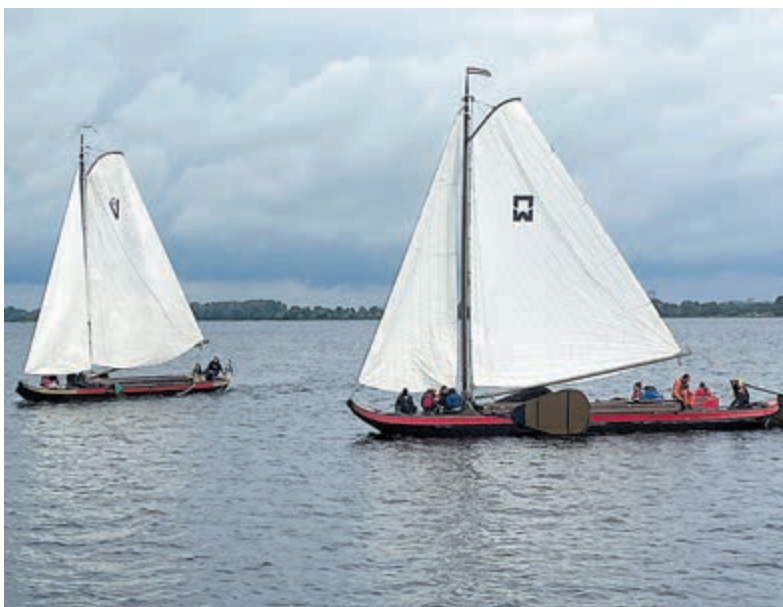
De strijd om de Geuzenpenning.

De start van de wedstrijden vindt plaats bij het clubschip van de WVA. Van daaruit varen de deelnemers via de Geuzensloot het parcours op.