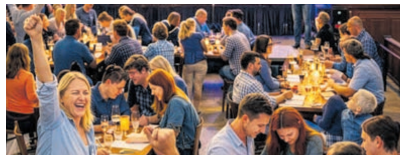
De Swingende Dorpsquiz is een compleet nieuw initiatief van de Lionsclub.

Voor de gelukkigen die op 13 juni wel aanwezig zijn, heeft hoofdsponsor Café Restaurant De Eendracht voorafgaand aan de quiz een speciaal arrangement samengesteld. Tussen 17.30 en 19.00 uur kunnen deelnemers genieten van de Quiz Special: een maaltijd naar keuze inclusief drankje voor 25 euro per persoon. Er is keuze uit vier gerechten, waaronder piepkuiken uit de oven, kabeljauwfilet, de Eendrachtburger of aardappelgnocchi. Het arrangement is exclusief beschikbaar voor bezoekers van de Dorpsquiz op vertoon van hun ticket. Vooraf reserveren is gewenst.