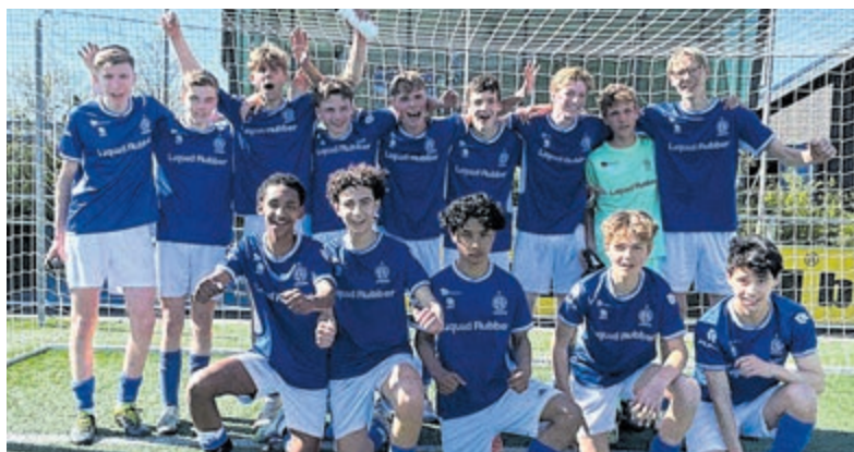
Argon JO16-1 door naar finale bekerwedstrijd.

Mijdrecht - Het team JO16-1 van Argon (foto) speelde afgelopen woensdagavond in Utrecht de halve finale van de bekerwedstrijd tegen Hercules JO16-2. Na een spannende wedstrijd die eindigde in 3-3, was het tijd om penalty's te nemen. Argon JO16-1 won uiteindelijk de strafschoppenserie en plaatste zich hierdoor voor de finale van de bekerwedstrijd. Tegenstander is Schagen United JO16-2. De wedstrijd wordt zaterdag 30 mei om 12.00 uur gespeeld bij FC Aalsmeer.