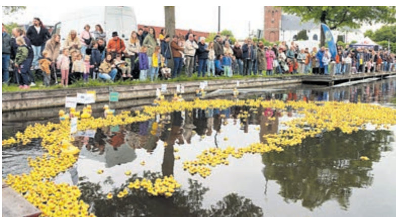
Duizenden badeendjes trotseren wolken en stroming voor Stichting Leergeld.