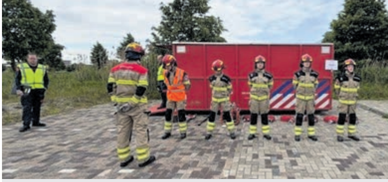
Halve finale voor Jeugdbrandweer Mijdrecht.