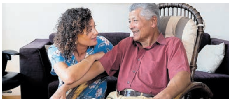
Hoe meer mantelzorgers deelnemen, hoe scherper het beeld wordt. Foto: dementiemonitor.nl .

wat werkt, en wat niet. Om die ervaringen structureel in beeld te brengen organiseren Alzheimer Nederland en het Nivel (Nederlands Instituut voor Onderzoek van de Gezondheidszorg) ook in 2026 de Dementiemonitor. Dit grootschalige, tweejaarlijkse onderzoek richt zich op mantelzorgers van mensen met dementie en brengt hun beleving van zorg en ondersteuning in kaart. Het onderzoek laat zien waar het