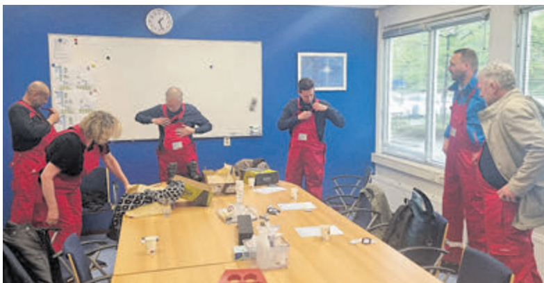
Collegeleden aan de slag voor Dagelijks Onderhoud.

"Wat mooi om te zien dat u op uw honderdste jaar nog zo vitaal bent, en uw geheugen nog zo goed. De verhalen over de oorlog hebben mij wel erg geraakt. Hoe uw partner zat ondergedoken en u thuis alles draaiend moest houden. Alle respect!" aldus de burgervader.