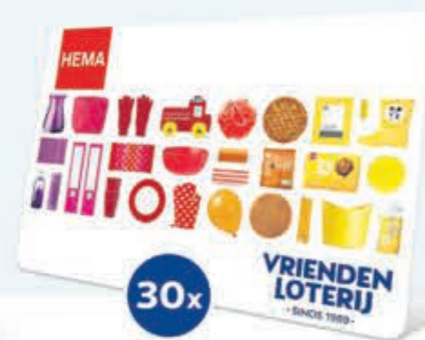
Hema Cadeaukaart t.w.v. € 25,-