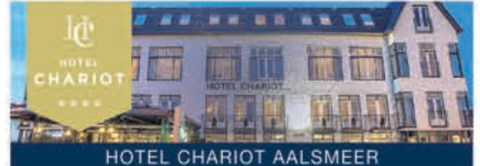
HOTEL CHARIOT AALSMEER

Te koop: Fietsdrager voor 2 fietsen, stek. 7polig, kantelbaar z.g.a.n. €40,-. Vouwkladder div. standen i.pr.st. werkblad max 3.60m. €50,-. Tel. 0297- 566061