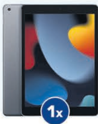
Apple iPad t.w.v. € 389,-

Of één van de andere fantastische prijzen!