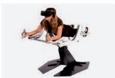
Verleg je grens in de VR-wereld