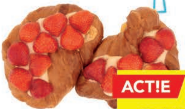
DEEN aardbeienkrakelingen doos 2 stuks