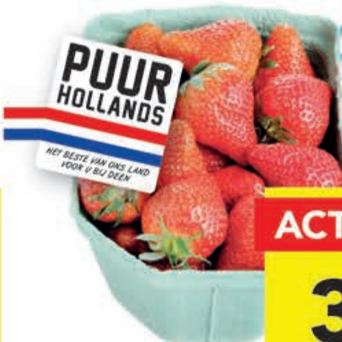
Aardbeien doos 500 gram