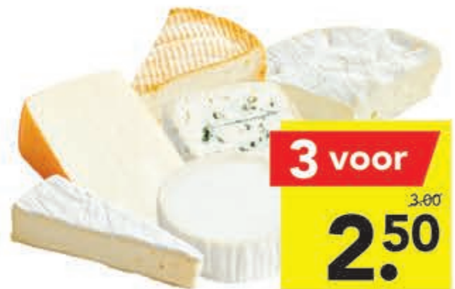
Buitenlandse eurokaasjes brie, camembert, St. Paulin, St. Flour, chèvre, marcaires of bleu d'auvergne 3 stuks à 62 - 100 gram