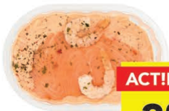
DEEN vissaladeschotel bak 250 gram