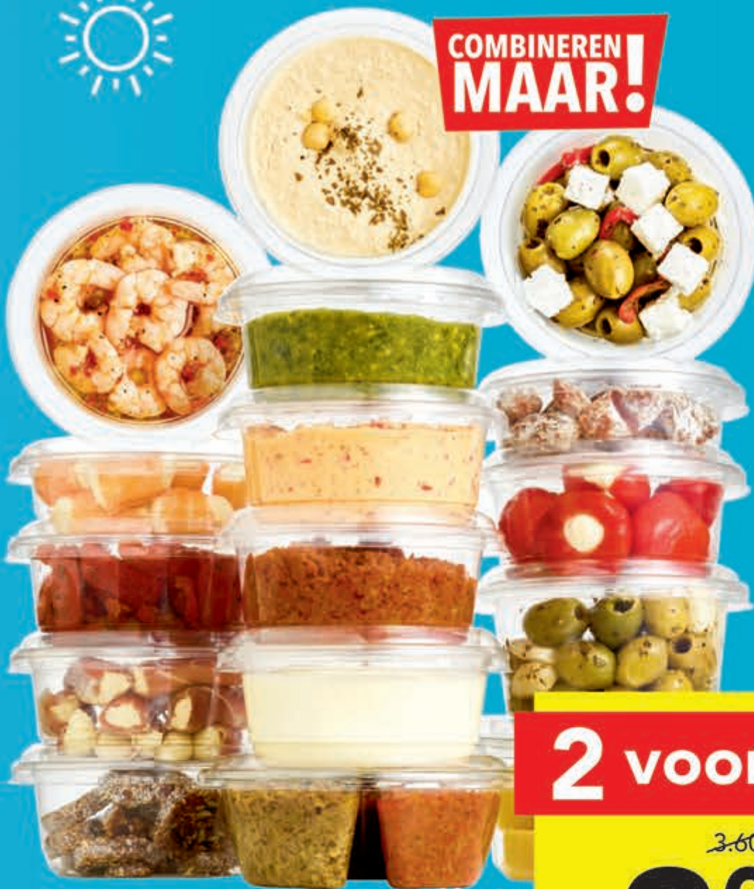
DEEN tapas of DEEN biologisch tapas alle soorten 2 bakjes