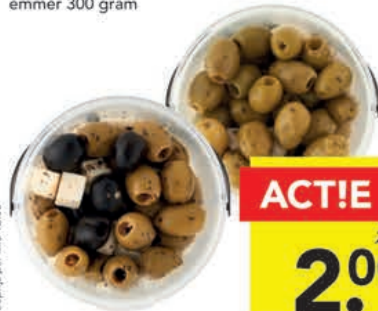
DEEN knoflook olijven of olijven met witte kaas emmer 300 gram