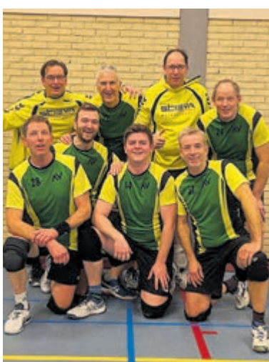
Atalante Vinkeveen zoekt versterking voor herenteams.

Vinkeveen - Volleybalvereniging Atalante Vinkeveen is op zoek naar nieuwe spelers voor de herentak van de vereniging. Met momenteel vier herenteams is er plek voor volleyballers van verschillende niveaus en leeftijden. Het eerste herenteam is gepromoveerd naar de promotieklassen en heeft de selectie helemaal rond. Het tweede herenteam komt uit in de tweede klasse en heeft als duidelijke ambitie om komend seizoen weer te promoveren naar de eerste klasse. Heren 3 bestaat uit een vaste kern van zeer ervaren spelers, waar spelplezier en teamgevoel centraal staan. Heren 4 vormt een gevarieerde groep qua leeftijd en niveau, met een goede balans tussen fanatiek en recreatief volleyballen.