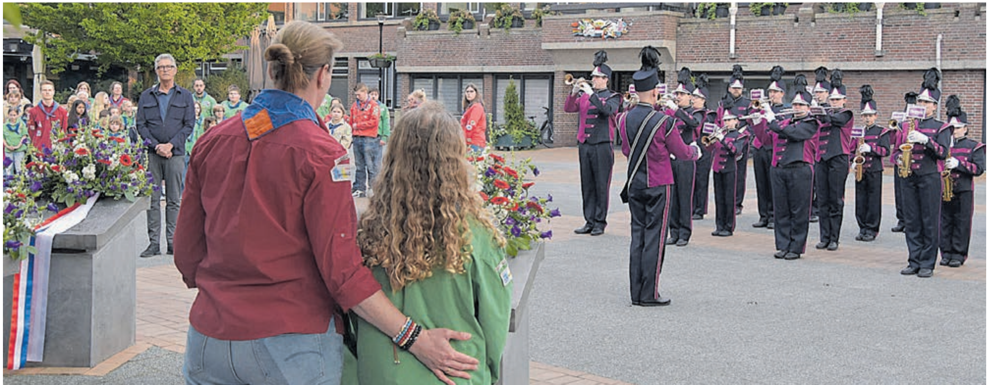
De ingetogen Dodenherdenking in Mijdrecht.