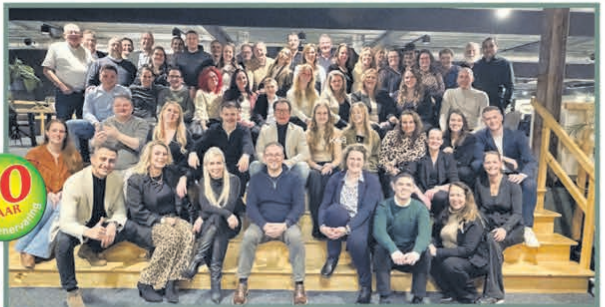
Welkom bij de Keukenwarenhuis.nl familie! Feest u mee?