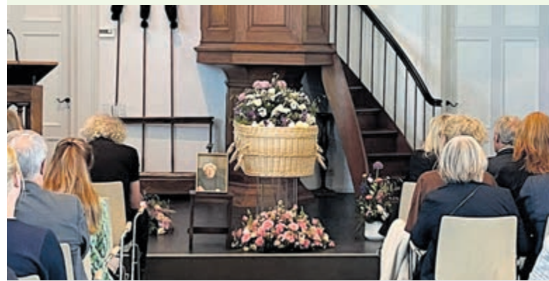
Tekst en foto's zijn geplaatst met volledige instemming van de familie.

En zo staat de familie na de dienst onder het orgel op de verhoging naast de mand, met een glas prosecco in de hand te proosten op het mooie leven dat zij met elkaar hebben gehad.