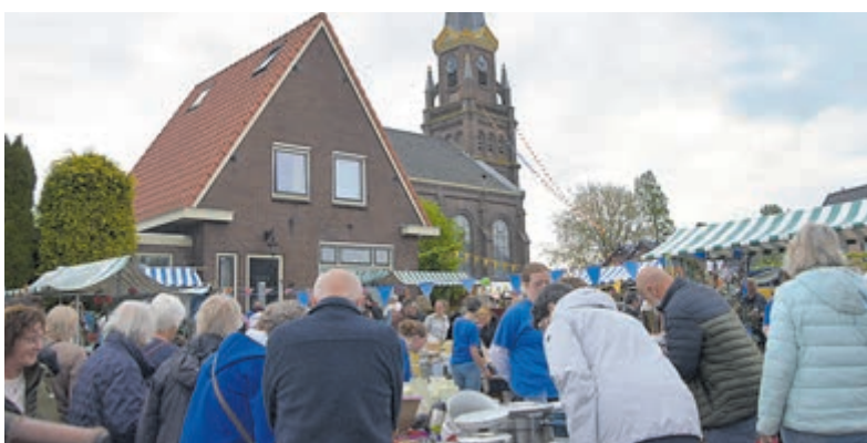
Wilnis vierde de 50e editie rommelmarkt.

servies en curiosa: voor veel aanwezigen zat er wel een verborgen schat tussen. De jubileumeditie kende bovendien een feestelijk randje, al bleef de organisatie bewust bescheiden in de aankleding. De opbrengst van de markt gaat dit jaar naar het WILMA-trainingsinstituut in Mathare, een van de grootste sloppenwijken van Nairobi in Kenia. Dit instituut is voortgekomen uit een samenwerking tussen de Hervormde Gemeente Wilnis en de Redeemed Gospel Church. Jongeren krijgen er de kans om opleidingen te volgen