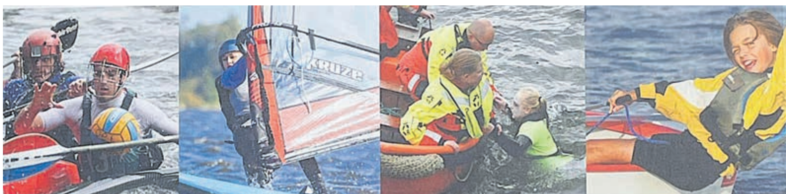
Gratis zeilen, suppen, windsurfen, kanoën en nog veel meer.