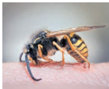
Mogelijk vroeg wespenseizoen in De Ronde Venen en Uithoorn.

wespennesten op, terwijl 2018 juist een recordjaar was. De komende maanden zullen uitwijzen hoe de zomer van 2026 zich ontwikkelt. Wie overlast wil voorkomen, doet er goed aan nu al alert te zijn en preventieve maatregelen te nemen.