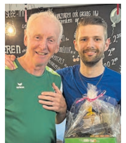
'Kampioenen' bij Veenshuttle.

Wie zelf eens wil ervaren hoe toegankelijk en gezellig de club is, kan vrijblijvend komen proefspelen bij De Phoenix aan de Hoofdweg 85 in Mijdrecht. Meer informatie is te vinden op www.veenshuttle.nl .