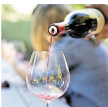
Kom wijnproeven in de binnentuin aan de Herenweg 173 in Vinkeveen.

Twee Piemonteze wijnen worden nadrukkelijk uitgelicht: de Langhe Nebbiolo DOC 'Il Gio Pi', elegant en subtiel van karakter, en de Dolcetto d'Alba DOC 'La Campanelle', toegankelijk maar met diepgang. Wijnen die illustratief zijn voor de veelzijdigheid van het gebied in Italië. De proeverij is vrij toegankelijk en aanmelden is niet nodig. Daarmee blijft het karakter laagdrempelig: binnenlopen, ontdekken en vooral genieten. Een middag waarin smaak en sfeer vanzelfsprekend samenkomen in het groen van een Vinkeveense binnentuin.