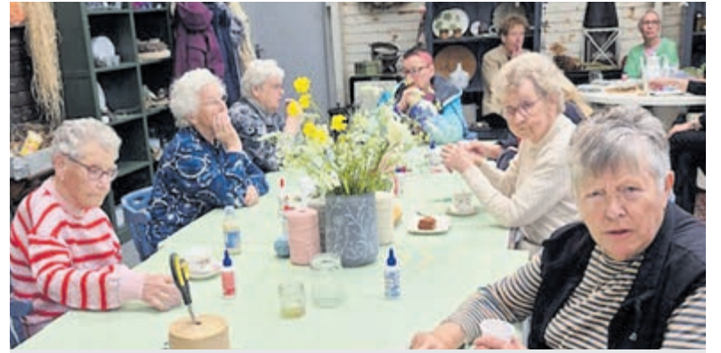
De vrouwen bij 'Onderons-Jaja'.

De kerk opent om 14.30 uur, het concert begint om 15.00 uur. Na afloop is er gelegenheid tot napraten bij Zorghuis Tante Bep naast de kerk. De collecte is bestemd voor Soos De Cirkel. Meer informatie: www.zondagmiddagconcerten.com .