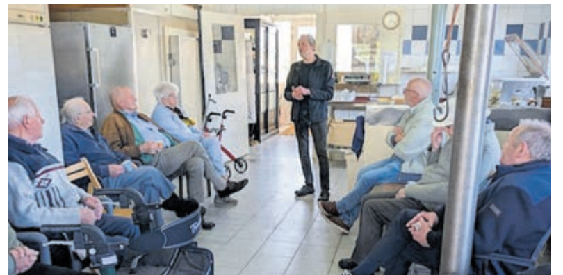
De mannen 'aan de paling'.

Een week later was het de beurt aan de vrouwen, die samenkwamen bij 'Onderons-Jaja' aan de Westerlandweg. Tijdens een creatieve middag maakten zij bloempotjes, onder het genot van koffie, thee en taart. Na een heldere uitleg ging iedereen enthousiast aan de slag. Het resultaat: unieke, zelfgemaakte potjes vol groen en vooral een middag vol plezier.