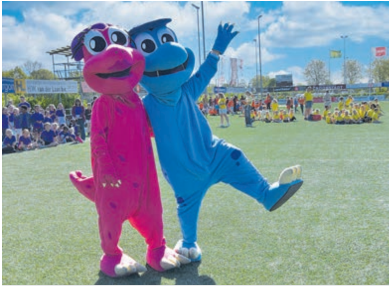
De Partou-mascottes Daantje en Dirk mochten niet ontbreken en zorgden voor extra enthousiasme op het veld.