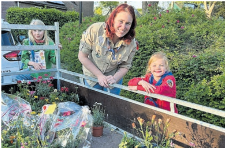
Scouts komen weer langs met de mooiste plantjes.

Onderdeel van Regio Media Groep B.V. www.regiomediagroep.nl