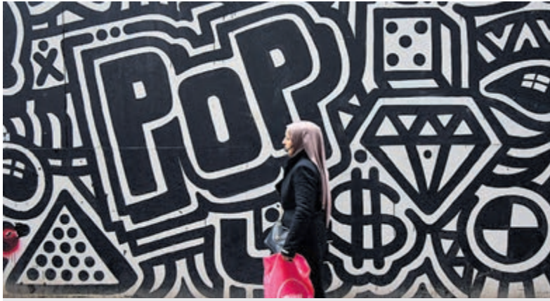
Werk van Wilco de Vries.