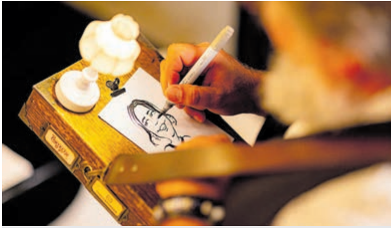
Illustrator BramBram maakt miniportretten in Mijdrecht Dorp.