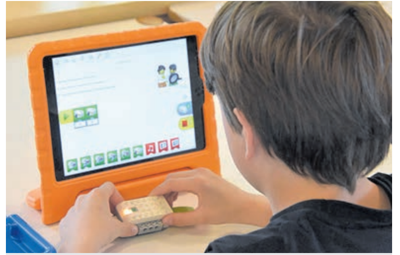
De danseres van Jelena Wasiljewa.