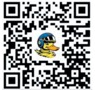
Scan de QR-code.

een fiets, laptop, zwemles, sportclub of culturele activiteiten. Zo zorgen zij ervoor dat kinderen niet buitengesloten worden en zich volwaardig kunnen ontwikkelen met meer zelfvertrouwen en meer kansen. Een badeendje kost slechts 3 euro per stuk of 4 voor 10 euro. Deelnemen is eenvoudig en vooral: ontzettend leuk. Bestellen kan via het scannen van de QR-code. Leden van de Lions zijn tot aan de racedag te vinden op de wekelijkse markt om badeendjes te verkopen.