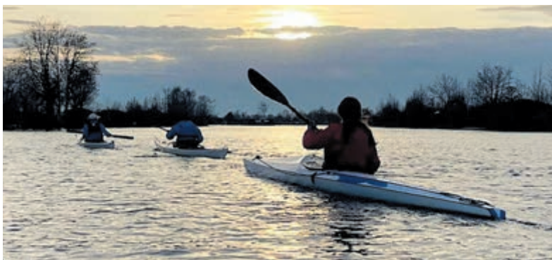
De watersportdag nodigt uit tot kennismaken met kajakken.

De vereniging heeft een driebanden afdeling op de vrijdagmiddag. En speelt mee in De Veer en Rijnstreek met een driebanden team en nog een driebanden groot team en had dit jaar drie teams in de biljartfederatie De Ronde Venen. Maar helaas door afvallen van leden ziet het er naar uit dat er voor het volgende seizoen maximaal twee teams daarin zullen kunnen meespelen. Interesse om mee te spelen? Stuur een mailtje naar BCdehoef@gmail.com.