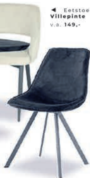
◀ Eetstoel Villepinte v.a. 149,-