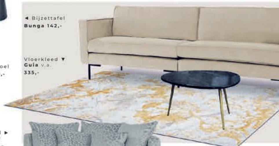
◀ Bijzettafel Bunga 142,-