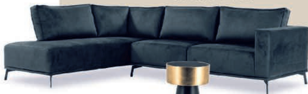
▼ Loungebank Leonore zoals afgebeeld v.a. 839,-