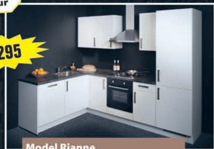
Model Rianne zijdeglans witte keuken uit voorraad, 187 x 275 cm.

Supercompleet met oven, kookplaat, vaatwasser, trechterschouw, koelkast/vriezer, aanrechtblad, spoelbak en kraan. Met 5 jaar garantie. Aanpassingen mogelijk!