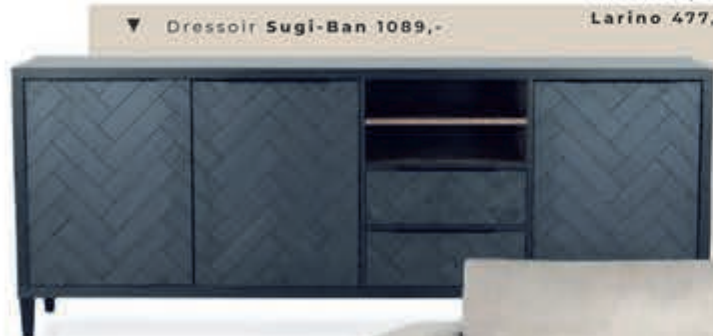
▼ Dressoir Sugi-Ban 1089,-