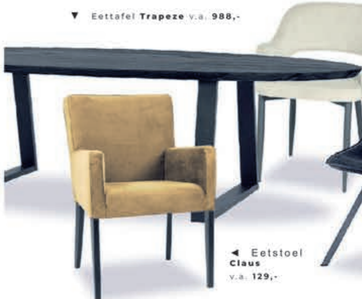
▼ Eettafel Trapeze v.a. 988,-