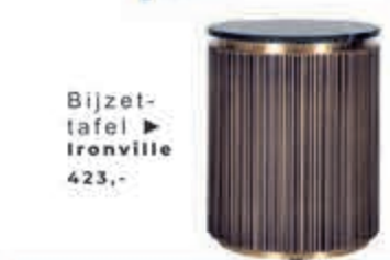
Bijzettafel ▶ Ironville 423,-