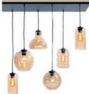
◀ Hanglamp Fantasy 439,-

Verkrijgbaar in meer dan 3600 verschillende kleuren en bekleding.