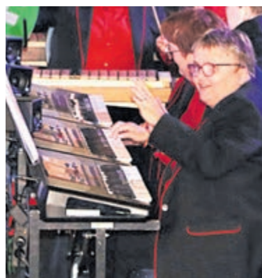
Geslaagd Jostiband-concert.

De belangstelling uit de regio was groot. De zaal was goed gevuld en mede dankzij de inzet van sponsors konden zo'n 500 kaarten worden weggegeven. Daarmee kregen ook mensen voor wie een concertbezoek niet vanzelfsprekend is de kans om deze bijzondere avond live mee te maken. Tijdens de avond werd bovendien een cheque van 4.000 euro overhandigd aan de Jostiband. Daarnaast blijft er vanuit de opbrengst ook nog een bedrag beschikbaar voor andere goede doelen, die Rotary Aalsmeer-Uithoorn-Mijdrecht ondersteunt. Rotary Aalsmeer-Uithoorn-Mijdrecht kijkt met trots en dankbaarheid terug