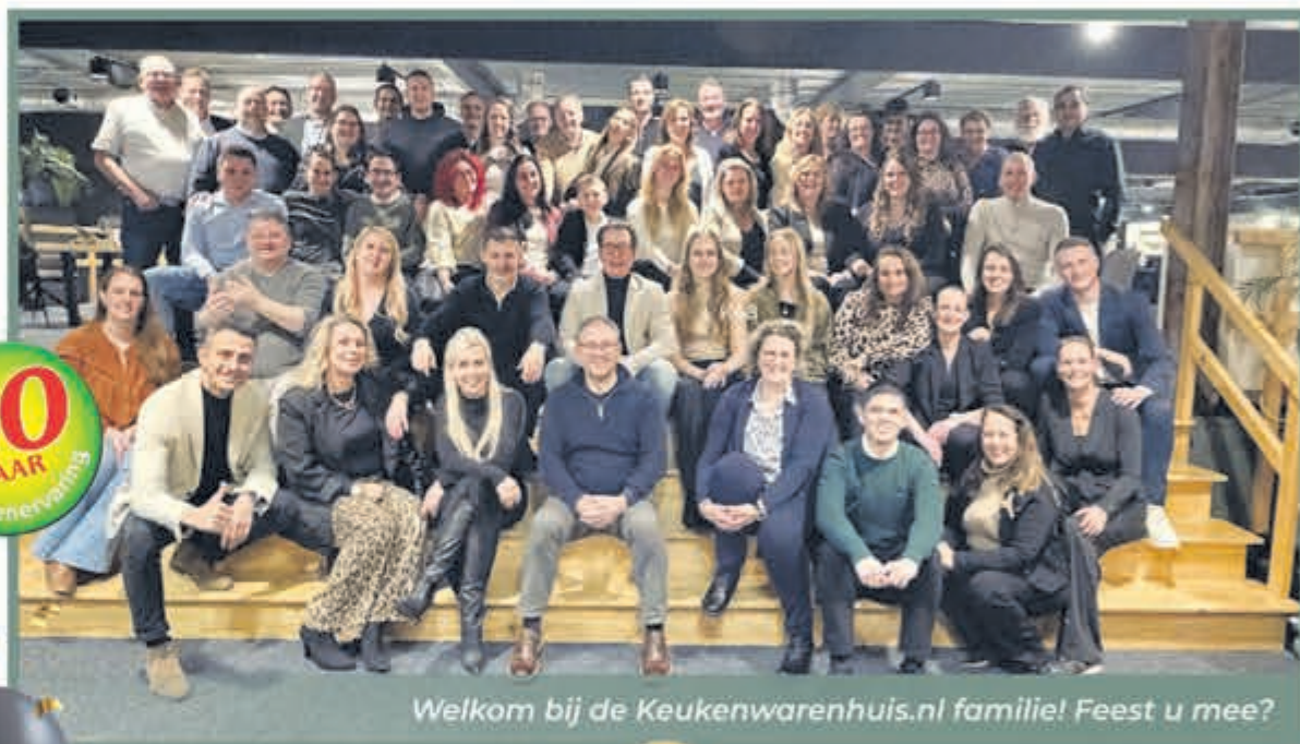
Welkom bij de Keukenwarenhuis.nl familie! Feest u mee?