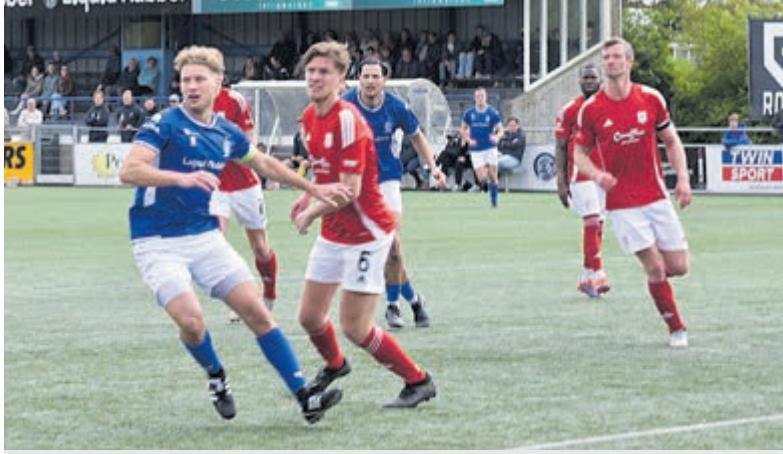
Argon heeft tegen concurrent VSV uit Velsbroek de punten in Mijdrecht gehouden.