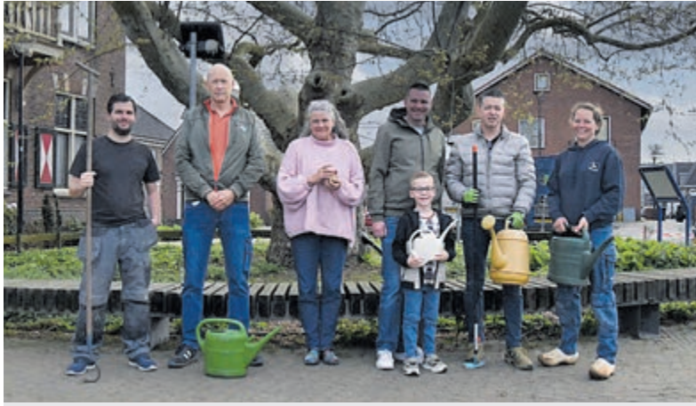
Het woensdag waterdag-team.