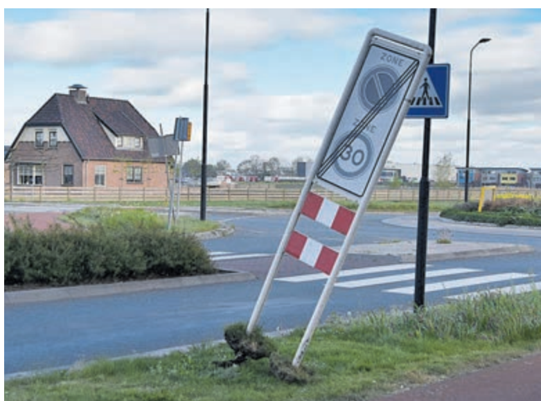
Het uit de grond getrokken 30-km/uur-bord in Marickenland.

UIT DE GROND GETROKKEN 30-KM/UR-BORD BIJ MARICKENLAND