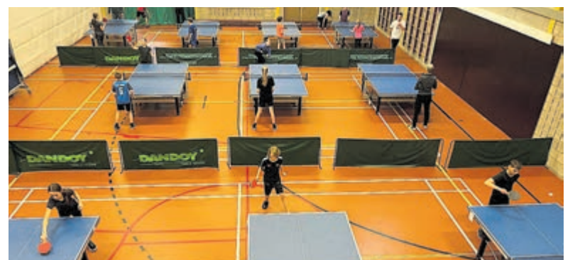
Maak kennis met tafeltennis.

tafeltennis kent drie groepen: veteranen op vrijdagmiddag van 16.00 tot 17.00 uur, jeugd van 19.00 tot 20.00 uur en senioren van 20.15 tot 22.00 uur. In het seizoen zijn er wedstrijden. Er wordt gespeeld in De Willisstee in Wilnis. Meer informatie en/of aanmelden: tafeltennis@veenland.nl.