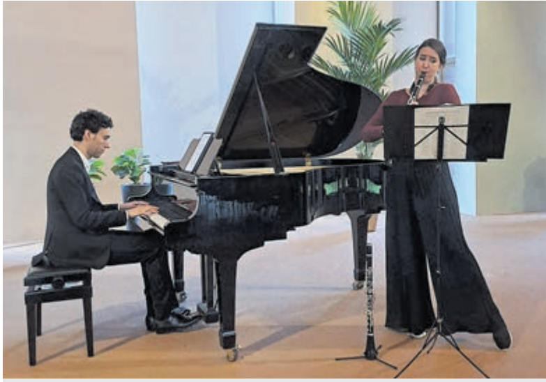
Klarinet en piano.