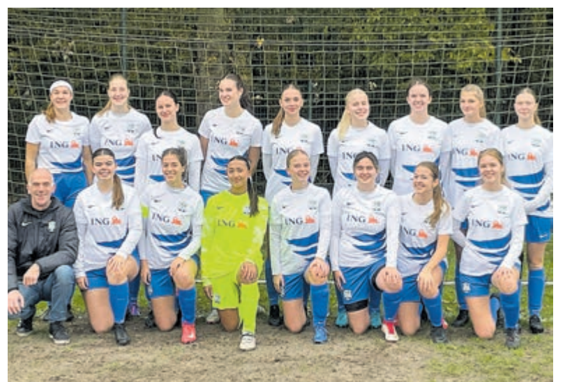
Hertha Dames 1.