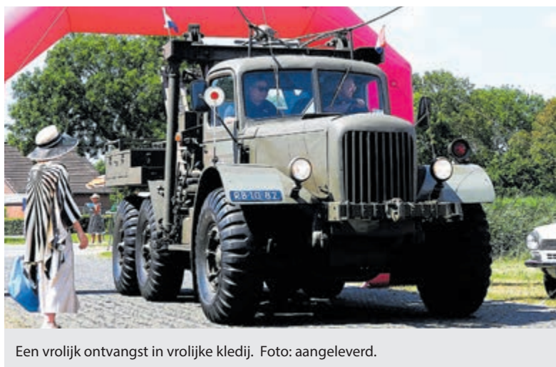
Een vrolijk ontvangst in vrolijke kledij.

wagens, motorfietsen en brommers, variërend van 25 tot meer dan 100 jaar oud. Ze worden traditiegetrouw ontvangen door gastvrouwen in feestelijke jurken een detail dat inmiddels net zo karakteristiek is als de voertuigen zelf. Met het uitgebreid food-court, muziek, countryline dance demo's en diverse kraampjes wordt het opnieuw een échte familiemiddag.