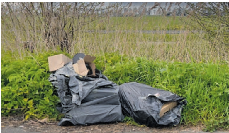
Zwerfafval blijft hardnekkig probleem bij Wickelhofpark in Mijdrecht.

Samen met genodigden stapte wethouder Anja Vijselaar op de fiets om de bruggen officieel te openen. De vernieuwing van de bruggen maakt deel uit van het bredere renovatieprogramma voor de bruggen in Abcoude en Vinkeveen. De werkzaamheden zijn volgens planning op tijd afgerond voor de start van het vaarseizoen.