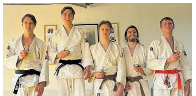
De clubkampioenen gehuldigd.