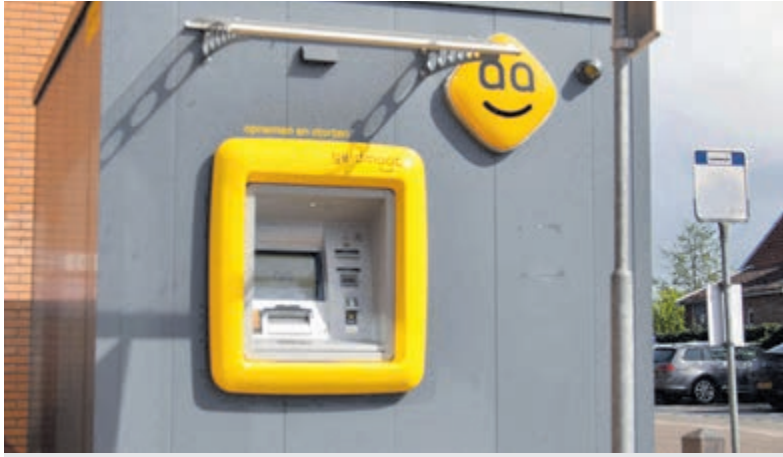
Beperkte openingstijden sealbagautomaat na reeks plofkraken.