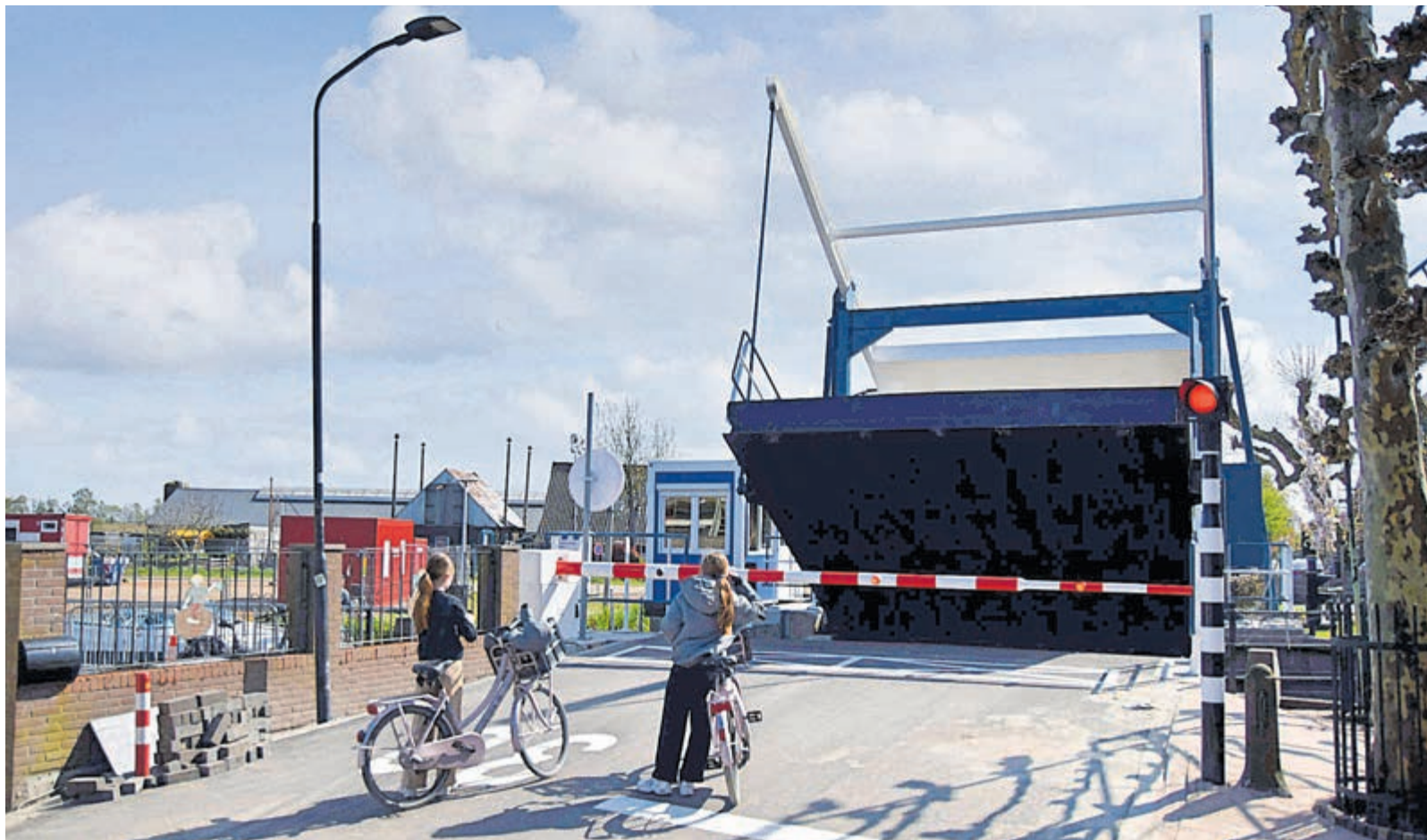
De Heulbrug is weer open voor fietsers.