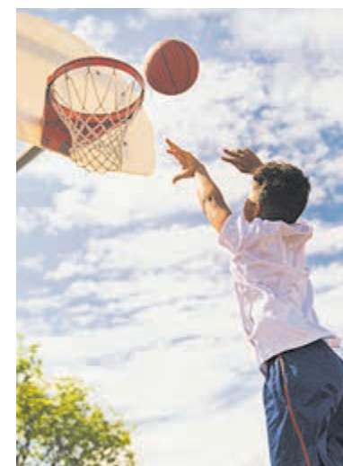
Zomervakantieactiviteiten ook voor gezinnen met een krappere budget.

Naast plezier hebben de activiteiten een bredere waarde. Door actief bezig te zijn blijven kinderen zowel fysiek als mentaal in beweging. Bovendien biedt het programma-structuur in een periode waarin dat voor sommige kinderen extra belangrijk is. Ook ouders hebben er baat bij. Zij weten dat hun kind in een veilige omgeving deelneemt aan activiteiten onder begeleiding van ervaren professionals en vrijwilligers. Dat kan zorgen voor rust en ontlasting, zeker in gezinnen waar financiële zorgen spelen. Het volledige vakantieprogramma is te bekijken via de website van Team Sportservice De Ronde Venen: www.teamssportservice.nl/de-ronde-venen/activiteiten .