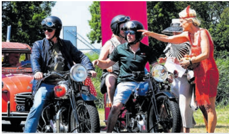
Klassieke motoren en auto's wordt de weg gewezen.