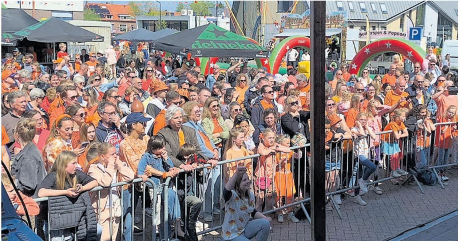
Traditioneel volop oranje in Vinkeveen.