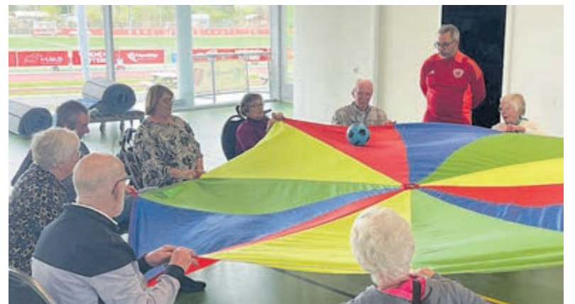
De RIKI-stichting laat de Zonnebloem bewegen.

planten, bloemen en boompjes voor tuin en balkon. Families struinden samen langs de kraampjes, op zoek naar inspiratie om hun tuin of balkon weer helemaal op te fleuren voor de zomer. Met de geur van bloemen in de lucht en mensen die fluitend over het plein liepen, voelde het echt als de start van de lente.