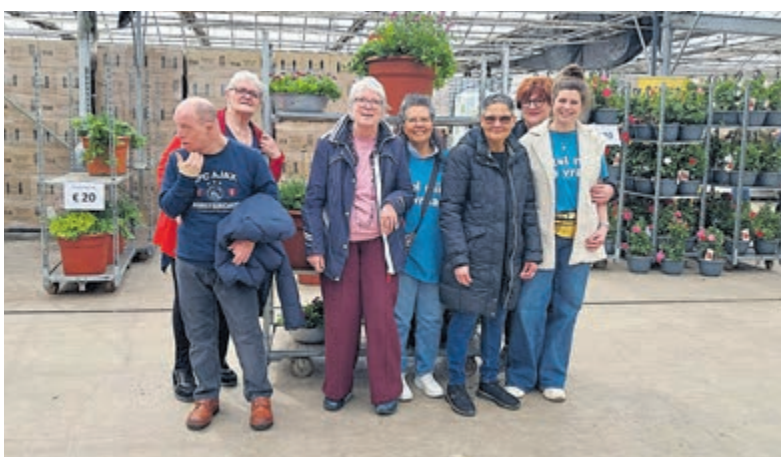
Groen uitje voor cliënten van Zideris tijdens Kom in de Kas.

Zideris is een regionale zorgorganisatie, die begeleiding en ondersteuning biedt aan mensen met een verstandelijke beperking.