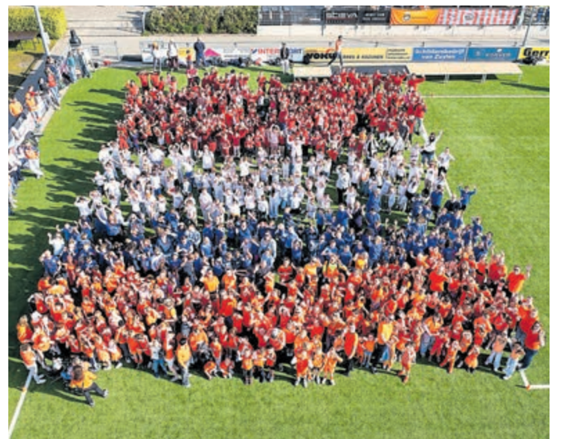
Leerlingen van groep 3 tot en met 8 van verschillende basisscholen in De Ronde Venen vierden vrijdag 17 april gezamenlijk de Koningsdagen.

Volgens het leerlingenpersteam van Kids College was het een geslaagde dag. "Er zijn veel spelletjes gedaan, iedereen deed sportief mee en de sfeer was erg prettig", aldus de organisatie. "Een dag om met plezier op terug te kijken." De organisatie spreekt daarnaast haar dank uit aan de sponsors die de Koningsdagen mogelijk maakten: CSW, Jumbo Wilnis, EHBO Wilnis, Ruizendaal en het Sportakkoord van gemeente De Ronde Venen.