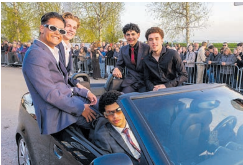
In creatieve en opvallende voertuigen arriveerden leerlingen.

De Kwakel/Uithoorn - Vrijdag 10 april vierden de leerlingen van 5 havo en 6 vwo hun galafeest bij Gasterij De Kwakel. In creatieve en opvallende voertuigen arriveerden zij in groepjes, toegejuicht door een grote groep van ouders, familie en vrienden. Het zonnige voorjaarsweer gaf het evenement een feestelijke sfeer en zorgde voor een stralende start van de avond.