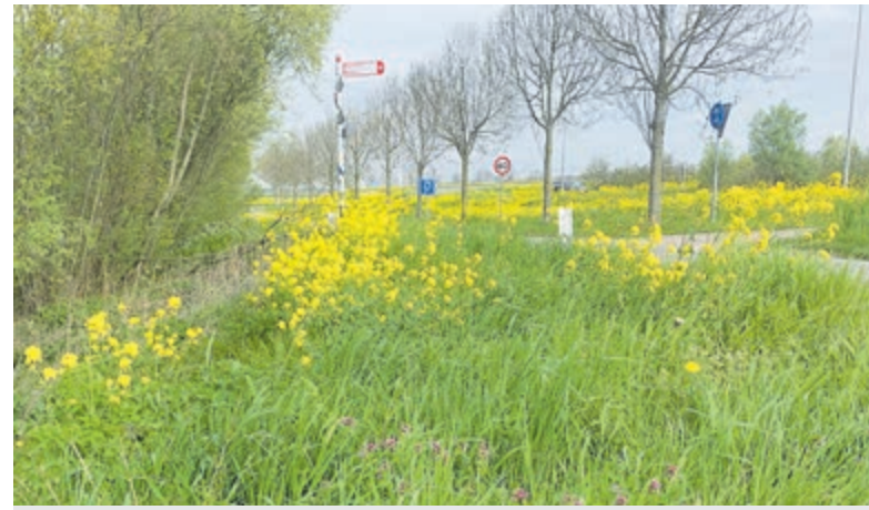
Waar de lente het asfalt verslaat.

Mijdrecht krijgt 28 juni nog een keer de kans om het verleden te zien, horen en ruiken, rollend, glimmend en liefdevol onderhouden. Wie het nog nooit meemaakte, moet dit moment aangrijpen. En wie er al vaker was, weet: sommige tradities zijn te mooi om te laten verdwijnen.