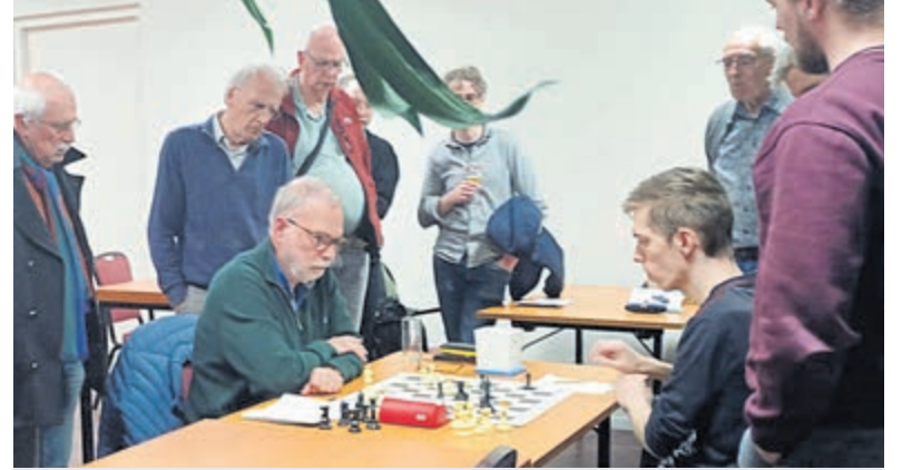
Denk en Zet 2 promoveert naar de tweede klasse.