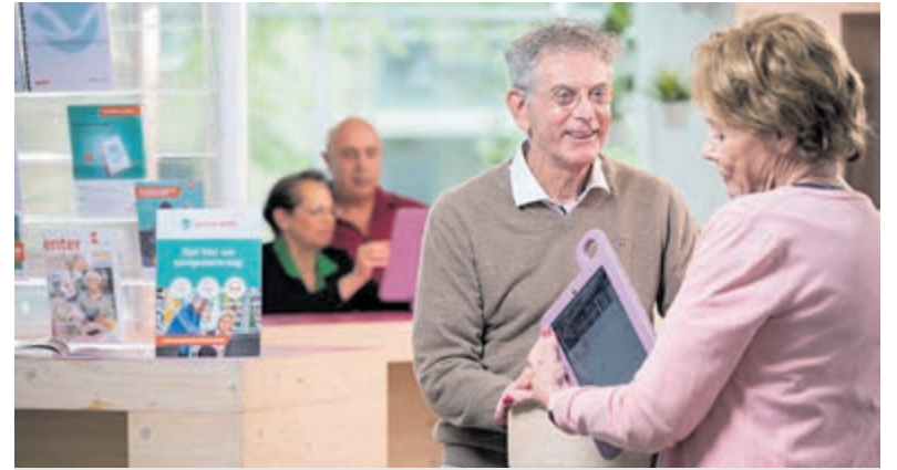
Vanwege de grote belangstelling presenteert SeniorWeb Mijdrecht opnieuw de workshop 'Kunstmatige Intelligentie'.

Sealbagautomaten zijn speciaal ontworpen voor ondernemers die contant geld willen storten via een verzegelde plastic zak. Juist dit type automaat blijkt gevoelig voor aanvallen met explosieven. Andere geldautomaten van Geldmaat, bedoeld voor het opnemen of storten van biljetten en munten, blijven wel volgens de reguliere openingstijden beschikbaar. Men benadrukt, dat het om een tijdelijke maatregel gaat en dat de automaat op voornoemde locatie niet zal verdwijnen.