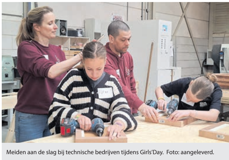
Meiden aan de slag bij technische bedrijven tijdens Girls'Day.