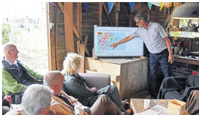
Uitleg over het Groene Huisje aan de Industrieweg.

Komende woensdag spelen de dames thuis tegen Voorwaarts. Met slechts één punt zijn zij verzekerd van het kampioenschap. De wedstrijd begint om 20.00 uur. Verder is Hertha Dames 1 nog op zoek naar nieuwe speelsters voor volgend seizoen. Meer informatie: frankvousten@hertha.nl.