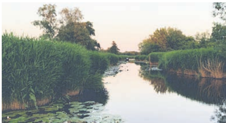
Een betere waterkwaliteit en hogere grondwaterstand is dringend nodig in Botshol.

De waterkwaliteit is onvoldoende, de grondwaterstand daalt in droge perioden te sterk en de stikstofbelasting is nog steeds te hoog. Voor deze knelpunten zijn tot nu toe geen, of onvoldoende maatregelen genomen, terwijl dat essentieel is voor het behoud en herstel van de natuur in Botshol. De Ecologische Autoriteit wijst er in haar advies op dat zonder maatregelen verdere verslechtering niet is uit te sluiten. Naast het verminderen van de stikstofdepositie zijn aanvullende maatregelen binnen en buiten Botshol nodig die de waterkwaliteit verbeteren en zorgen voor een stabiele hoge grondwaterstand, ook tijdens droge perioden. Deze maatregelen moeten bijdragen aan herstel van de waternatuur en duurzaam behoud van de veenmosrietlanden, galigaanmoerassen en hoogveenbossen. Het verbeteren van de waterkwaliteit brengt naast de Natura 2000-doelen ook de doelen van de Kaderrichtlijn Water dichterbij.