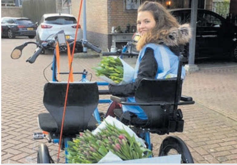
Bloemen als erkenning en een dringende oproep. Foto aangeleverd.