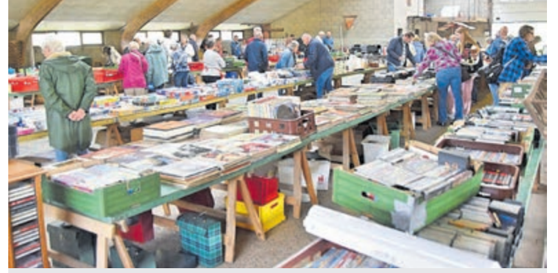
Rustig langs de kramen struinen.

eerste koude oorlog. De presentatie start rond 20.30 uur in de Oudheidkamer aan de Croonstadlaan 4A in Mijdrecht. De toegang is gratis. Paul Hoogers neemt belangstellenden op zijn herkenbare, aantekelijke wijze mee naar de periode, die bij velen vermoedelijk de nodige herinneringen oproept. Hij bespreekt de historische ontwikkelingen tussen ongeveer 1945 en 1989. Een tijds-spanne, waarin de kapitalistische Verenigde Staten en de communistische USSR als kemphanen tegenover elkaar stonden. Niet alleen op politiek gebied maar eveneens op economisch terrein. Daarnaast hing er een voortdurende dreiging van een nucleaire oorlog. In de presentatie focust Paul met name op gebeurtenissen die zich afspeelden op het westelijk halfrond. Veel bekende foto's passeren daarbij de revue. Politiek getinte cartoons krijgen eveneens aandacht. En ook de muzikale component ontbreekt niet.