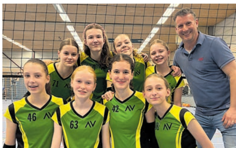
Atalante MC1 kampioen eerste klasse.