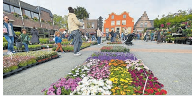
Plantenmarkt op het Raadhuisplein.

Namens alle cliënten spreekt Zideris een hartelijk dankwoord uit aan Kwekerij Alpha voor dit gulle gebaar.