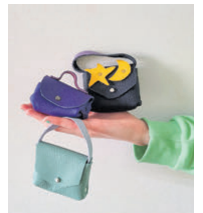
Voorbeelden van leren werkstukken die kinderen maken tijdens de TechniekClub Leerbewerking. Foto: aangeleverd>

Wie zich inschrijft voor een module, schrijft zich dus in voor alle vier de bijeenkomsten. Aan de TechniekClub zijn geen kosten verbonden. Deze activiteit wordt mogelijk gemaakt door Gemeente De Ronde Venen. Aanmelden kan via https://techne-tamstelenvenen.nl/makerspace/techniekclub-leerbewerking