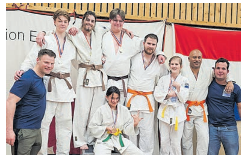
Judoka's Blaauw goed in actie.