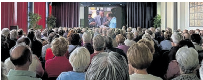
Nostalgische filmmiddag in Vinkeveen.

rijke mix aan stijlen: van klassieke werken die het hart raken tot frisse, eigentijdse muziekstukken die het publiek zullen verrassen. Ook het kwintet van Con Amore laat van zich horen in de vertrouwde bezetting, waarmee zij al jarenlang een geliefde aanvulling vormen op de concerten. Dit concert heeft bovendien een bijzonder tintje. Na ruim 23 jaar van toewijding, inspiratie en betrokkenheid neemt Con Amore afscheid van haar dirigent. Het optreden vormt daarmee niet alleen een muzikale belevenis, maar ook een waardevol moment om stil te staan bij zijn jarenlange bijdrage aan de vereniging en haar ontwikkeling.