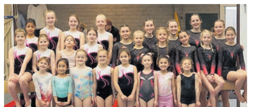
Ter afsluiting werd een grote groepsfoto gemaakt, een passend slot van een vrolijke, sportieve ochtend.

terden aan jury en publiek. Al snel maakte de zenuwen plaats voor plezier, en was te zien hoe de spanning van de schouders gleden. Wat bleef, was enthousiasme. Want winnen stond deze ochtend niet centraal: meedoen en laten zien wat je kunt wel. Daarom ging niemand met lege handen naar huis. Iedere turnster ontving na afloop een mooie medaille als herinnering aan deze geslaagde sportdag. Ter afsluiting werd een grote groepsfoto gemaakt, een passend slot van een vrolijke, sportieve ochtend. Wie zelf kennis wil maken met turnen bij GVM'79 is van harte welkom. Aanmelden voor een proefles kan via de website van de vereniging.