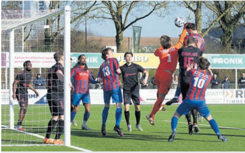
CSW geveld door bekende voetbalwet.