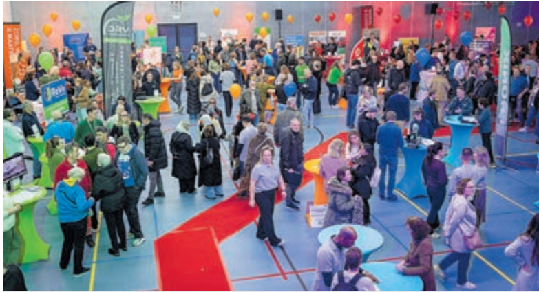
Gemeenten De Ronde Venen en Uithoorn organiseerden een banenmarkt.