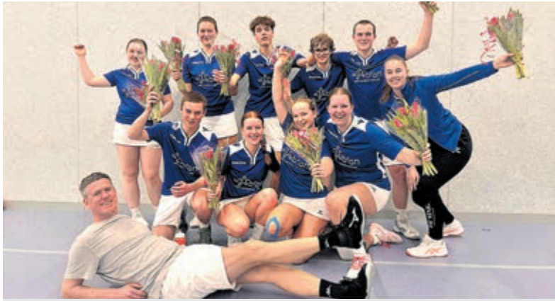
De Vinken J1.