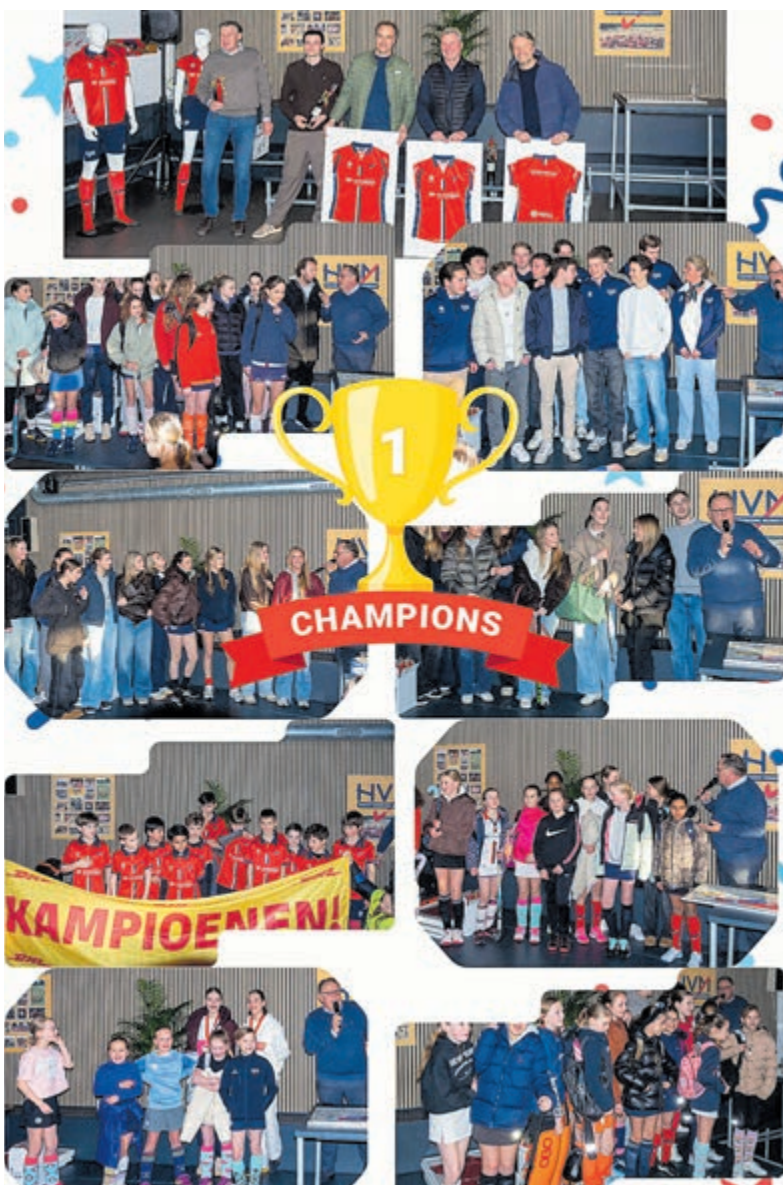
Afgelopen 13 maart werden maar liefst acht teams gehuldigd voor hun topprestaties in de zaal.