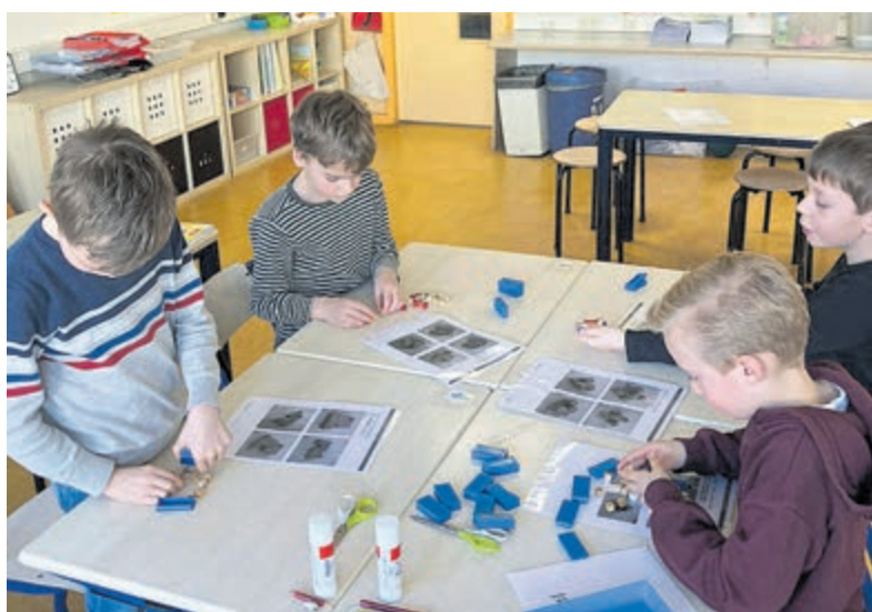
Grote Rekendag op de Koningin Julianaschool in Wilnis.

De Grote Rekendag was inspirerend. Eén ding is zeker: op de Koningin Julianaschool hebben ze ervaren dat rekenen allesbehalve saai is.