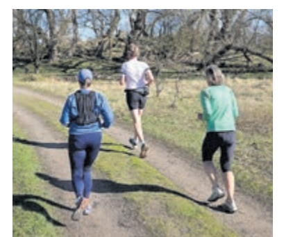
Open avond bij De Veenlopers in Mijdrecht.

voorjaarsclinic hardlopen of wandelen. Daarnaast organiseert De Veenlopers in de zomer bos-trainingen in het Amsterdamse Bos en regelmatig trailruns of wandelingen op bijzondere locaties. Meer informatie: www.veenlopers.nl .