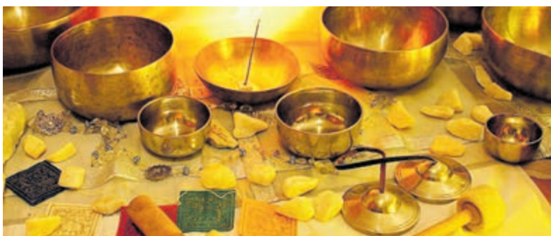
Innerlijke reizen ervaren in Wilnis en Uithoorn.

De diversiteit aan bedrijven was indrukwekkend: van zorg en schoonmaak tot logistiek, productie, beveiliging, bouw, detailhandel, onderwijs, kinderopvang en werken bij de gemeente. Dankzij de aanwezigheid van jobcoaches en klantmanagers konden kandidaten direct worden begeleid naar passend werk. Voor werkzoekenden was het een kans om een diversiteit aan beroepen te ontdekken en direct werkgevers te spreken. Er werden visitekaartjes uitgewisseld, contactgegevens genoteerd en zelfs al kennismakingsgesprekken gepland.