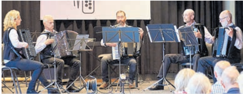
Accordeonvereniging Con Amore speelt 29 maart in De Boei.