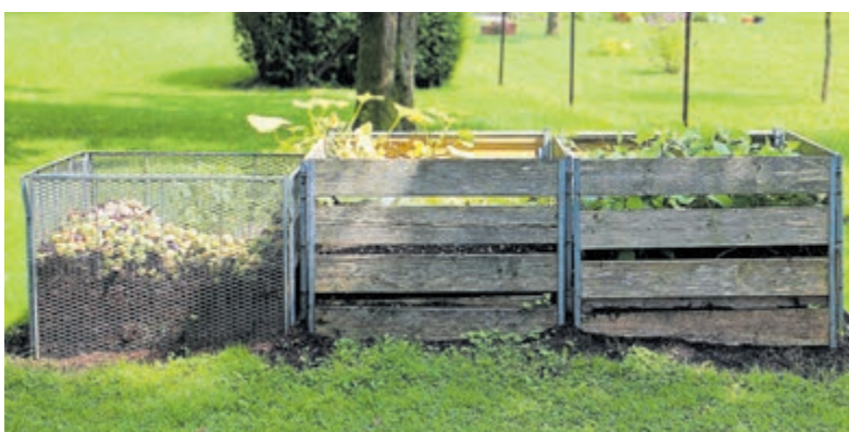
Gratis compost voor inwoners.

Inwoners kunnen terecht op drie locaties: parkeerterrein Algemene Begraafplaats Wilnis (Ringdijk), Kringkoop Mijdrecht, Constructieweg 66, en afvalbrengstation Abcoude, Bovenkamp 15. Voor het ophalen van de compost is geen bezoekersstrip van de afvalscheidingspas nodig. Met deze jaarlijkse actie wil de gemeente bewoners blijven stimuleren om hun GFTE-afval netjes te scheiden, zodat er meer hoogwaardige compost kan worden geproduceerd.