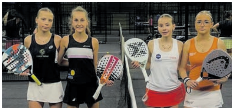
Jeugd VLTV en MY Tennis &amp; Padel maakt grote indruk op NK Padel Jeugd.