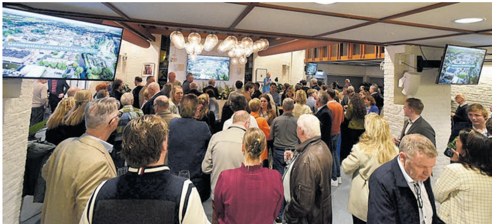
De gemeenteraadsverkiezingen van 2026 in De Ronde Venen markeren een duidelijke politieke verschuiving.