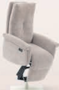
Sta-op stoel Maratea