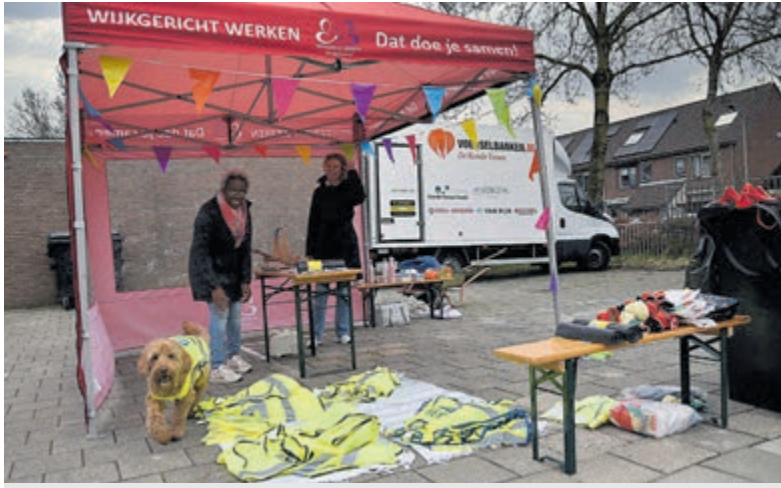
Alle attributen voor de wijkschoonmakers stonden klaar.