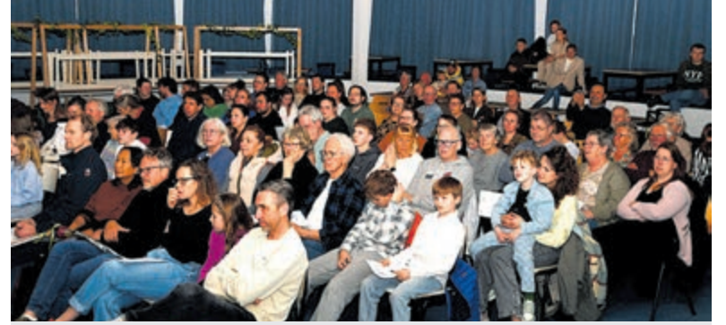
Heerlijke piano-biënnale bij Marleen in het VLC.

toe is het antwoord altijd geweest: we moeten de ganzen bestrijden. Wij vragen dan altijd: maar waarom in het broedseizoen en ten koste van wat? Wij zijn van mening dat de jacht op ganzen en ander wild in het broedseizoen schade toebrengt aan het broedsucces van andere vogels die wij en met ons alle andere Nederlanders graag zien. Vogels zoals de