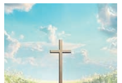
In de Stille Week op weg naar Pasen.