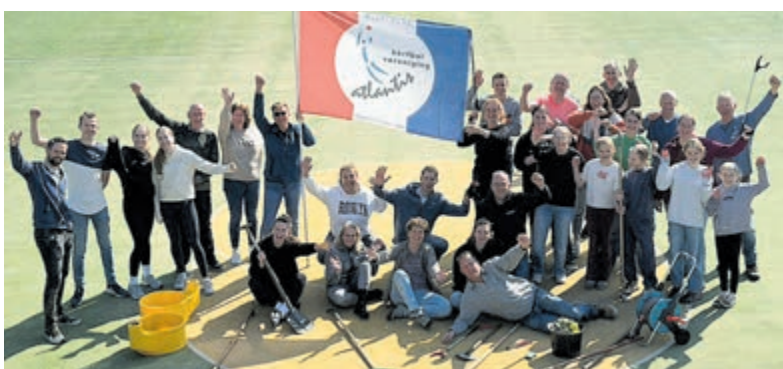
Ruim 30 vrijwilligers meldden zich om het complex klaar te maken voor het buitenseizoen.

aan NL Doet, de jaarlijkse vrijwilligersactie van het Oranje Fonds. Ruim 30 vrijwilligers meldden zich om het