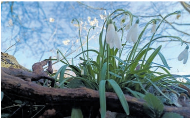
Het bescheiden sneeuwklokje geldt als een van de eerste aankondigers van het voorjaar.

Na afloop van de werkzaamheden werden de vrijwilligers uitgenodigd bij Buurderij van Dam. Hier kregen zij een rondleiding en konden zij gezamenlijk genieten van een welverdiende lunch met verse soep en broodjes. De ochtend werd als zeer geslaagd ervaren. Dankzij de inzet van alle betrokkenen is de Buurtkamer Mijdrecht weer een schone, gastvrije plek waar iedereen welkom is voor ontmoeting en activiteiten. Meer informatie over de Buurtkamer en het activiteiten-aanbod is te vinden via de website: www.stichtingsamens.nl/activiteiten .