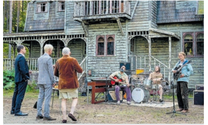
'The last viking' in Filmhuis Mijdrecht.