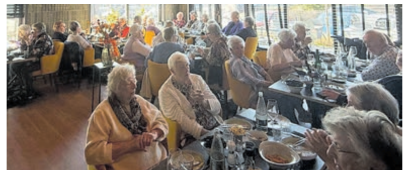
Geslaagd uitje Zonnebloem Mijdrecht.

werd een warme driegangenlunch geserveerd, waarbij volop gelegenheid was voor een praatje. Voor veel deelnemers betekende deze middag een fijne onderbreking van de dagelijkse routine. "Het is heerlijk om er even uit te zijn", vertelde een van hen. De organisatie kijkt tevreden terug op het geslaagde uitje. Dankzij de inzet van de vrijwilligers konden de gasten zorgeloos genieten. Met dit soort activiteiten blijft Zonnebloem Mijdrecht zich inzetten om mensen met elkaar te verbinden en eenzaamheid te verminderen.