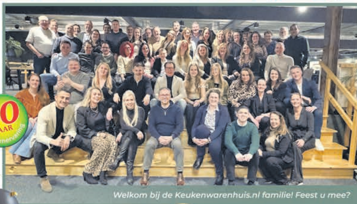
Welkom bij de Keukenwarenhuis.nl familie! Feest u mee?