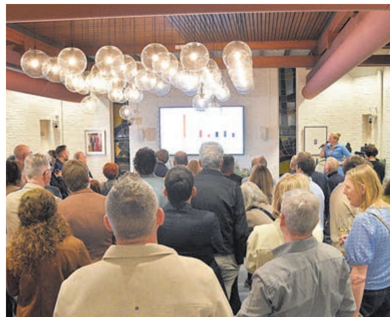
De politieke ontwikkelingen op de voet gevolgd.

De Seniorenpartij verliest licht van 5,2% naar 4,1%. Uiteindelijk hebben er 923 inwoners gestemd op deze partij. De conclusie is dat er 190 inwoners minder op deze partij hebben gestemd. Tijdens het duidingsdebat gaf lijsttrekker Marja Becker nog een sneer naar de 50+ partij, omdat ze een zetel hebben