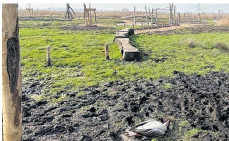
Dode gans in de speeltuin Marickenland.

In Marickenland is afgelopen week de nieuwe speeltuin geopend. De jacht op ganzen ging echter gewoon door. Er zijn zelfs dode ganzen in de nieuwe speeltuin terecht gekomen. "Wij roepen de jagers wederom en met klem op: stop met jagen in het broedseizoen en houd rekening met recreanten en spelende kinderen. Verder willen wij de inwoners van De Ronde Venen waarschuwen: controleer voordat je zelf Marickenland inloopt of je kinderen in de speeltuin laat spelen of er gejaagd wordt in het gebied. Er kan zomaar een dode gans uit de lucht vallen. Wij gaan graag met de jagers in gesprek om eindelijk tot een overstemming te komen en af te spreken dat de verstoring in het broedseizoen stopt. En de omgeving van speeltuinen zou voor jagers sowieso een no-go gebied moeten zijn."