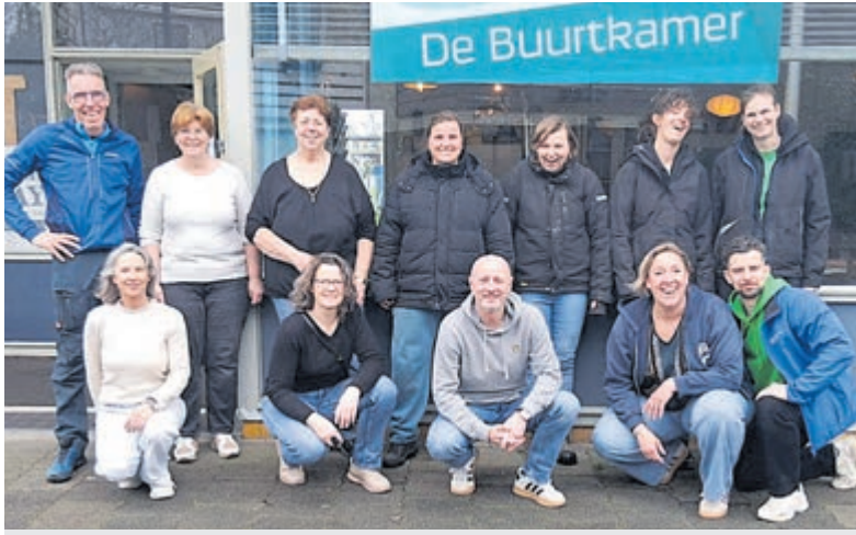
Buurtkamer Mijdrecht opnieuw opgefrist tijdens NLdoet.