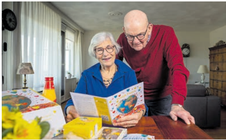
Liefdevolle aandacht en paaspakketje in de regio voor ouderen.