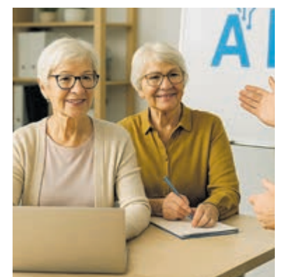
Gratis workshop kunstmatige Intelligentie.

SeniorWeb Mijdrecht is onderdeel van de Bibliotheek Utrechtse Venen.