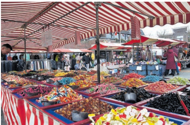
Het aanbod was veelzijdig.

De markt, die al jaren bekendstaat om haar toegankelijke sfeer en sterke regionale aantrekkingskracht, trok een gestage stroom bezoekers die uitgebreid de tijd namen om langs de kramen te struinen.