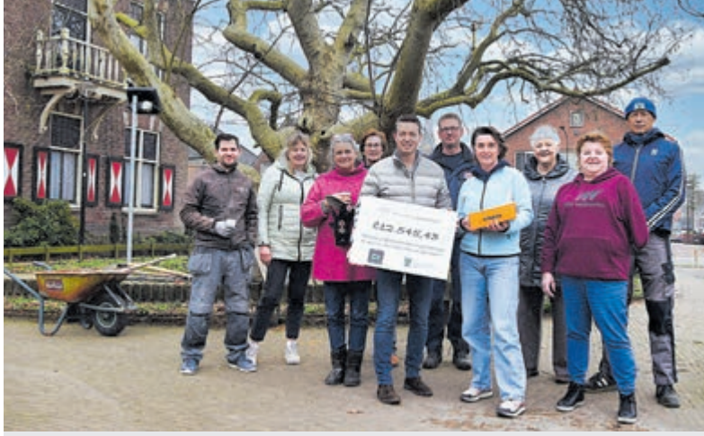
Taart en een cheque van de Provincie.