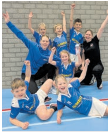
De Vinken J7.

Ook De Vinken J1 draaide een sterk zaalseizoen. In eigen hal werd het kampioenschap veiliggesteld na de overwinning op directe concurrent Viko J2 (13-11). De Vinken nam een voorsprong, keek na rust even tegen een achterstand aan, maar knokte zich knap terug en besliste de wedstrijd in de slotfase. Het kampioenschap kreeg nog extra glans, want De Vinken J1 wist ook de laatste wedstrijd te winnen en bleef daarmee het hele seizoen ongeslagen.