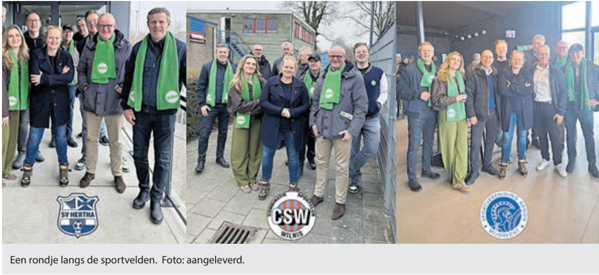
Een rondje langs de sportvelden.