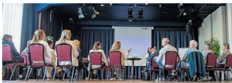
De ondernemersaftrap van het toerisme- en recreatieseeizoen in De Boei.

voor haar persoonlijk was. Ze vertelde dat het voor haar een mooie gelegenheid was om de ondernemers beter te leren kennen, hun verhalen te horen en een goed beeld te krijgen van de kansen en uitdagingen binnen de sector. Er was vervolgens tijdens een netwerkborrel gelegenheid om ideeën uit te wisselen en nieuwe contacten te leggen. Hoewel de bijeenkomst bewust kleinschalig was, leidde het tot betekenisvolle gesprekken en nieuwe samenwerkingsmogelijkheden.