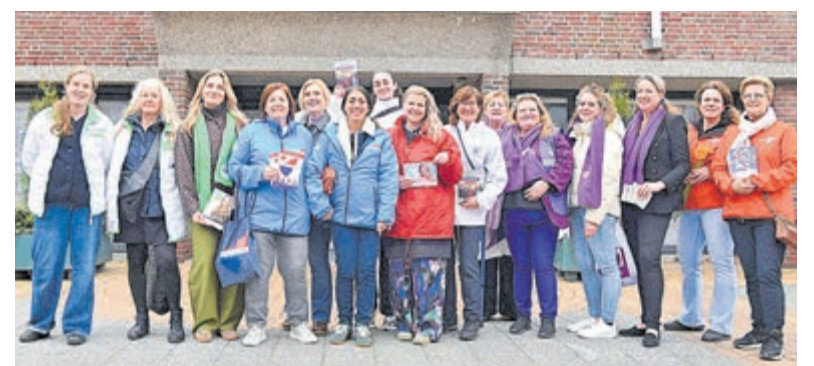
Vrouwen die op de kandidatenlijsten staan voor de gemeenteraadsverkiezingen in De Ronde Venen kwamen zaterdag 7 maart samen voor een gezamenlijke flyeractie.

Wie benieuwd is welke vrouwen in zijn of haar gemeente verkiesbaar zijn voor de gemeenteraad, kan dit bekijken via www.stemopeenvrouw.nl .