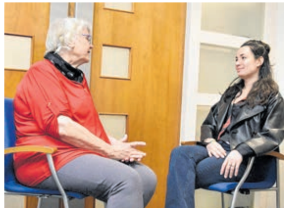
Alleen twee stoelen en de bereidheid om te luisteren zonder mening.