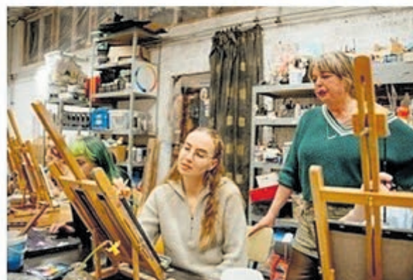
In de Dorpsacademie in Wilnis vond onlangs het eerste Jongerenkunstatelier van het collectief Maakplaats DRV plaats.