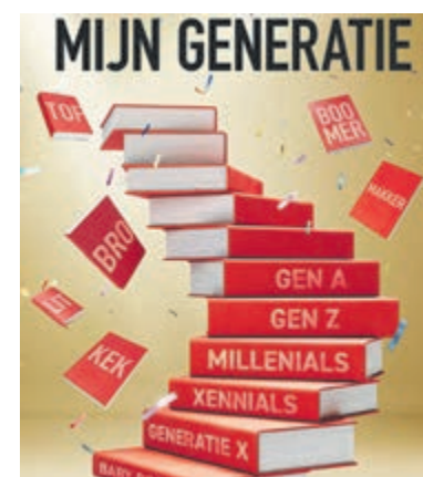
Generatieverschillen en verbinding tijdens de Boekenweek.

Alle activiteiten tijdens de Boekenweek zijn gratis en toegankelijk voor iedereen, ook voor niet-leden. Wel is vooraf aanmelden gewenst. Het volledige programma is te vinden op: www.bibliotheekuv.nl/boekenweek .