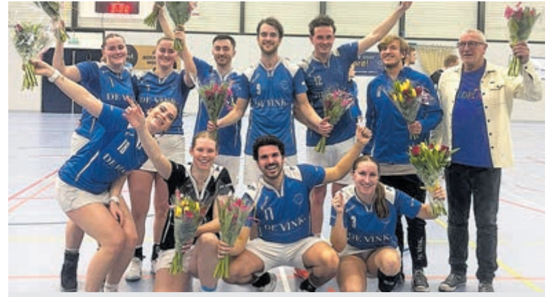
Kampioenschap en promotie voor Vinken 2.

Inwoners kunnen zich voor de poldertochten aanmelden via: www.hetspoorhuis.nl/evenementen .