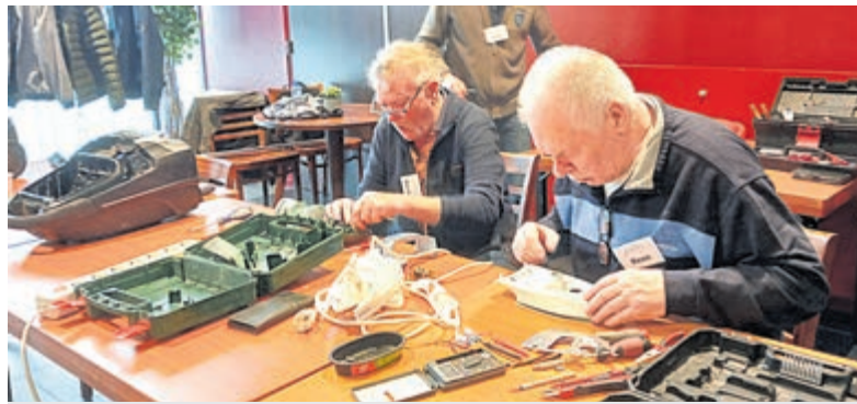
Repair Café Vinkeveen in De Boei.