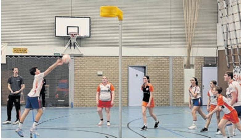
Atlantis J2 overtuigend langs Tweemaal Zes J2.