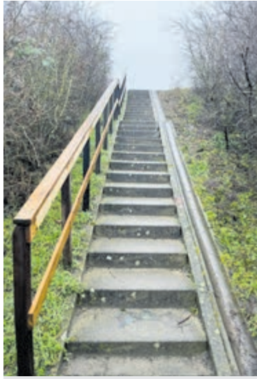
Het heeft even geduurd, maar na zes jaar is het 'project trapleuning' afgerond.

Meer informatie over OBV: https://obv-abcoude-baambrugge.nl .