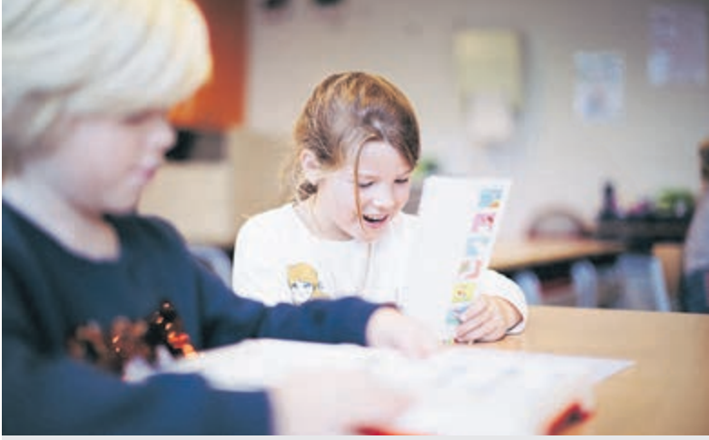
De Pijlstaart, De Willespoort, Wereldwijs en Twister openen donderdag 19 maart hun deuren.