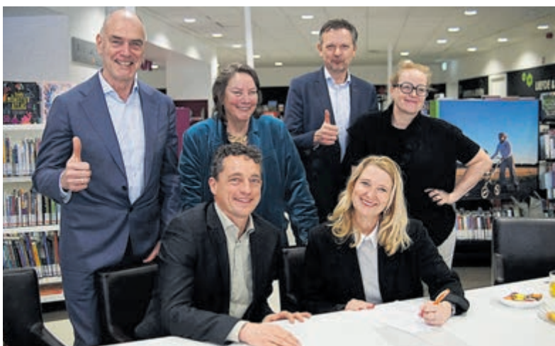
Met de ondertekening is de samenwerking officieel bekrachtigd.

De overeenkomst volgt op de fusie per 1 januari 2025 en legt de basis voor een krachtige regionale samenwerking. Gemeenten en de bibliotheek maken hierin afspraken over hoe zij samen zorgen voor toegankelijke, kwalitatieve en toekomstbestendige Bibliotheekvoorzieningen voor iedere inwoner.