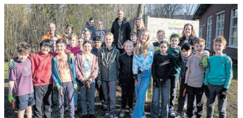
Tijdens de Boomfeestdag zijn schoolkinderen in de Tiny Forests aan de slag gegaan.

In de gemeente zijn drie Tiny Forests. Deze zijn in 2020 en 2021 aangelegd en geadopteerd door De Fontein, Twister en De Windroos en Kidscollege. Scholen kunnen hun leerlingen hier lesgeven en meer leren over de planten die er groeien en de besties die er leven. De Tiny Forests zijn openbaar en voor iedereen toegankelijk om in te spelen en struinen. Tijdens de Boomfeestdag zijn kinderen van een drietal scholen in de Tiny Forests aan de slag gegaan.