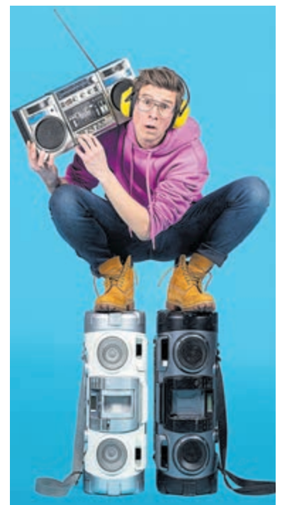
Remy Evers.

Abcoude - Cabaretier Remy Evers treedt zaterdag 21 maart om 20.15 uur op in Theater Mondriaan in Abcoude. Kaarten zijn verkrijgbaar via www.theaterpietmondriaan.nl . Evers onderscheidt zich in zijn erg grappige voorstelling 'Stoorzender' met zijn non-verbale acts. Dit absurdistisch spektakel gaat over een energieke jongen met te veel vrije tijd die verstrikt raakt in een eenzijdige burenruzie. In een wereld waarin iedereen rent, lijkt hij stil te staan. Maar niets is minder waar. Zijn hoofd maakt overuren. In een voorstelling vechten ontroering en humor om voorrang. Terwijl de grenzen tussen fantasie en realiteit elkaar kruisen, gaat de ontwapenende Evers op zoek naar antwoorden. Is de uitvinder van de perforator ook de uitvinder van confetti? En kan een boomfluisteraar ook met papier en laminaat praten? Hij zoekt het uit, op zijn unieke manier.