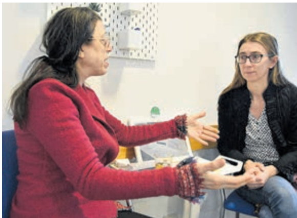
Vooroordelen verminderen door simpelweg met elkaar in gesprek te gaan.

Wie deze dag in Mijdrecht een 'levend boek' leende, liep niet alleen met een verhaal naar buiten. Maar ook met het gevoel dat er nog altijd ruimte is voor échte ontmoeting.