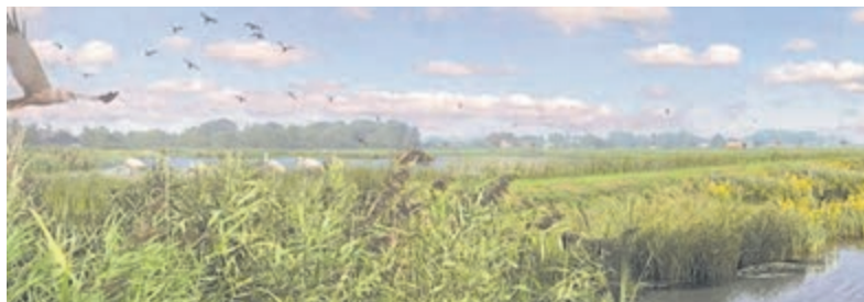
Waar vroeger vooral landbouwgrond het beeld bepaalde, liggen nu uitgestrekte rietvelden, watergangen, jonge moeraszones en slingerende wandelpaden.

tegen Swift 3. Tot 3-3 ging de wedstrijd gelijk op, waarna de thuisploeg langzaam afstand nam en met een 8-5 voorsprong de rust in ging. In de tweede helft bleef het verschil lange tijd rond hetzelfde gaatje schommelen, maar halverwege de tweede helft werd het nog even spannend. Binnen drie minuten kwam Swift van 12-8 terug tot 12-11. De Vinken gaf vervolgens extra gas, herstelde de marge en won uiteindelijk met 15-12. Na het laatste fluitsignaal kon het kampioenschap eindelijk samen met het publiek gevierd worden. Met de titel promoveert De Vinken 2 naar de reserve tweede klasse in de zaal. Daarmee komt de ploeg een stap dichterbij het niveau waarop het op het veld al actief is, waar De Vinken 2 uitkomt in de reserve eerste klasse.