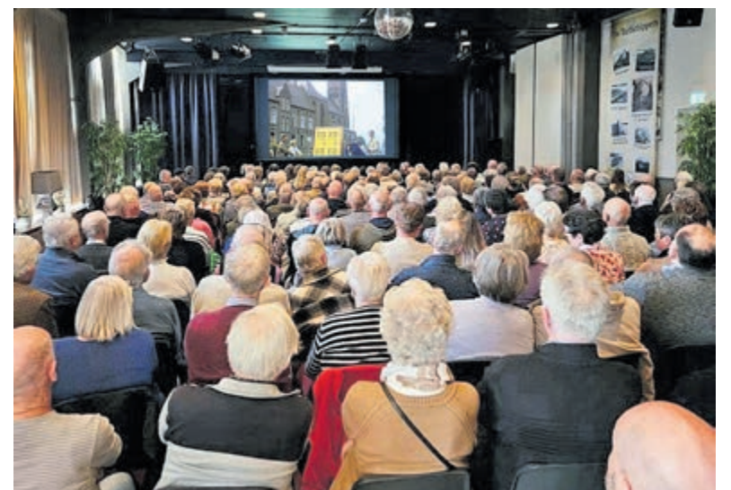
Oude filmbeelden brengen het Vinkeveen van vroeger weer even tot leven.

Zaterdag 21 maart vindt de zevende editie van 'Typisch Nostalgisch Vinkeveen' plaats in Dorpshuis De Boei. Tijdens deze middag worden vijftien nieuwe, nooit eerder vertoonde filmpjes vertoond. De entree bedraagt vijf euro. Kaarten zijn digitaal verkrijgbaar via www.nostalgischvinkeveen.nl en bij de plaatselijke supermarkten in Vinkeveen. De kaartverkoop gaat hard en vol is vol.