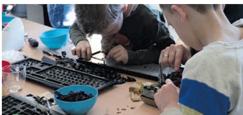
Kinderworkshop 'Uit elkaar, in elkaar'.