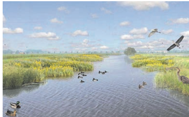
In Marickenland hebben de provincie Utrecht, gemeente De Ronde Venen, Staatsbosbeheer en Waterschap Amstel, Gooi en Vecht 150 hectare weideland omgezet naar moeras en bloemrijk grasland.