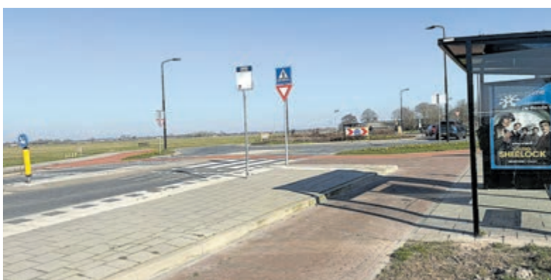
Met de bus naar Noord-Holland 'onbetaalbaar'.

met het openbaar vervoer richting Noord-Holland sinds 1 maart 2026 aanzienlijk duurder is geworden.