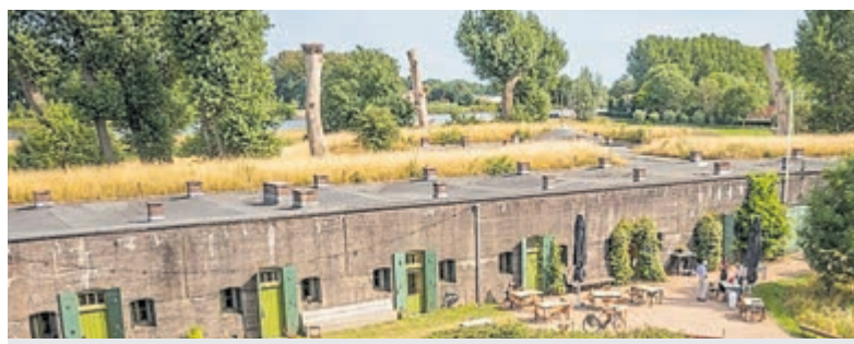
VoorjaarsExpo brengt ambacht tot leven in Fort Nigtevecht.

stap vormgegeven door vrouwenhanden. De organisatie van 'Indeachtenomstreken' richt jaarlijks zes exposities in, telkens met een nadruk op ambachtelijke kwaliteit. Het fort is elk weekend geopend van 10.00 tot 17.00 uur. In de koffiehoeke wacht snoei goeie koffie met huisgemaakte taart en het gebouw is volledig rolstoeltoegankelijk. Elke laatste zondag van de maand is er bovendien om 15.00 uur een Fort-Podium. Meer informatie: www.indeachtenomstreken.nl.