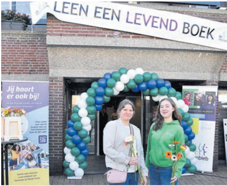
'Leen een levend boek' als uitnodiging.