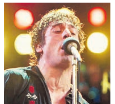
De film 'Springsteen: deliver me from nowhere' in Filmhuis Mijdrecht.

veel aandacht voor sfeer en emotie. Jeremy Allen White (Carmy Berzatto in de hitserie 'The Bear') speelt Springsteen en maakt van hem geen superheld, maar een mens.