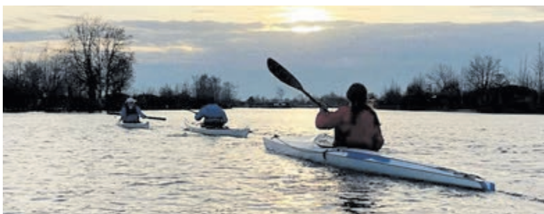
Kanovereniging De Ronde Venen (KVDRV) start dit jaar het 35e vaarseizoen.

KVDRV staat aan de vooravond van een belangrijke ontwikkeling: naar verwachting verhuist de vereniging eind dit jaar naar de locatie van watersportvereniging WVA op Eiland 4. Deze plek biedt meer zichtbaarheid en kansen voor samenwerking, bijvoorbeeld op het gebied van SUP-activiteiten. Bovendien wordt op Eiland 4 jaarlijks de Watersportdag georganiseerd, waar bezoekers verschillende watersporten kunnen uitproberen. De nieuwe locatie kan daardoor een breed publiek aanspreken en nieuwe leden aantrekken. Meer informatie: Willem Goverse, 0297 - 287 743 / goverse@planet.nl of www.kvdrv.nl.