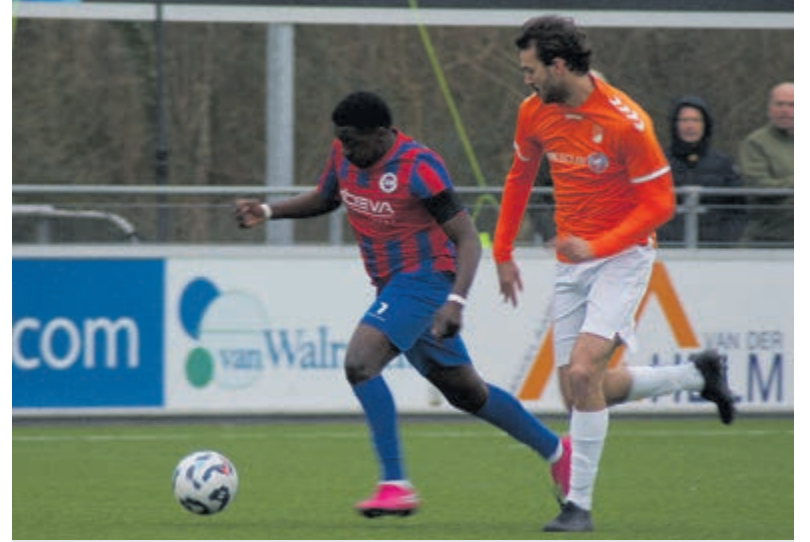
Winst op Nieuwkoop betekent drie op rij voor CSW.

Met deze overwinning heeft Atlantis J2 het kampioenschap in de competitie al veiliggesteld. Volgende week wacht nog een laatste wedstrijd, thuis tegen ESDO uit Kockengen. Die wedstrijd wordt om 12.10 uur gespeeld in sporthal De Phoenix in Mijdrecht. Daar kan Atlantis het seizoen nog extra glans geven, want bij winst kroont het team zich tot ongeslagen kampioen.