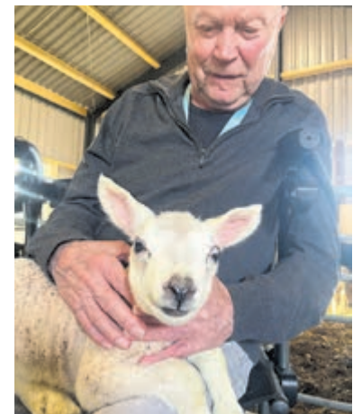
Eerste lammetjes geboren op Zorgboerderij Den Haring.

Wie de lammetjes zelf wil bewonderen, vindt meer informatie op www.zorgboerderijdenharing.nl .