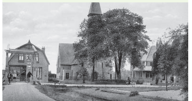
De driespong Baambrugge Zuwe/Herenweg met de Ned. Hervormde Kerk.