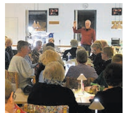
Bingoavond Paraplu trekt volle zaal.

De Ronde Venen - Wat ooit begon met negentien deelnemers, groeide vrijdagavond uit tot een volle zaal bij Stichting Paraplu in Wilnis; 69 bingo-spelers schoven enthousiast aan. "Meer dan 75 mensen kunnen we echt niet veilig kwijt", aldus coördinator Jolanda Engel. Tijdens de avond werden negen rondes gespeeld, met als hoofdprijs een goedgevulde gereedschapskoffer. Zodra de nummers werden omgeroepen, viel de zaal stil. En zoals altijd bleef het spannend wie als eerste "Bingo!" durfde te roepen.