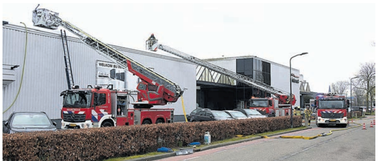
Rook- en waterschade na brand bij Intermat in Mijdrecht.

of op het dak verder kon uitbreiden. Wateraanvoer vanaf diverse punten lag klaar, een tweede ladderwagen van brandweer Amstelveen werd opgesteld en ook het droneteam van de brandweer kwam ter plaatse en volgde met warmtebeelden vanuit de lucht nauwkeurig de situatie. Na het nodige slijp en zaagwerk op dak werd de kern van het vuur bereikt en afgeblust. De Constructieweg was geruime tijd gedeeltelijk afgesloten. Nader onderzoek zal moeten uitwijzen hoe de brand is ontstaan, maar vuurdoorslag bij het dakdekken ligt voor de hand. Binnen is forse rook- en waterschade ontstaan.