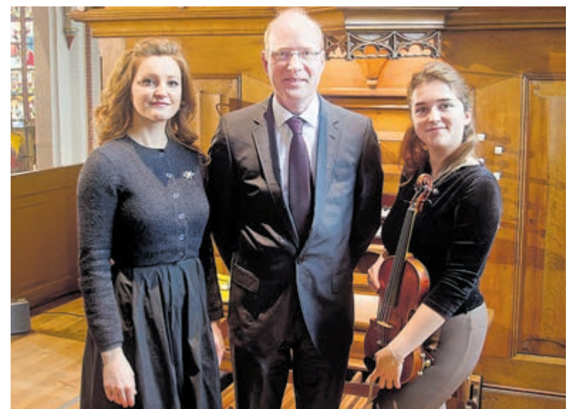
Oorstrelende passieklanken van Bach tot Mozart.

reis. Naast bekende en geliefde vocale werken van Mozart en Händel klinkt sprankelende orgelmuziek, evenals muziek uit de passietijd: de aria's van Bach uit de Matteuspassie en zijn Magnificat vormen in dit programma bijzondere muzikale hoogtepunten. De kerk is open vanaf 14.30 uur. Het concert is vrij toegankelijk en na afloop is iedereen welkom in Zorghuis Tante Bep – voorheen de S.e.T. Residentie – naast de kerk om na te praten met de musici en met elkaar. De deurcollecte is bestemd voor de Zonnebloem, die zorgt voor vakantie, een dagje uit, een rolstoelauto, bezoek aan huis voor mensen met een lichamelijke beperking. Zie ook www.zondagmiddagconcerten.com .