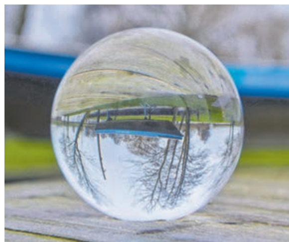
Waar is deze toverbalfoto gemaakt?