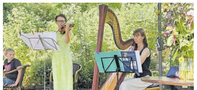
Dit jaar organiseert Cultuurpunt Ronde Venen zaterdag 27 juni opnieuw Klink-Klaar.

Reacties insturen voor 30 maart naar jessicaerdtstieck@gmail.com . De organisatie is in handen van Stichting Cultuurpunt Ronde Venen: www.cultuurpuntrondevenen.nl .