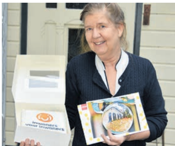
Taart voor mevrouw Burger als winnares.

gelegenheid om na te praten bij koffie of thee. Elk jaar wordt in een ander land de liturgie voorbereid. Dit jaar door christenvrouwen van Nigeria. Zij kozen als thema 'Kom, ik zal jullie rust geven'. Meer informatie: www.wereldgebedsdag.nl .