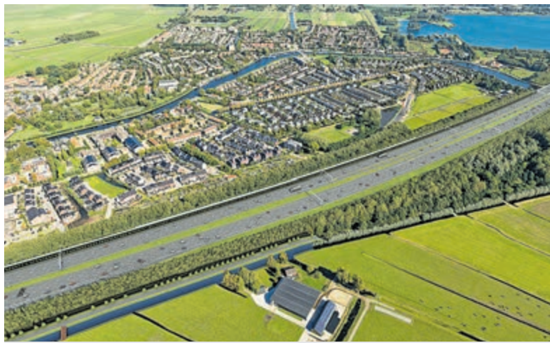
Extra rijstroken A9 geopend: verlichting voor forenzen Uithoorn en De Ronde Venen.

Regio - Na afgelopen weekend te zijn afgesloten vanwege werkzaamheden is de A9 ook komend weekend dicht in beide richtingen tussen knooppunt Badhoevedorp en knooppunt Holendrecht. De extra reistijd kan oplopen tot meer dan 30 minuten. Er gelden omleidingen voor alle verkeer. Van vrijdag 6 maart 20.00 uur tot maandag 9 maart 05.00 uur is de A9 vanaf oprit 5 Stadshart richting Badhoevedorp wel open. Ook de verbindingsweg van de A4 hoofdrijbaan links vanuit Schiphol naar de A9 hoofdrijbaan rechts richting Haarlem is dicht. Het verkeer voor de A9 wordt omgeleid via de A2, A10 en A4.