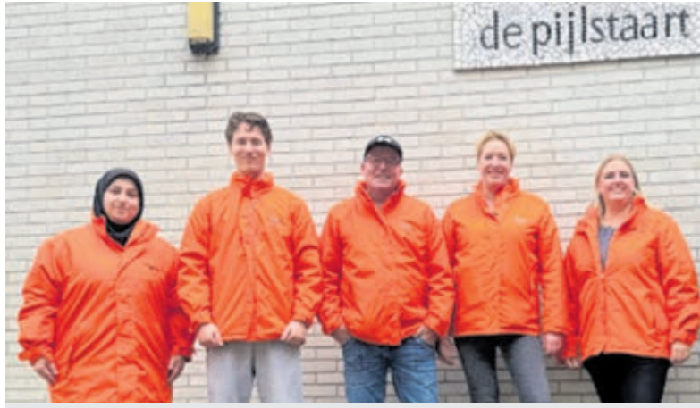
OBS De Pijlstaart zoekt enthousiaste vrijwilligers die affiniteit hebben met kinderen in de basisschoolleeftijd.