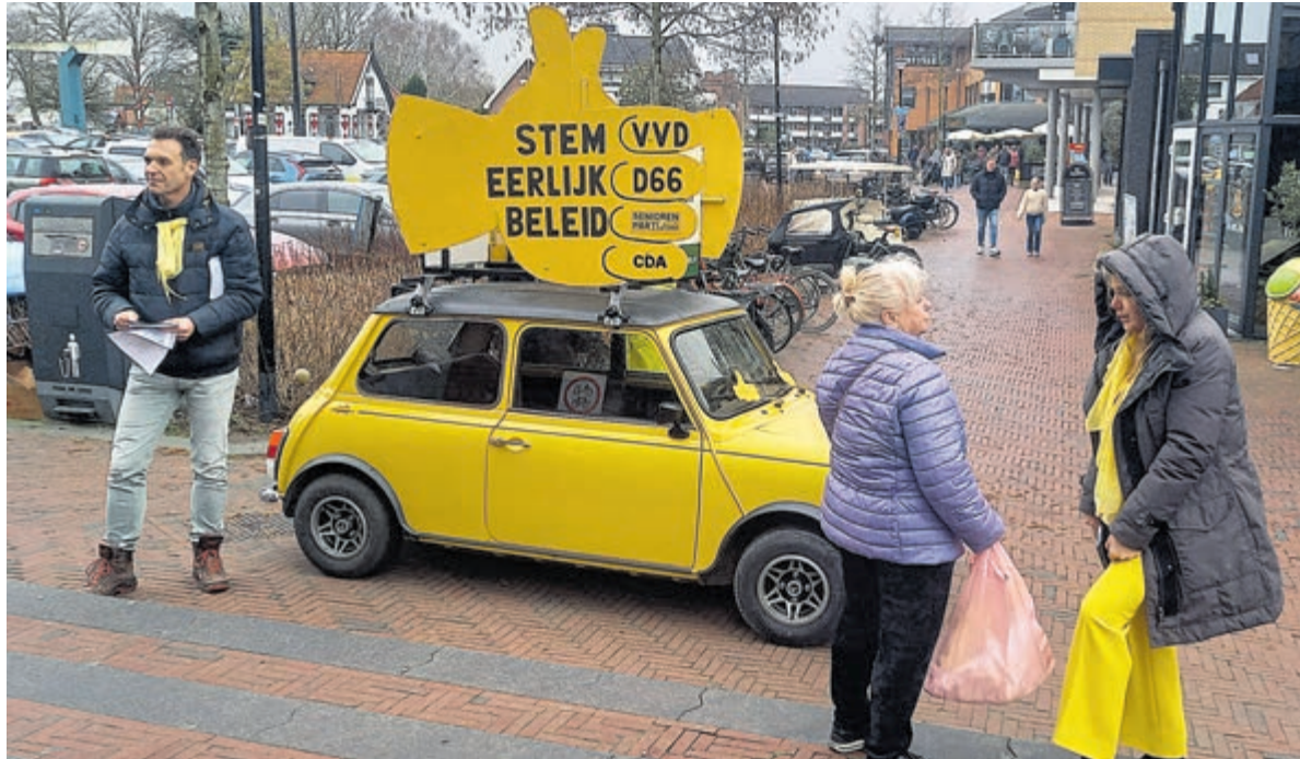
In Mijdrecht stond bij Winkelcentrum De Lindeboom een opvallend geel autootje, een actie van inwoners die zijn aangesloten bij het 'Bezwaarmakers Collectief Vinkeveense Plassen'.