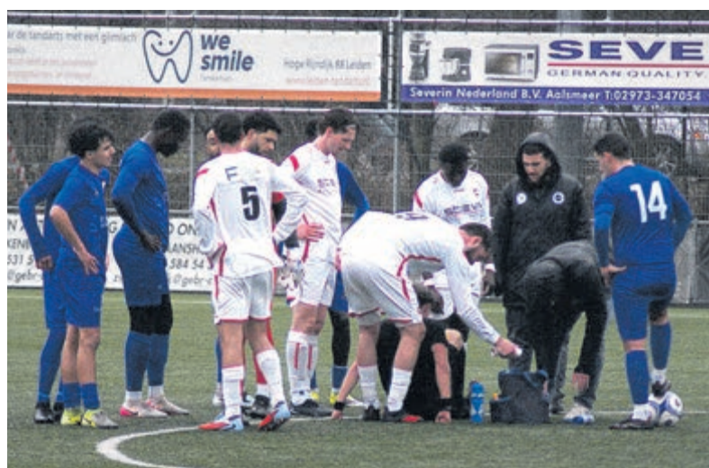
Duel tegen LFC-CSW gestaakt na een blessure van de scheidsrechter.

De uitslagen van wedstrijden op andere velden waren gunstig voor de Wilnissers, met als meest verrassend het verlies van koploper Jong Holland op eigen veld. SCPB 22 was met 4-5 de betere. Vanzelfsprekend zal CSW de achterstallige wedstrijden wel eerst zelf moeten winnen om bovenin te blijven meedraaien. Eerste hindernis hierbij is Nieuwkoop. Dit duel in Wilnis start zaterdag zoals gebruikelijk om 14.30 uur. Het team waartegen de Boys van de Dijk in de uitwedstrijd 0-3 wist te winnen, is de laatste weken in goeden doen, dus opnieuw zullen de CSW-ers vol aan de bak moeten.