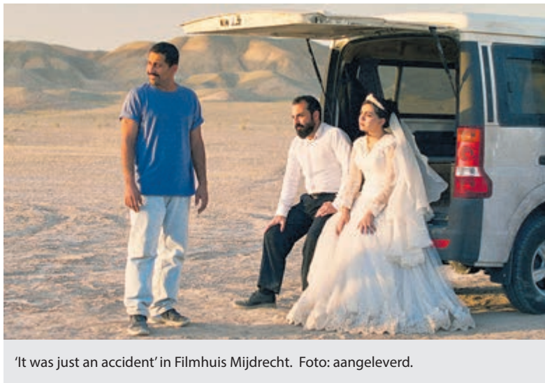
'It was just an accident' in Filmhuis Mijdrecht.