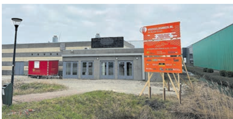
De bouwwerkzaamheden op de nieuwe locatie Voedselbank De Ronde Venen zijn hervat.

De financiering voor de nieuwe locatie is grotendeels rond. Tegelijkertijd hebben stijgende bouwkosten ertoe geleid, dat een aantal additionele onderdelen voorlopig is uitgesteld. Aanvullende steun blijft daarom van harte welkom. Bedrijven, organisaties en inwoners kunnen op verschillende manieren bijdragen, zowel financieel, als met materialen, producten en expertise. Van den Bruinhorst: "Zo zetten we de volgende stappen om de nieuwe locatie verder af te bouwen en optimaal in te richten. De Voedselbank kijkt uit naar de opening van de nieuwe locatie en spreekt grote waardering uit voor iedereen die zich tot nu toe heeft ingezet." Meer informatie: www.voedselbankderondevenen.nl .