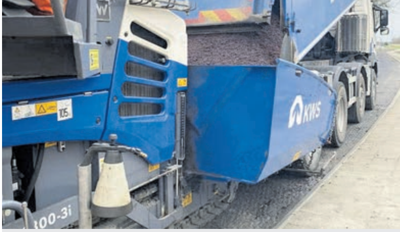
De Provincie Utrecht bouwt van maandag 9 maart tot en met vrijdag 24 april de kruising van de N212 en de N405 in Kamerik om tot rotonde.