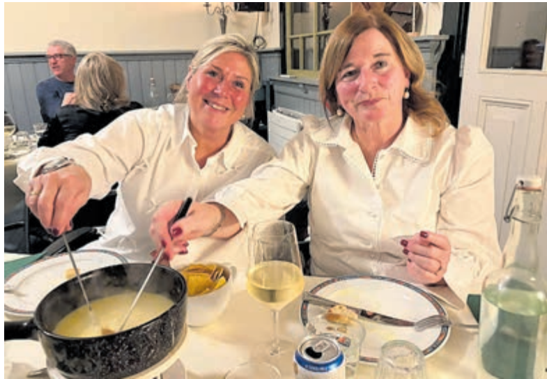
Genieten van de kaasfondue.

Vinkeveen – Afgelopen weekend vond in het Spoorhuis in Vinkeveen opnieuw een warme, volledig uitverkochte editie plaats van de Demmerikse kaasfondueavond, een jaarlijkse traditie waarin bezoekers werden ondergedompeld in de smaken en verhalen van het buurtschap Demmerik. Het evenement trok liefhebbers van lokaal eten, cultuur en historie.