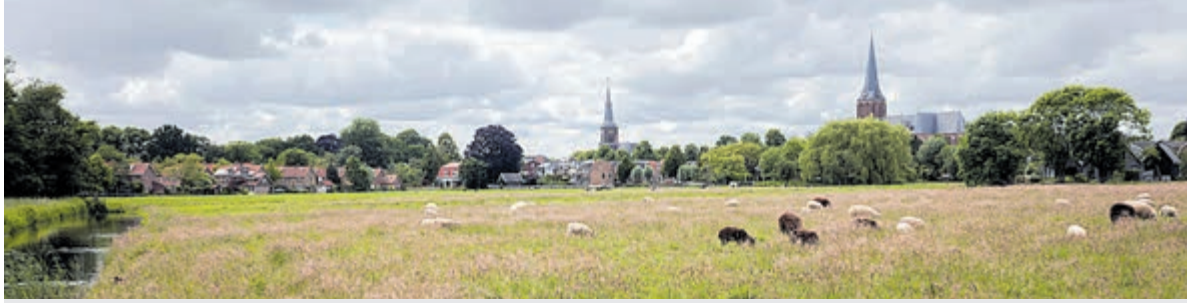
De skyline, gemaakt op 29 mei 2022 vanaf het voetpad bij de Witte Dame richting Fort Abcoude.