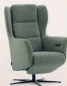
Sta-op stoel Riale