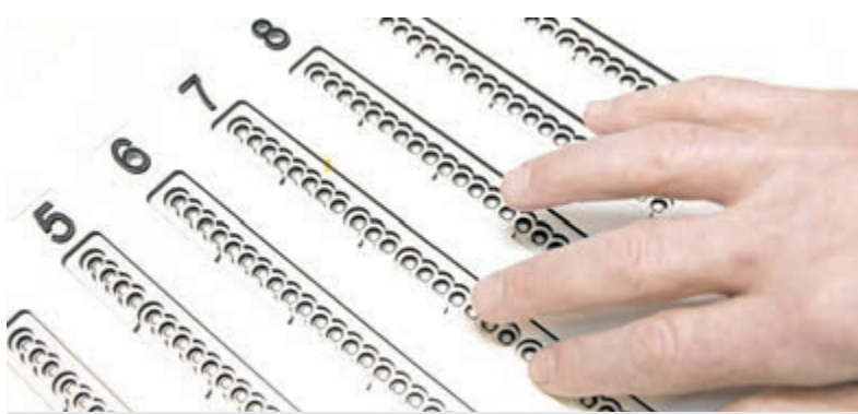
De stemmal maakt zelfstandig stemmen mogelijk voor meer inwoners.

Het stembiljet wordt in de mal gelegd, waarna de kiezer via voelbare markeringen en audio-ondersteuning van een soundbox precies kan bepalen waar de gewenste kandidaat staat en het juiste vakje rood kan kleuren. De stemmal is niet alleen bedoeld voor mensen met een visuele beperking; ook inwoners met dyslexie, een beperkte leesvaardigheid of problemen met handmotoriek kunnen ermee uit de voeten. In De Ronde Venen is de voorziening tijdens deze verkiezingen uitsluitend beschikbaar in het stembureau op het gemeentehuis. De gemeente hoopt hiermee drempels weg te nemen en stemmen voor meer inwoners toegankelijk te maken.