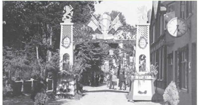
De toenmalige Kerkstraat in Abcoude.