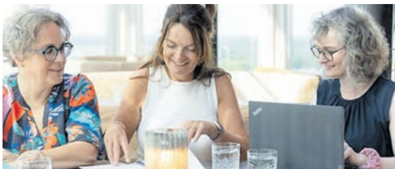
Bestuurders welkom bij De Zonnebloem.