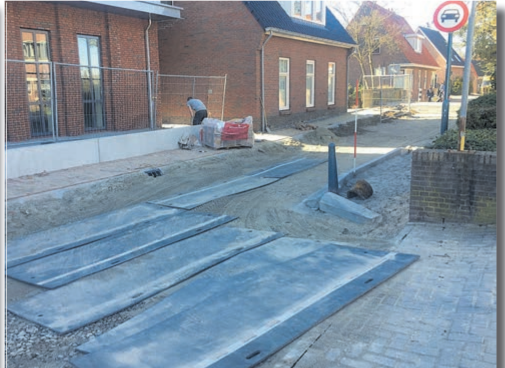
Maandag was de toegang tot de Kom weer aardig te doen