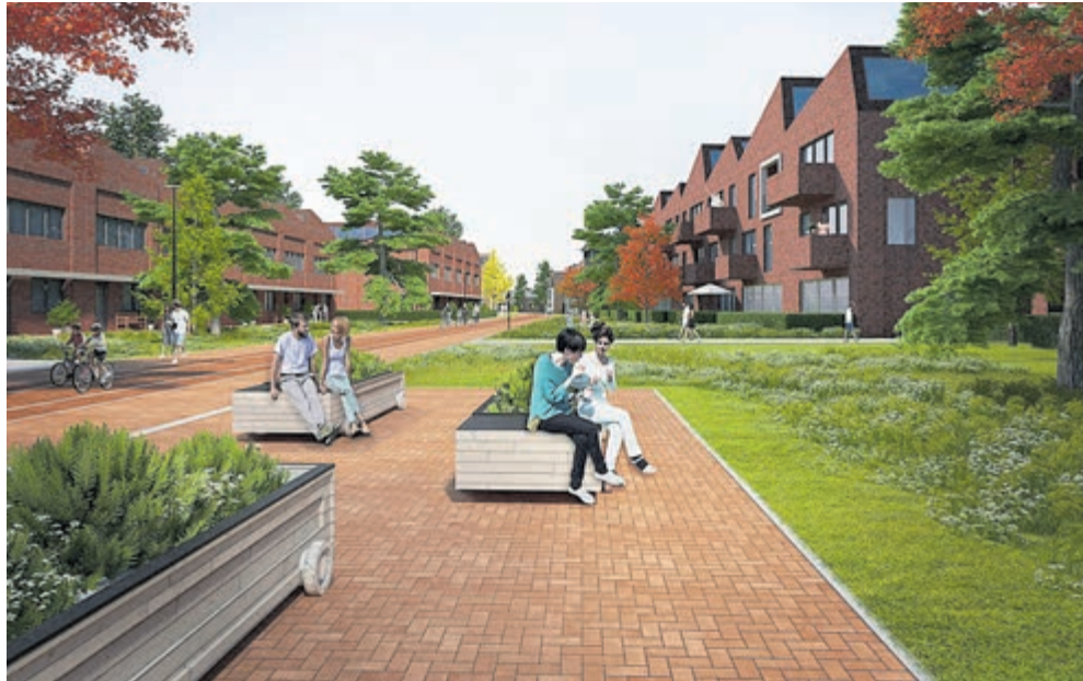
Een impressie van de nieuwe wijk Spoorpark in Mijdrecht.

Mijdrecht – Op 1 maart is er weer de maandelijkse bingo van de Lijnkijkers, de bingo vindt plaats in de kantine van sportvereniging Argon. De hoofdprijs deze maand is een wasdroger. Zaal open 19:00 uur aanvang bingo 20:00 uur. Het eerste kopje koffie of thee is gratis. Met meedoen steunt u de jeugd van Argon, dit kunt u natuurlijk ook doen door uw oud papier neer te zetten bij de container op het Argon parkeerterrein.