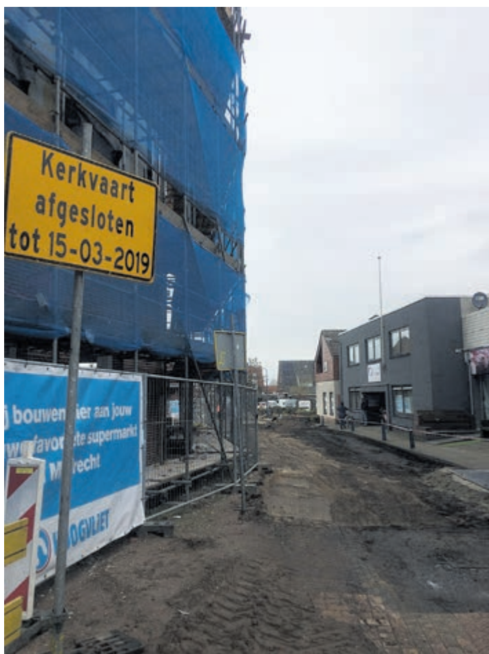
Het duurt maar liefst tot 15 maart

Nu is het voor de ouderen wel een aardig eind omlopen om in het dorp te komen, maar het kan en zoals één van de bewoonster zei: "Ach nu lukt het en ik zeg altijd maar, het moet eerst een rommel worden voor het opknapt".