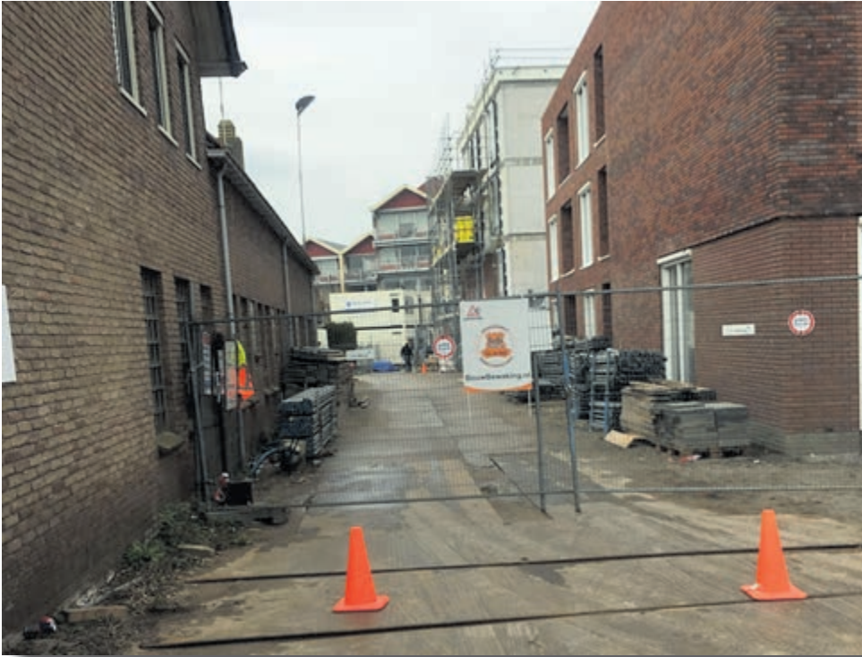
Als dit geen bouwterrein was geweest was dit de kortste route geweest