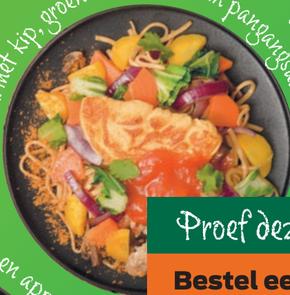
Bani met kip, groenten en omelet in pangarous