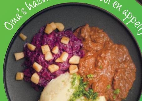
Oma's hachee met rodekool en appeltjes