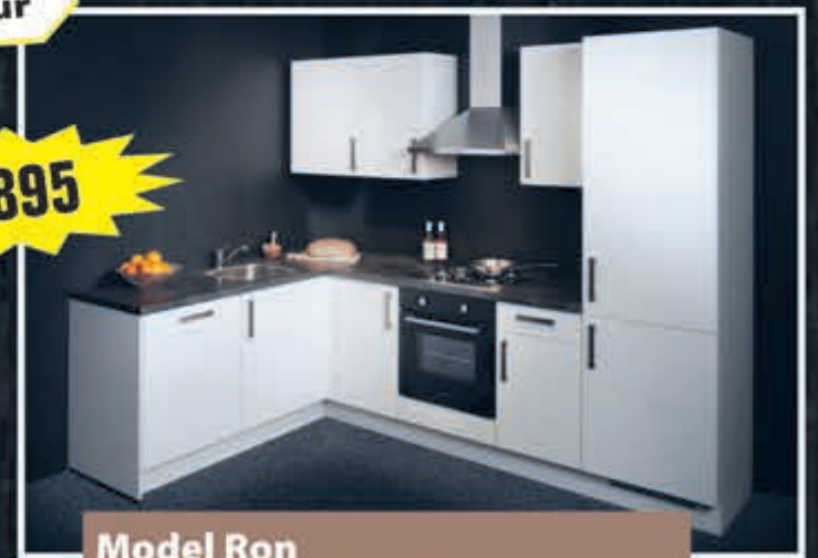
Model Ron zijdeglans witte keuken uit voorraad, 187 x 275 cm.

De rechte keuken heeft een combimagnetron terwijl de hoekkeuken een oven heeft. Beide modellen hebben een kookplaat, vaatwasser, brede blokschouw, koelkast, aanrechtblad, spoelbak en kraan. Met 5 jaar garantie. Aanpassingen mogelijk!