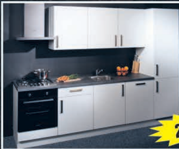
Model Jack zijdeglans witte keuken uit voorraad, 270 cm.

Supercompleet met oven, kookplaat, vaatwasser, brede blokschouw, koelkast/vriezer, aanrechtblad, spoelbak en kraan. Met 5 jaar garantie. Aanpassingen mogelijk!