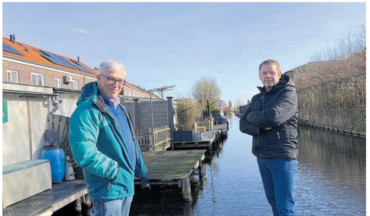
Anco en Roger: meer dan genoeg ruimte om het bestemmingsplan aan te passen!