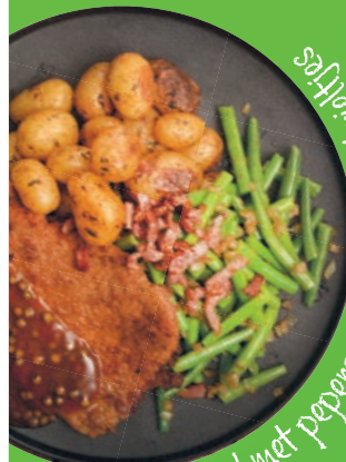
Schmitzel met peppersaus, boontjes en sesamkroketjes

Zodat jij moeiteloos je vitamines binnenkrijgt.