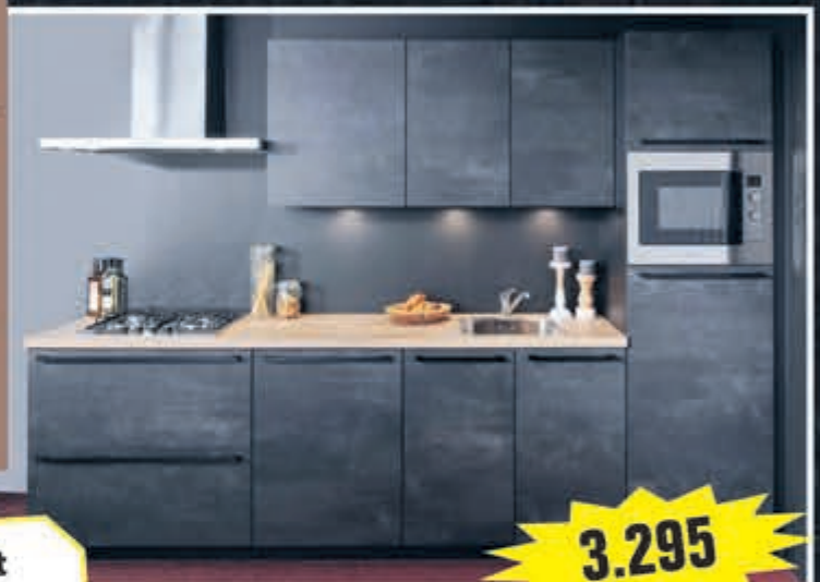
Model Levi Speed Beton uit voorraad, 300 cm.

Supercompleet met combimagnetron, kookplaat, vaatwasser, brede blokschouw, koelkast, aanrechtblad, spoelbak en kraan. Met 5 jaar garantie. Aanpassingen mogelijk!