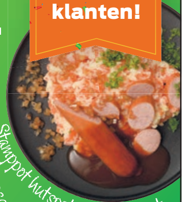
Stampot hutspot met rookworst