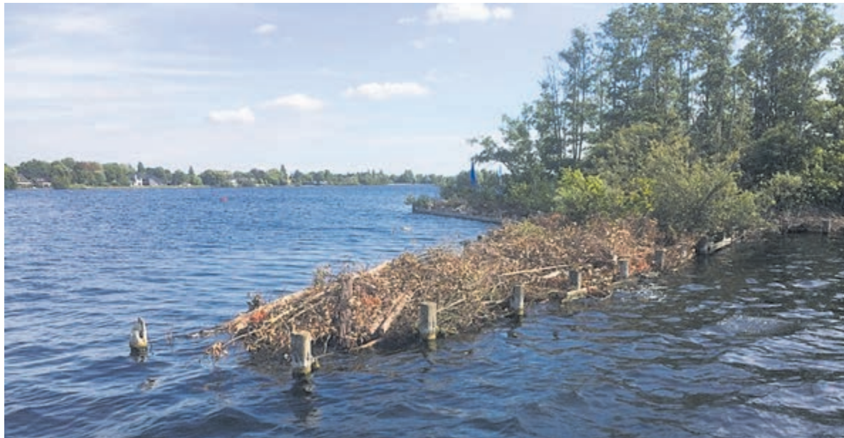
Gemeente en provincie gaan samenwerken aan bestemmingsplan Plassengebied