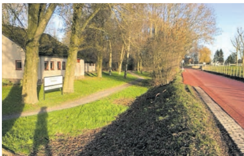
De Vuurlijn bij Thamen