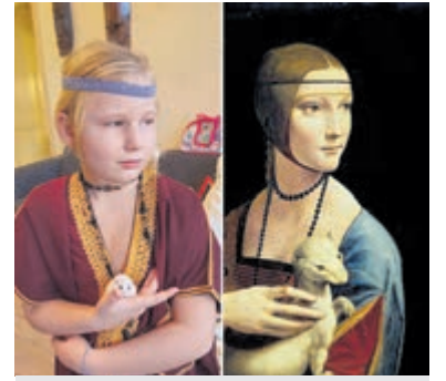
De dame met de Hermelijn