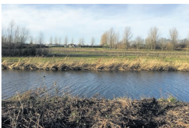
De locatie het Legmeerbos