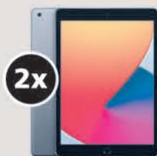
APPLE iPad 10.2" 32 GB WiFi- Spacegrijs t.w.v. € 389,-