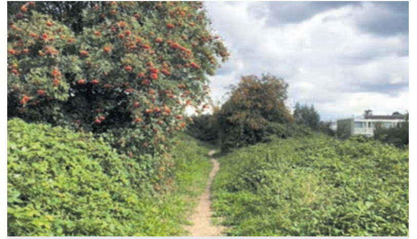
De Spoordijk voor de kap

De Vuurlijn is net ingericht als fietsstraat waar heel veel kinderen gebruik van maken. Met bebouwing zal het aantal auto's toenemen, waardoor de verkeersveiligheid onder druk komt te staan. Ook moet er meer aandacht zijn voor de waarde