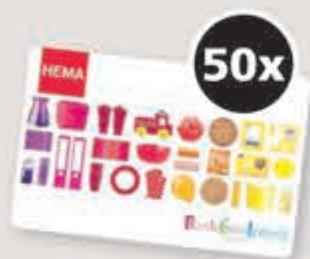
HEMA cadeaukaart t.w.v. € 20,-