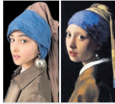
Meisje met de parel