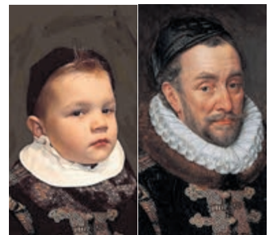
Willem van Oranje