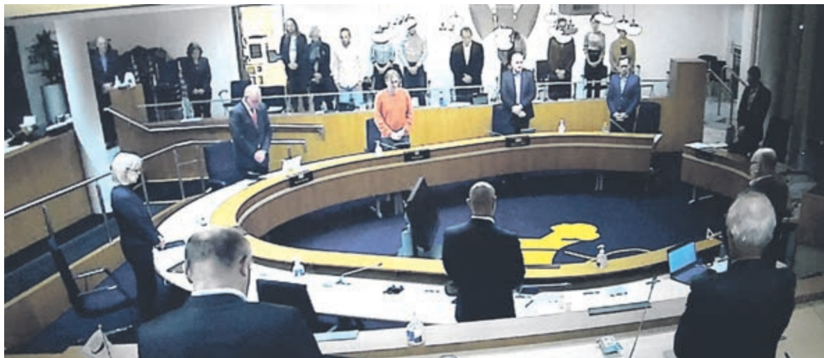
Op bijgaande foto een deel van de aanwezige donderdagavond jl.