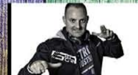
MR MILOW (TMF)