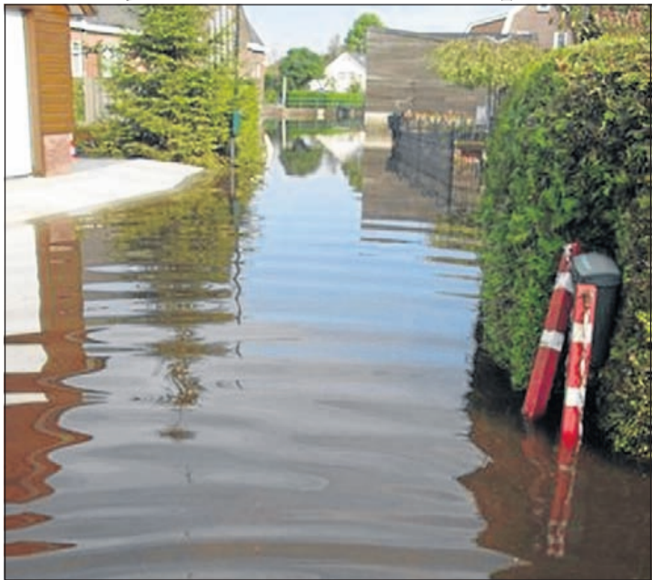
Ook in Vinkeveen was er erg veel wateroverlast voor de bewoners. Sommigen konden hun woning niet met droge voeten in of uit.

De Ronde Venen - Vorige week vrijdag begon het al te regenen, tot in de ochtend van zaterdag. Maar op zaterdagavond ging het nog veel harder regenen, tot en met de zondag. Omdat de gemeente De Ronde Venen enkele diepe (lage) polders heeft is het belangrijk te weten, hoe die regenopvang is geregeld, waar de pijnpunten liggen en waar de oplossing kan zijn.