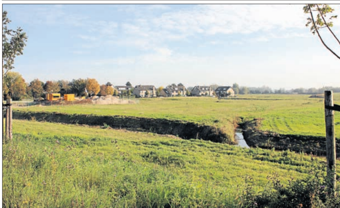
Ook dit stuk grond in Abcoude waar gemeente De Ronde Venen nog eens hoopt te bouwen heeft te maken met de snelheid