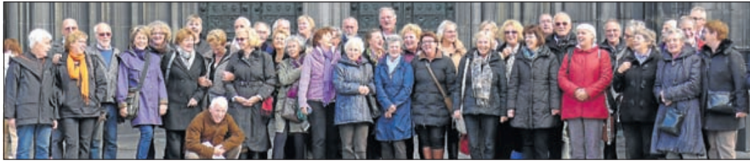
Regiokoor De Ronde Venen voor hoofdingang van de Dom in Keulen