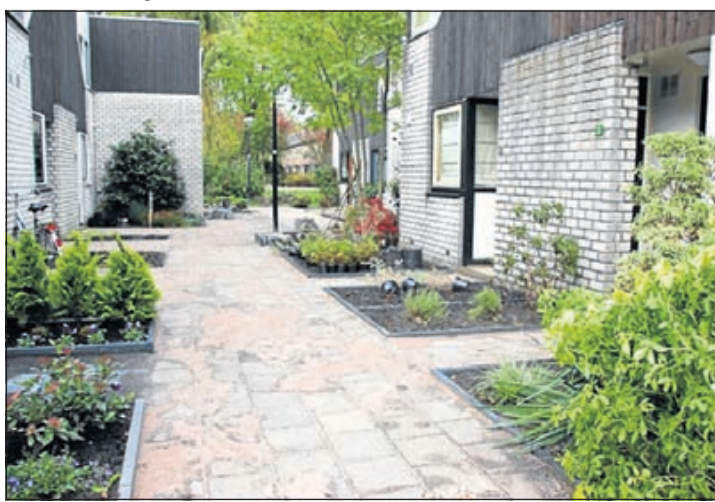
Na de burendag

ners van de Penning in Mijdrecht de koppen bij elkaar gestoken om hun omgeving eens goed aan te pakken. Inmiddels zijn ze nagenoeg klaar met de binnenplaats. Nog niet alle bewoners zijn toegekomen aan het inrichten van hun nieuw verkregen voortuin, maar dat zal niet lang meer op zich laten wachten. Er is een middenpad aangelegd en alle woningen hebben nu een voortuin van 2.10 diep. Alle grote struiken en bomen zijn weggehaald, de tegels zijn eruit gehaald, schoongespoeld en opnieuw gelegd. De binnenplaats is ca. 10 cm opgehoogd. De bewoners: "Wij als buurtbewoners zijn enorm blij met de vernieuwde, lichte binnenplaats en verheugen ons op volgend jaar voorjaar/zomer. Want Burendag heeft er ook voor gezorgd dat we elkaar beter hebben leren kennen en de sfeer onderling is erg gezellig. Dus op naar de eerste buurtbarbeque op onze nieuwe binnenplaats."