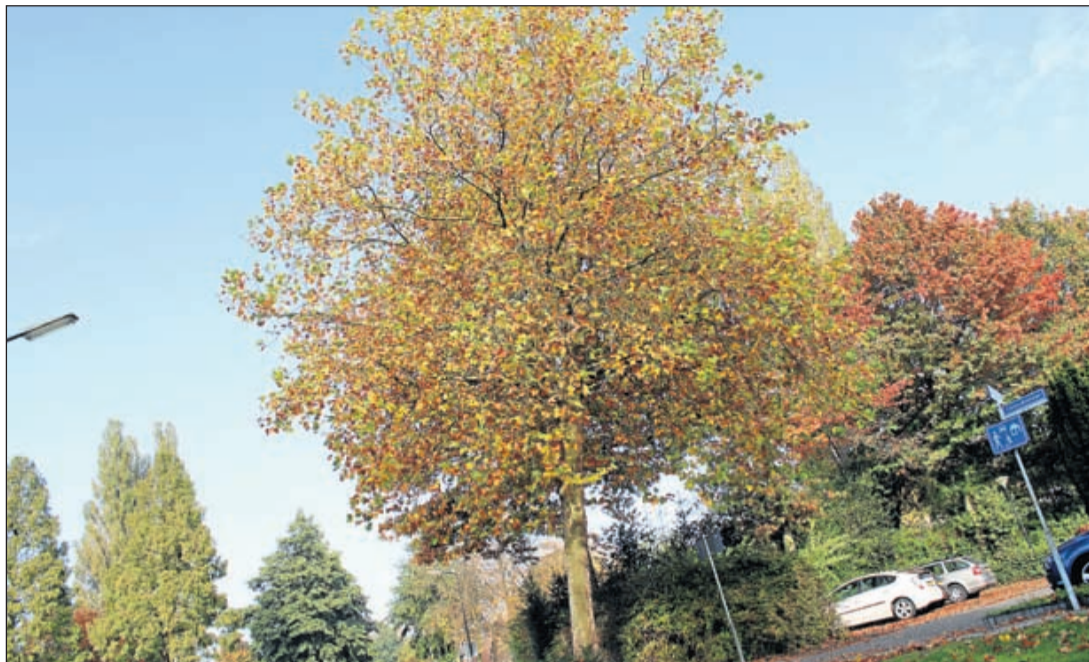
Deze plataan staat aan de Coninckmeer in Vinkeveen en kan zo naar de Grutto