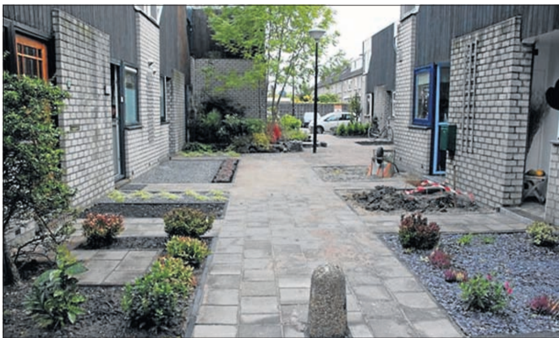
Voor de burendag

Viribus Unitis zal te zien en te horen zijn komende zaterdag 27 oktober in het dorpscentrum Willisstee, waar zij mede dankzij het Rabo Dichtbifonds, garant staat voor een muzikaal spektakel dat het thema 'muzikale grootheden' heeft meegekregen. Composities van Bach, Beethoven, Mozart en Verdi maar ook filmmuziek en songs van Queen en Borsato passeren de revue. De muziek wordt versterkt met zang door het ROM-koor en dans door jazz- en balletschool Nicole.