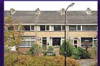
VINKEVEEN Waterhoenlaan 43