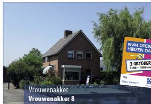
Vrouwenakker Vrouwenakker 8