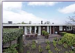
WILNIS Swaenebloem 4