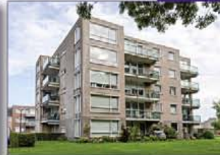
MIJDRECHT Weegbree 73