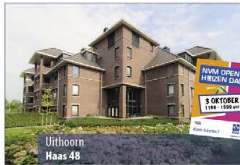
Uithoorn Haas 48