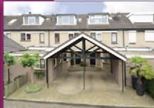
VINKEVEEN Groenland 19