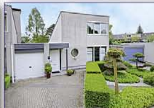
DE MEERN Oosterlengte 34