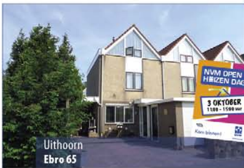
Uithoorn Ebro 65