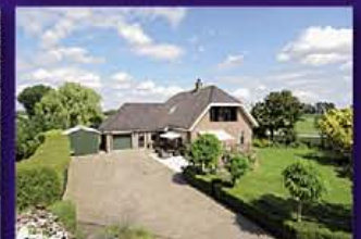
WILNIS Gagelweg 2