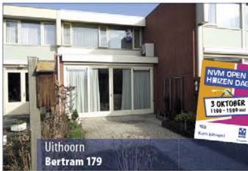
Uithoorn Bertram 179