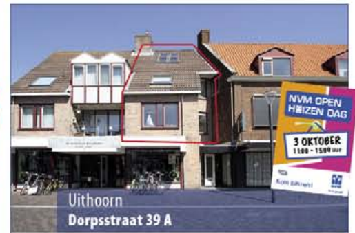
Uithoorn Dorpsstraat 39 A