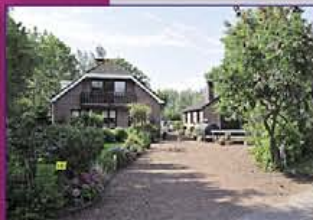
NIEUWTER AA Demmeriksekade 14