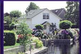
VINKEVEEN Plaswijk 50