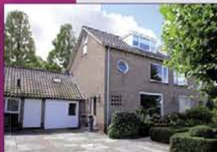
VINKEVEEN Kievitslaan 101