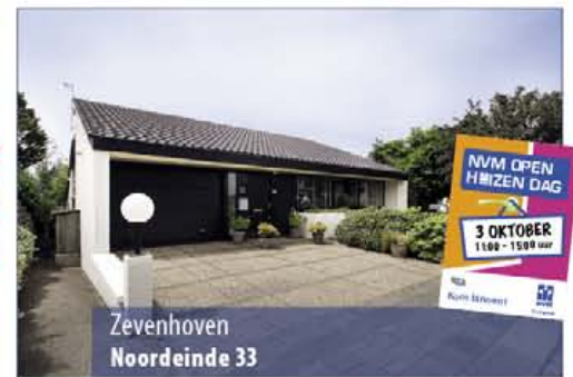
Zevenhoven Noordeinde 33