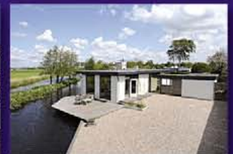
WILNIS Watertuin 21