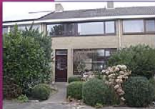
VINKEVEEN Meerkoetlaan 12