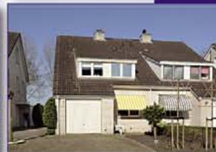
WILNIS Timotheegras 25