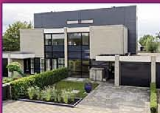
VINKEVEEN Bloemhaven 2