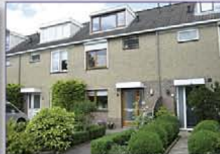
MIJDRECHT Toermalijn 22