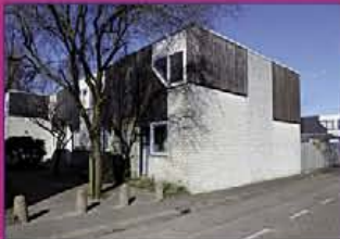
MIJDRECHT Penning 14