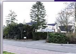
VROUWENAKKER Vrouwenakker 13