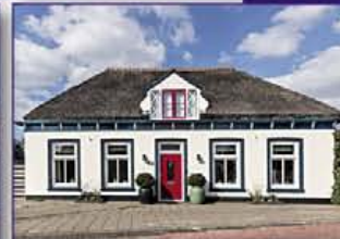
WILNIS Herenweg 4