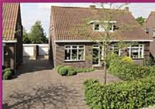
MIJDRECHT Bozenhoven 124