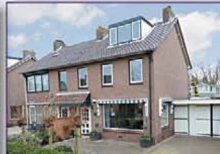
MIJDRECHT Bisschop Koenraadstr. 29