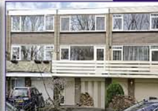
VINKEVEEN Scholeksterlaan 88