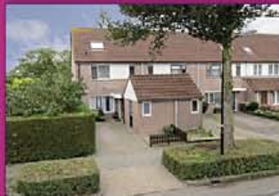
MIJDRECHT Roerdomp 29