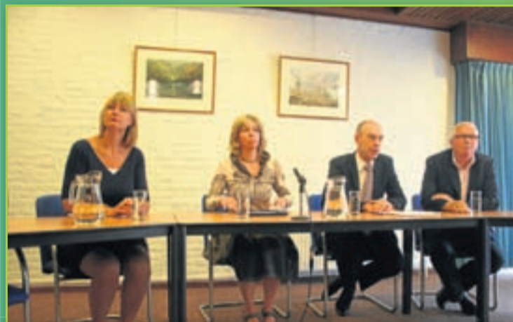
Emotie alom bij uiteengevallen college