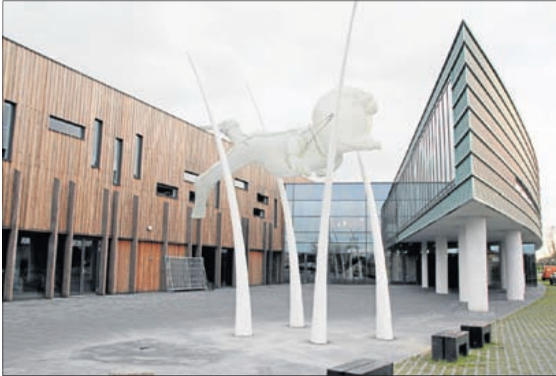
In het duurbetaalde Veenweidebad blijken sommige faciliteiten nu al onrendabel. Op zaterdag gesloten voor zwemliefhebbers!

De Ronde Venen - Sinds 15 augustus kan er weer (landelijk) gestemd worden wat het beste, mooiste en leukste zwembad van Nederland in 2011 is. De verkiezing draait goeddeels op de waardering die bezoekers voor hun favoriete zwembad tentoonspreiden. Daardoor maken kleinere of al wat oudere zwembaden net zoveel kans als grote of nieuwe zwembaden. Zwemliefhebbers kunnen via de website www.zwembadvanhetjaar.nl cijfers geven voor onder meer klantvriendelijkheid, prijs/kwaliteitverhouding, hygiëne en sfeer/ambiance. Per provincie zijn er Awards te winnen voor zwembaden en mooie prijzen voor degenen die stemmen. Daarbij maakt men kans op een reis naar een van de mooiste zwembaden van de wereld in IJsland. Het Veenweidebad in De Ronde Venen neemt ook deel aan deze verkiezing en dingt aldus mee naar de Provincie Award voor provincie Utrecht en misschien wel meer. Althans, dat is het doel. De provinciewinnaars met de hoogste gemiddelde scores dingen mee naar de landelijke Gouden Zwembad Award. Tot en met 29 oktober kan er gestemd worden op het favoriete zwembad waarbij minimaal 100 stemmen nodig zijn om kans te maken een Zwembad Award te kunnen winnen. De Zwembad van het Jaar Verkiezing is een initiatief van