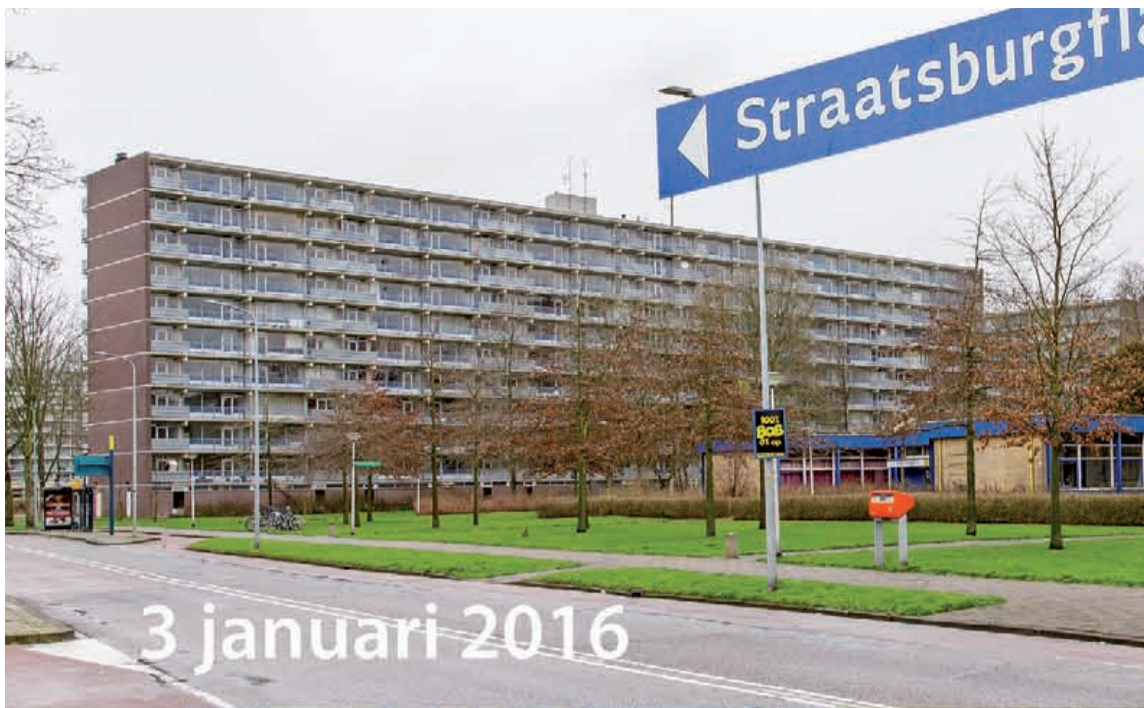
3 januari 2016