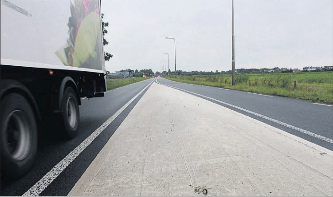
Inwoners van de Ronde Venen kunnen hun mening digitaal geven op www.verbreidingn201.nl

Vinkeveen - Woensdagmiddag rond 17.00 uur zagen omstanders een lichaam drijven in de Vinkeveense Plassen bij de oever aan het Achterbos. Zij sprongen te water, maar de redding kwam te laat. De vrouw bleek reeds overleden te zijn. De politie is direct een onderzoek gestart maar verklaarde al snel dat zij geen enkele aanwezig heeft dat het hier om een misdrijf zou gaan. Ook was de identiteit van de 69-jarige vrouw snel bekend, zodat de familie kon worden ingelicht over dit noodlottig ongeval.