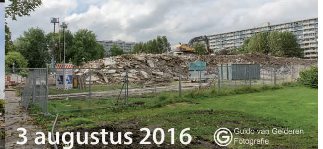
3 augustus 2016