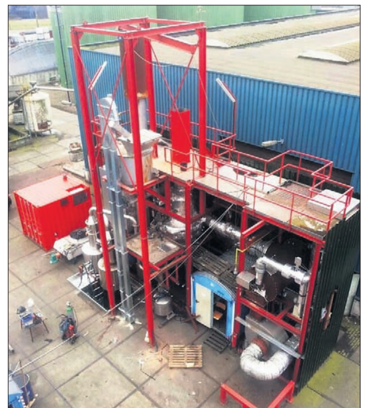
De bio-installatie wordt onzichtbaar in een loods ingebouwd

worden. Zouden die paar extra verkeersbewegingen naar mijn terrein driehonderd meter vanaf de Oosterlandweg in dat opzicht dan zoveel uitmaken? In mijn optiek is het een zaak van de gemeente om eens te bekijken of de weg niet aangepast kan worden, bijvoorbeeld met een apart fietspad ernaast. Kortom, er is naar verhouding al veel verkeer op dit stukje weg, mede vanwege allerlei bedrijvigheid. Om bij paar extra ritten per werkdag mij nu in de schoenen te schuiven dat het daarvoor veel gevaarlijker gaat worden, gaat mij te ver," aldus Zwarts.