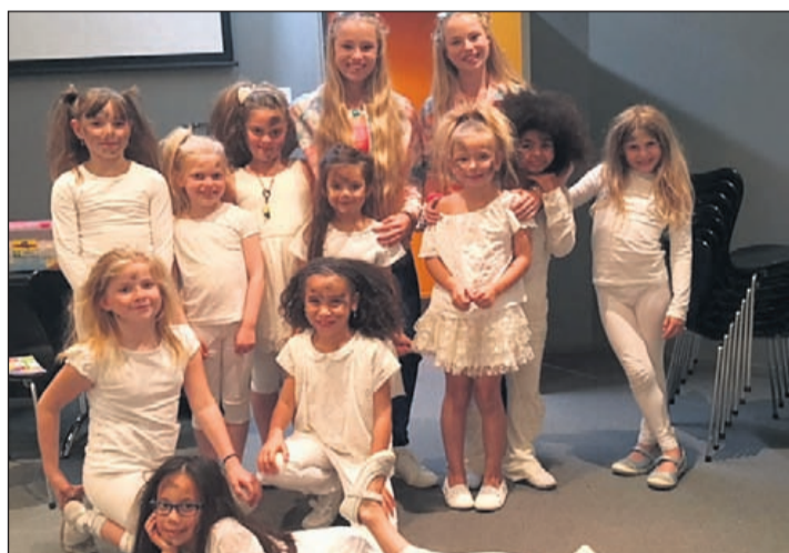
tot 14 zullen zij musicallessen gaan verzorgen bij Dans en Partycentrum