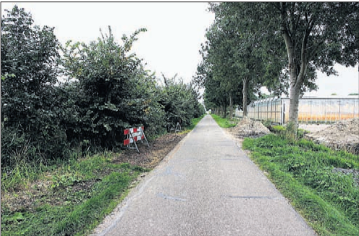
De smalle Schattekerkerweg voldoet naar de mening van de omwonenden al lang niet meer aan de moderne eisen voor het afwikkelen van verkeer en zwaar transport