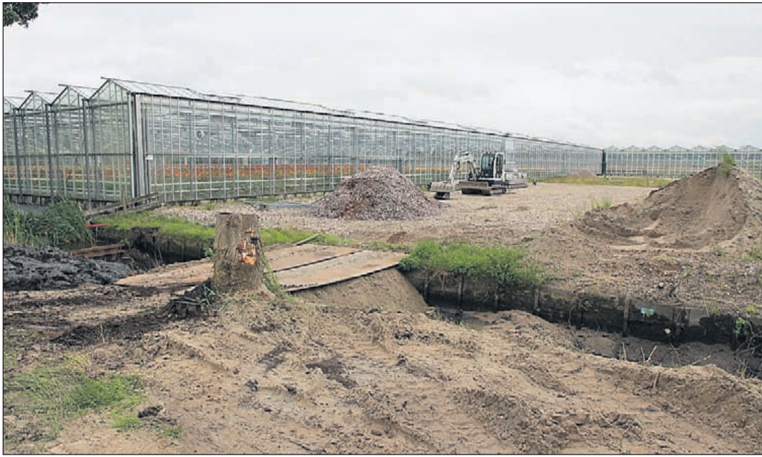
De locatie achter de kassen van gerberakweker Simon Zwarts waar het project gerealiseerd wordt.