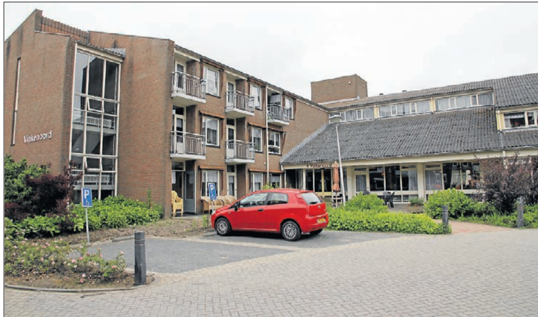
De mogelijkheid bestaat dat Vinkenoord als zorginstelling wordt gesloten.

INFORMATIE: ☎ 0297-581698 ☎ 06-53847419 ✉ VERKOOPMIJDRECHT@MEERBODE.NL