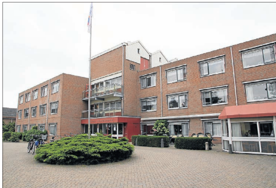
Nieuw-Avondlicht gaat halverwege volgend jaar dicht om nieuwbouw mogelijk te maken

"Is het College van bovenstaande op de hoogte en wat gaat zij hier aan doen," vraagt de fractievoorzitter zich af. "Aangezien de vakantietijd voor de deur staat en de nood blijkbaar hoog is bij Maria-Oord dient dit naar onze mening de hoogste prioriteit te krijgen. Onze inwoners, zeker als het om de kwetsbaarste gaat, mogen niet de dupe worden. Gezien de urgentie zien wij graag op korte termijn actie van u als college in de richting van Careyn Maria-Oord, teneinde de belangen van tenminste de cliënten zeker te stellen. In de commissievergadering van maandag (dat was 10 juni jl.