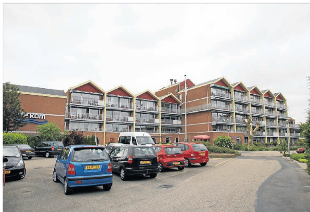
De Kom blijft bestaan en wordt op termijn gerenoveerd

red.) zullen wij hier zeker aandacht aan besteden. Graag willen wij dan ook inzicht in de situatie van de andere instelling(en)."