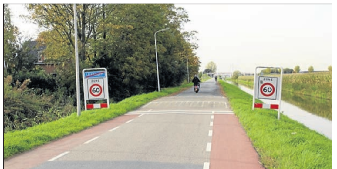
De Randweg wordt weer toegankelijk voor alle (gemotoriseerde) verkeer

Alle genodigden waren voorzien van een witte bouwhelm omdat dat 'voorschrift' is op een bouwplaats. De eerste paal werd geslagen op de plek waar woningen met huisnummer 20 en 21 zullen worden gebouwd. De eerste paal slaan ging tevens gepaard met het aanbieden van een geschenk. Kalliste schonk 5.000 euro aan het nieuwe buurtbeheer 'Buitendijks', bestemd voor de inrichting van de nog te realiseren centrale groenvoorziening (parkje) tussen de woningen van het nieuwe buurtschap. De locatie 'Buitendijks' ziet er nu nog als een stuk braakliggend land uit. Maar dat zal veranderen in een opvallend vormgegeven buurtschap met een groen karakter en een geheel eigen identiteit. Het plan en de daartoe behorende nieuwbouwwoningen zullen herkenbaar zijn als ontspannen, speels en eigentijds. De ecologische zone, het water, de oude spoorlijn en de woonwijk behorende tot de Legmeer, zullen dan op een gedurfde manier met elkaar verbonden zijn.