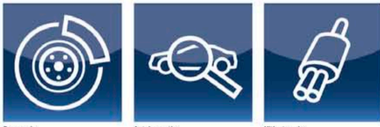
Remservice Autoinspectie Uitlaatservice

Ook voor Lease auto's en levering nieuwe Fords