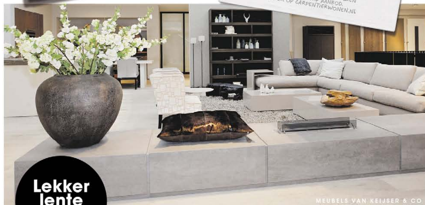
MEUBELS VAN KEIJSER & CO