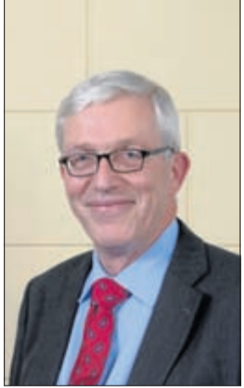
"Tegen, we hebben supermarkten genoeg"