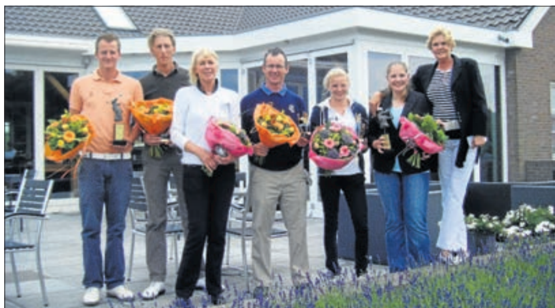
Op de foto de winnaars Dames en Heren van 2011