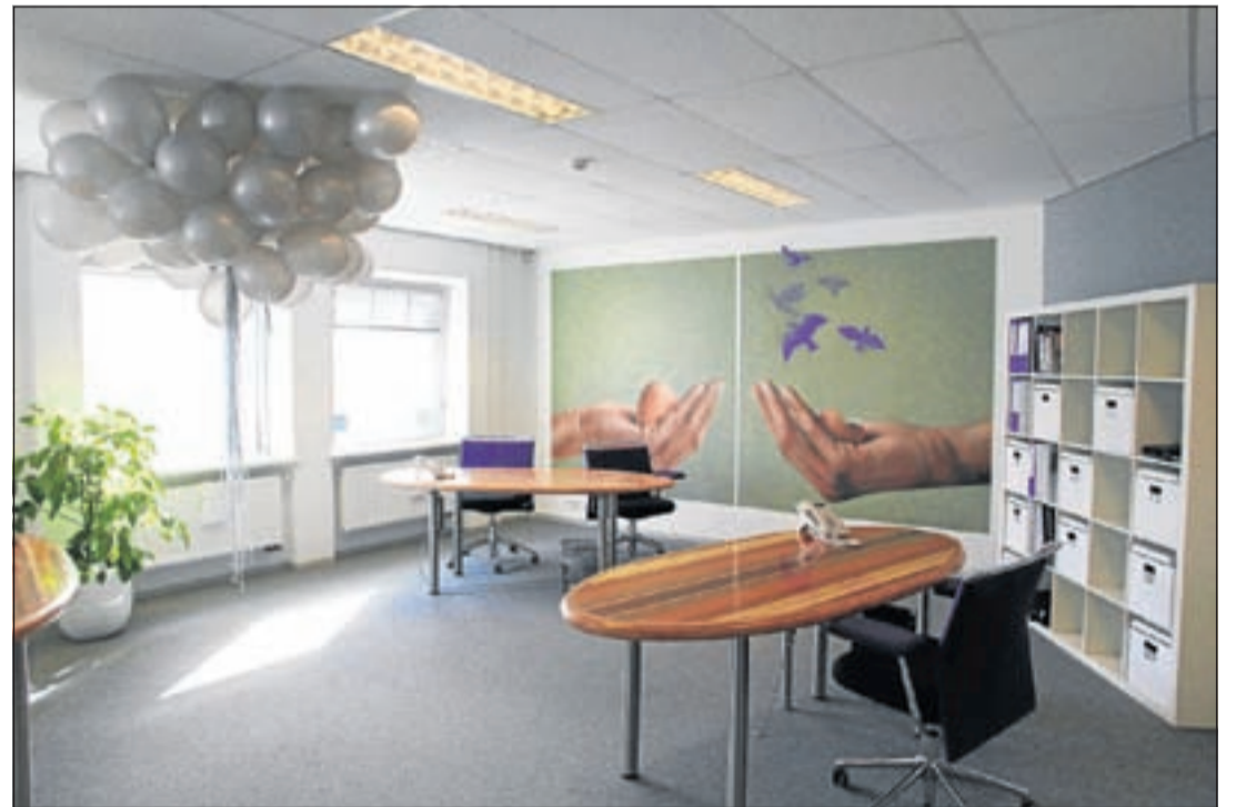
Een van de modern vormgegeven en creatief ingerichte werkruimten

Daarvoor zijn verschillende technieken aan te leren die direct effect zullen hebben. Is dit manipulatie?