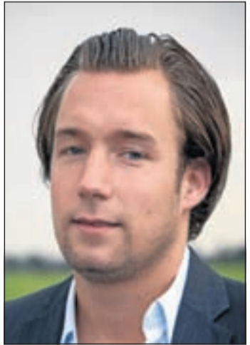
"Hiermee kun je het centrum van Mijdrecht versterken"

Mijdrecht - Bijna de gehele gemeenteraad van De Ronde Venen heeft vorige week donderdagavond ingestemd met het tekenen van een samenwerkingsovereenkomst met projectontwikkelaar en supermarkteigenaar Hoogvliet om te komen tot een totale vernieuwing van winkelcentrum Molenhof, het bouwen van een veertigtal woningen en een parkeergarage. Dit ambitieuze plan wordt voor de volle 100% bekostigd door Hoogvliet.