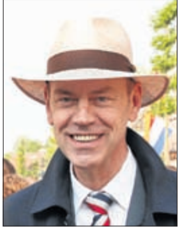
"Uit deze overeenkomst straalt vertrouwen"