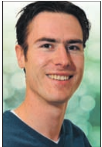
"Genoeg puntjes nog, maar laten we beginnen"