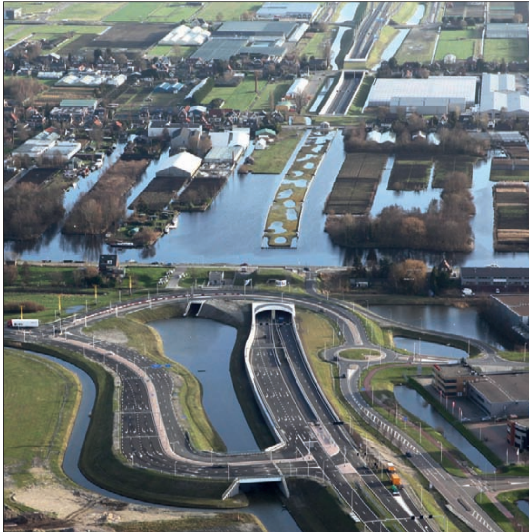
De Waterwolfunnel onder de Ringvaart ter hoogte van Schiphol-Rijk. Boven de open tunnelbak met de weg in de richting van Uithoorn. Beneden de afslag links naar Schiphol-Oost, rechtsonder naar Schiphol-Rijk.

INFORMATIE: 0297-581698 06-53847419 VERKOOPMIJDRECHT@ MEERBODE.NL