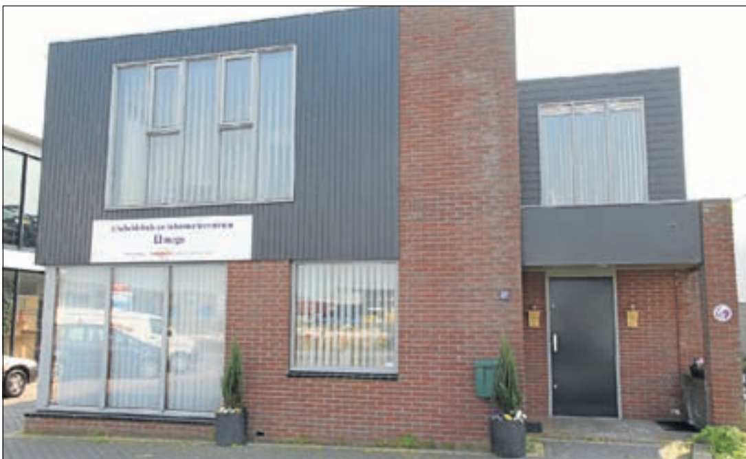
Het Afscheidshuis en Informatiecentrum Omega aan de Industrieweg

'Yarden & Van de Westeringh' biedt zijn diensten aan in het rayon vanaf het Wijdemeren gebied via De Ronde Venen tot aan Hoofddorp. In die regio wonen ongeveer tienduizend mensen die bij Yarden verzekerd zijn voor hun uitvaart. Als daar iemand van overlijdt verzorgt Van de Westeringh met zijn team van mensen daarvoor de uitvaart. Maar ook als men anders verzekerd is kan men gebruik maken van die dienstverlening. Van de vele duizenden uitvaartondernemers zijn er slechts 120 gecertificeerd, waarvan 'Yarden en Van de Westeringh' er in de regio een van is. De controle of men voldoet aan het Keurmerk is zeer streng en omvat alle facetten van de uitvaart! Yarden & Van de Westeringh onderscheidt zich hierin. Vanaf 3 mei is er elke eerste dinsdag van de maand van 19.00 tot 21.00 uur een vrijblijvende inloopavond. Dan is er gelegenheid om informatie op te vragen over onder andere het rouwproces, uitvaart, verzekeringen, kosten, etcetera. "Wie daar behoefte aan heeft kan met een van ons een gesprek aangaan over deze onderwerpen. Het is daarbij niet de bedoeling om verzekeringen te verkopen. Verder willen wij samen met Yarden eenmaal in de drie maanden een thema-avond organiseren voor nabestaanden waarin wij bijvoorbeeld nazorg aanbieden voor rouw, verwerking enzovoort en - voor zover men dat wil - nabestaanden aan elkaar te koppelen." Aldus Jan van de Westeringh, die in voorkomende gevallen altijd aanspreekbaar is voor uitvaartzorg of nadere informatie (06-53630447).