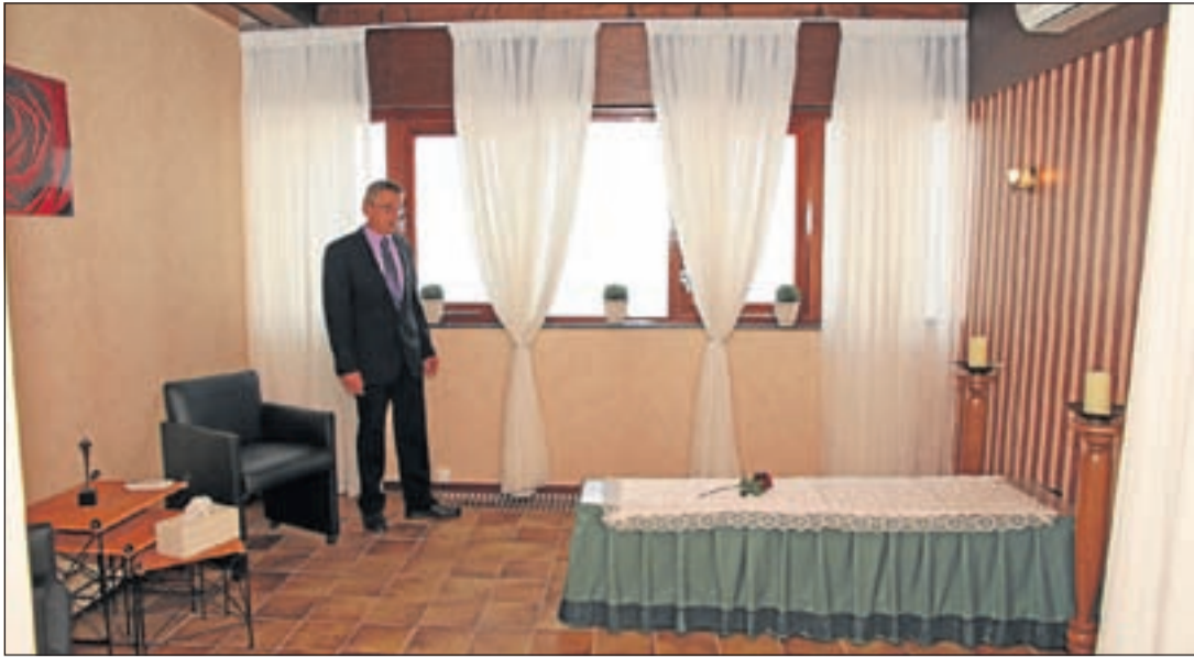
De Familiekamer is naar believen voor een langere tijd beschikbaar om afscheid te nemen