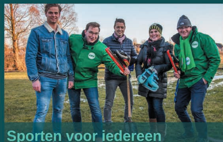
Sporten voor iedereen