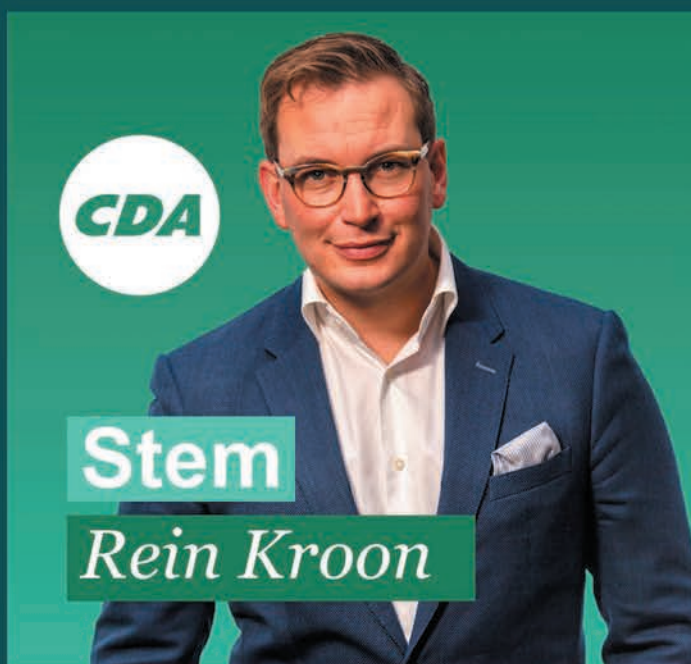
Stem Rein Kroon