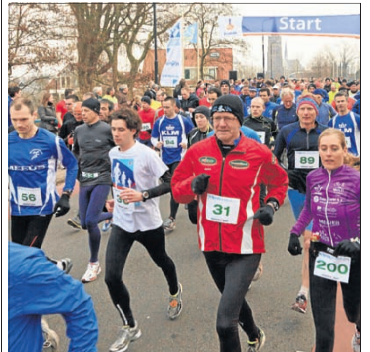
De start van de halve marathon in 2011.