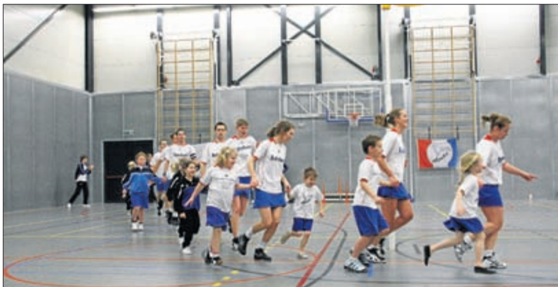
Atlantis 1 verliest van VZOD.

een overwinning had gekregen en de tweede helft vast en zeker de betere spelers in de ploeg zou brengen, om zo toch nog de punten te pakken. Dit bleek geheel waar. Direct na rust maakte VZOD de 6-6. Atlantis 1 kwam na die gelijkmaker door middel van een vrije bal nog voor een laatste keer op een voorsprong en daarna nam VZOD de leiding over. Atlantis 1 ging weer zonder punten en zeer teleurgesteld van het veld af. Er had meer ingezet, de ploeg had de eerste helft de kans om over VZOD heen te lopen, maar deed dat niet. Op zaterdag 26 februari zal de volgende thuiswedstrijd plaatsvinden. Atlantis zal Fluks ontvangen in sporthal de Willisstee te Wilnis om 15.50 uur.