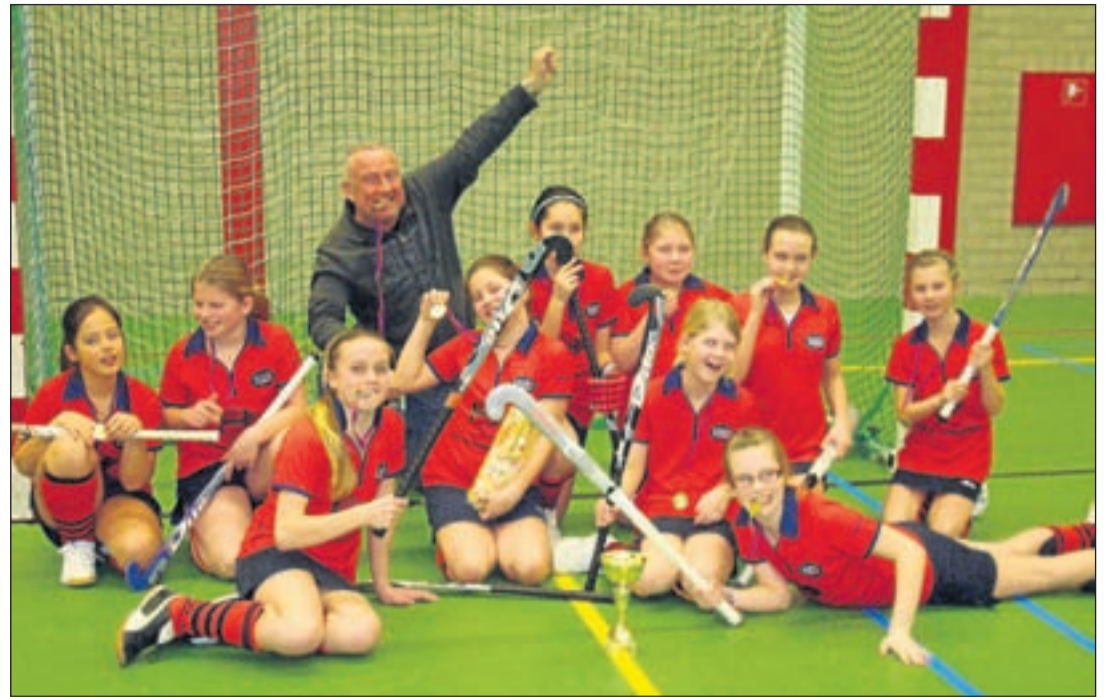
Het team van de zaalhoockey bestond uit een samenvoeging van meisjes uit de 8D2 en de 8D3. Zie hier de kampioenen !!

Mogen de jongens van HVM C2 zich met recht en trots kampioen van de zaalhoockeycompetitie 2010/2011 noemen. Dit werd dan ook direct na de wedstrijd gevierd met Bubbels.