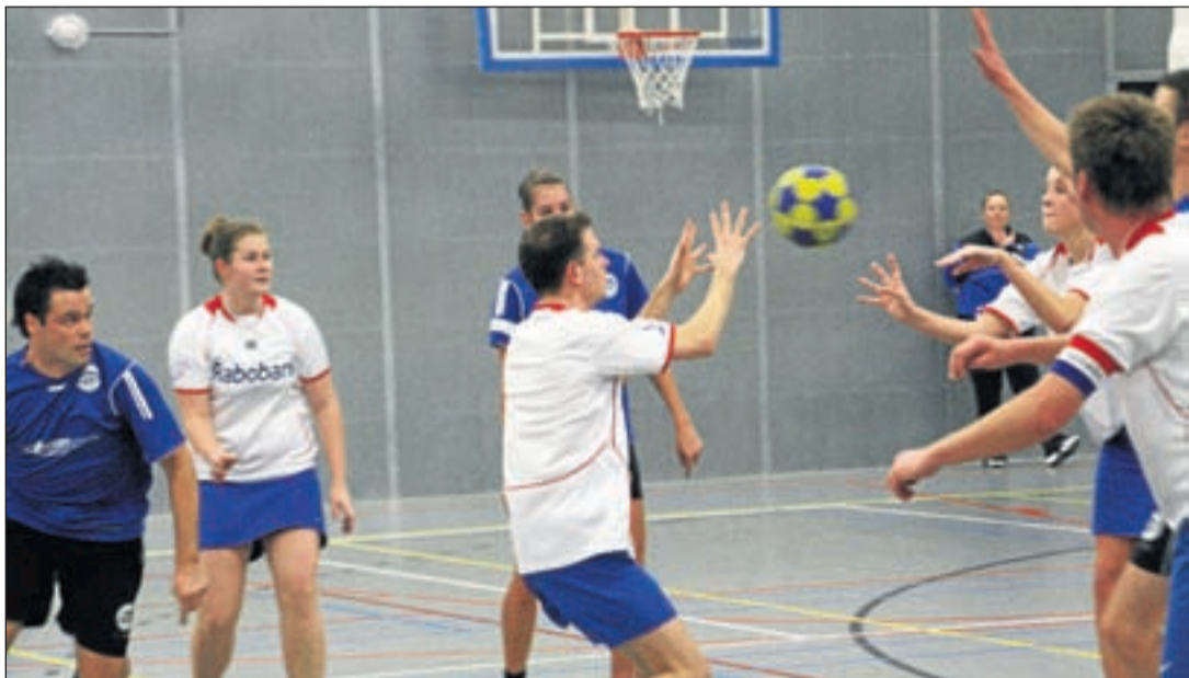
Atlantis 2 in actie

werd als snel 6-10. Toch wist Atlantis zich terug te knokken tot 10-12. Helaas was dit niet genoeg om de wedstrijd om te draaien. VZOD bleef scoren, en het vertrouwen van Atlantis werd steeds minder. Hierdoor werd het verschil vergroot met zes punten. De uiteindelijke uitslag werd 12-18. Atlantis 2 kan dit beschouwen als een off-day. Zaterdag 26 februari heeft Atlantis 2 de mogelijkheid om zich tijdens de inhaalwedstrijd tegen Fluks 2 te reanvanceren. Deze wedstrijd zal worden gespeeld in sporthal De Willisstee te Wilnis om 14.30 uur.