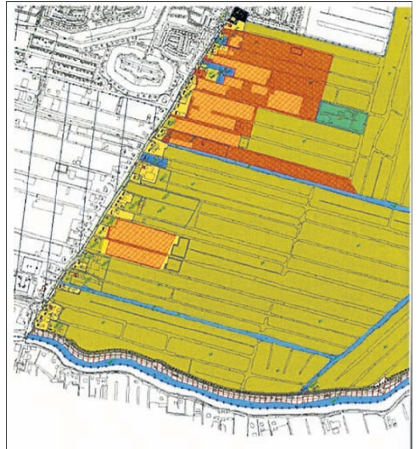
De Uithoornse polder wordt een veenweide natuurgebied. Daarin past geen glastuinbouw voor de productie van sierteeltgewassen.

Versterking landelijke gezicht Aanleiding voor dit 'Ruimte voor Ruimte' project is de Structuurvisie die in 2009 door de gemeenteraad van Uithoorn is vastgesteld. Daarin is het veenweidegebied, gelegen in de bovenlanden van de Amstel, aangegeven als onderdeel van het 'dorpse, landelijke gezicht'. Instandhouding en versterking van dit gebied zijn een belangrijke doelstelling. Langs de Amstel en aan de zuidoostzijde van de Drechtijk liggen nog verspreide kleinschalige kassencomplexen. Sommige bedrijven functioneren nog goed, andere staan leeg. Doelstelling van de visie is om deze kassen te saneren en de gronden te bestemmen en te gebruiken als weidegrond om zo het karakter van het landelijke gezicht te versterken. In totaal komt