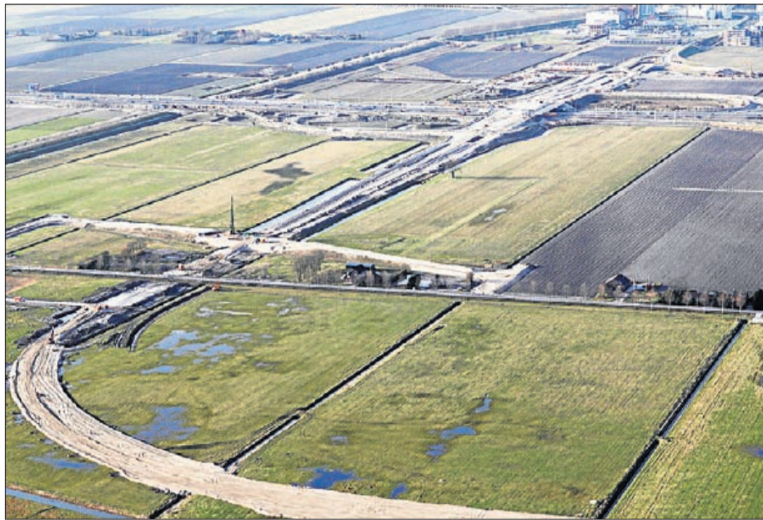
De in aanbouw zijnde aansluitingen van de N201 op rijksweg A4 - bovenkant foto - lopen vertraging op

Regio - Het kopen van illegaal vuurwerk is strafbaar. Bovendien vormt (illegaal) vuurwerk dat in woonbuurten of andere niet veilige plekken wordt opgeslagen, een gevaar voor omwonenden. Jaarlijks vinden persoonlijke ongelukken plaats met (illegaal) vuurwerk, met ernstig letsel of zelfs dodelijke slachtoffers tot gevolg. De politie vraagt het publiek om meldingen over illegaal vuurwerk door te geven via 0900-8844 of (via Bel M.) 0800-7000.