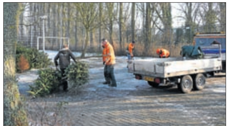
Vorig jaar werd druk geslept met kerstbomen. De jeugd zag kans om geld te verdienen! En zo kwamen ook nog eens de oudere inwoners gemakkelijk van hun boom af!

Kudelstaart - Twee jongens van 15 jaar oud zijn dinsdag 21 december rond half elf in de avond aangehouden op verdenking van vernieling. Zij zouden met enkele andere jongens een ruit hebben ingegooid van een huis aan de Mijnsheerweg. De jongens zijn na begeleiding bij de hulpofficier van justitie naar huis gestuurd en zullen binnenkort worden ontboden aan het bureau voor verhoor.